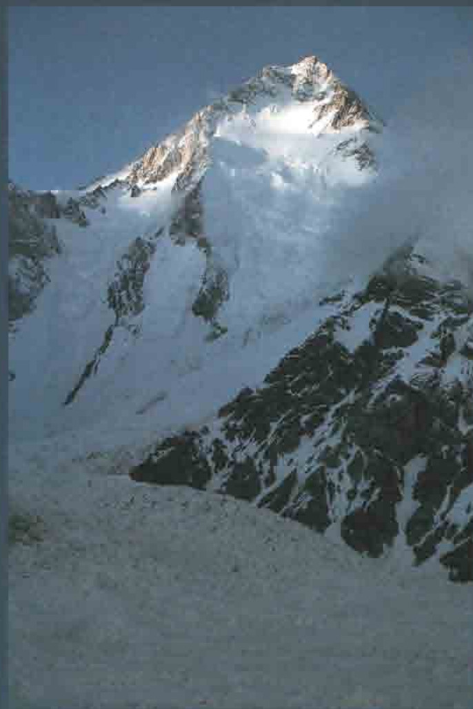
Oben: Hidden Peak Rechts: Gasherbrum II