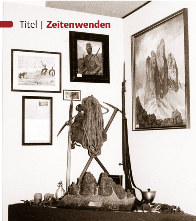
Ein Arrangement um die Alpingeschichte, OeAV-Museum in Innsbruck, 1970er

welches maßgeblich auch durch EU Gelder finanziert wird, da es die Zusammenführung und Dokumentation der Bestände in einer gemeinsamen Datenbank zum Ziel hat.