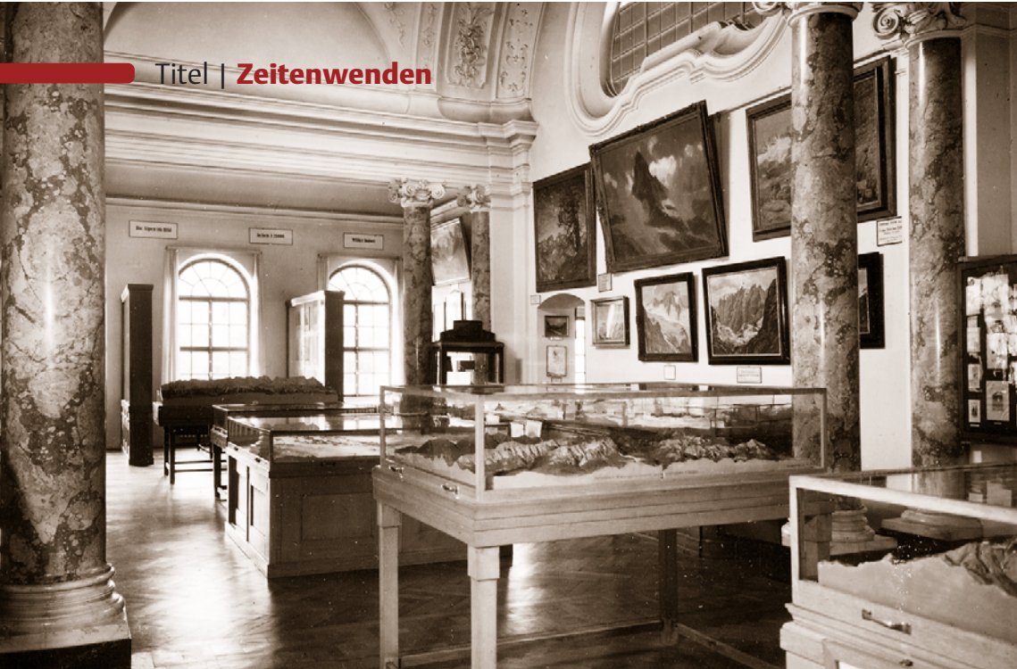
links Großzügiger Kuppelsaal des ursprünglichen „Alpen Museums“ in München, 1930er