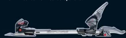
Diamir Explore: Der Touren-Experte