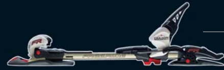
Diamir Freeride: Der Freeride-Spezialist