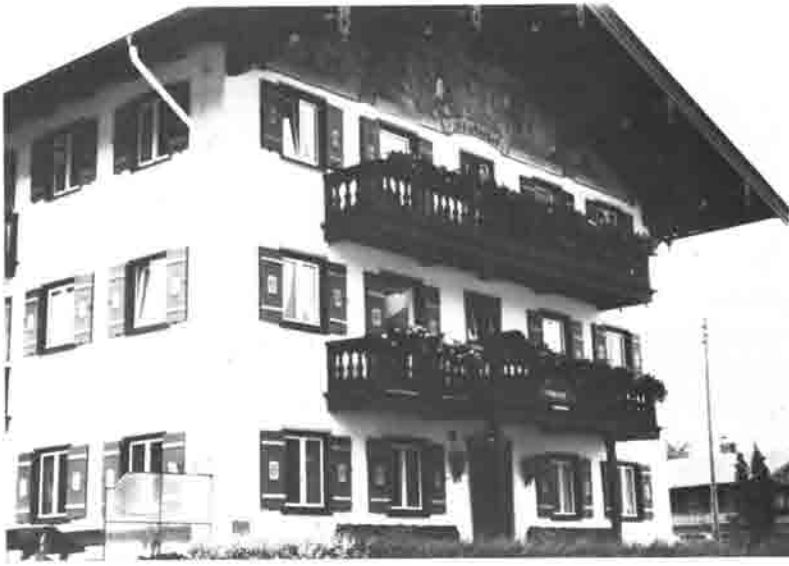
Das Anwesen Stuffer-Hof in Egern