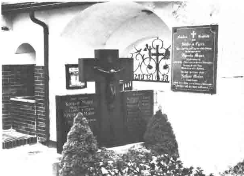
Stuffer Familiengrab im alten Egerner Friedhof