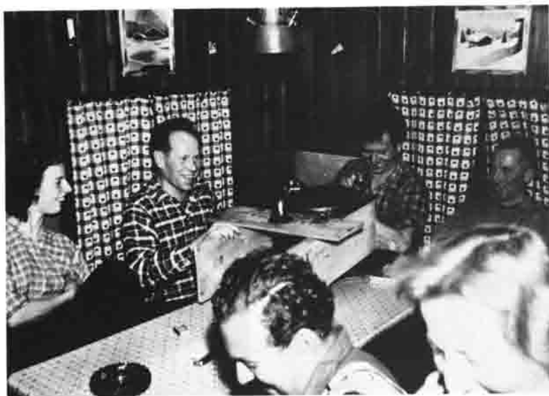
Gemütlicher Hüttenabend mit 5-stündiger Gramola-Reparatur.