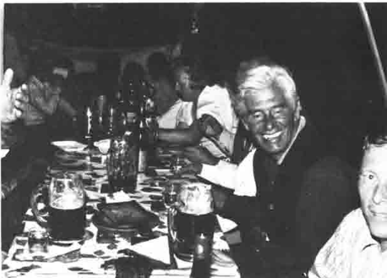
Ein Schnappschuß vom 50jährigen Pachtjubiläum, 19. August 1973