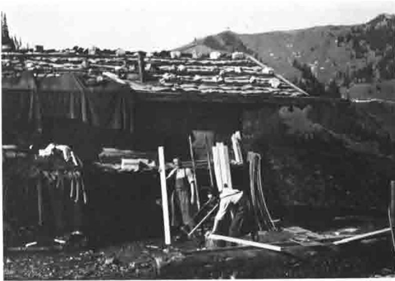
Röthenstein-Alm im Jahre 1924, beim Umbau des Schlafraumes.