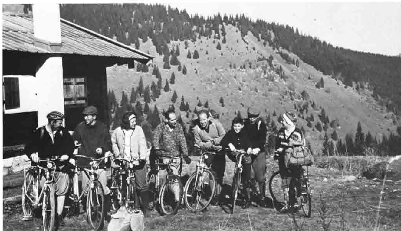
1964: Per Fahrrad von München auf die Hütte.

Allen aktiven Helfern und Freunden nochmals ein herzliches Dankeschön, denn nur mit ihnen kann ich mir vorstellen, dieses Amt noch einige Zeit auszuüben.