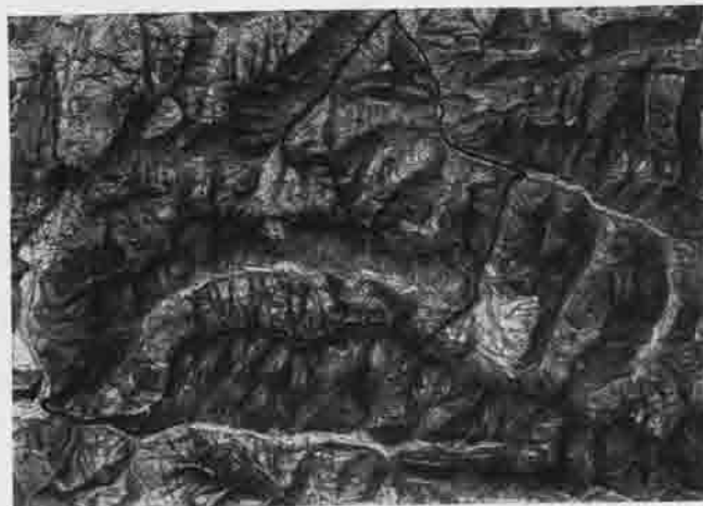
Das Arbeitsgebiet der Sektion M. T. V. im Karwendel