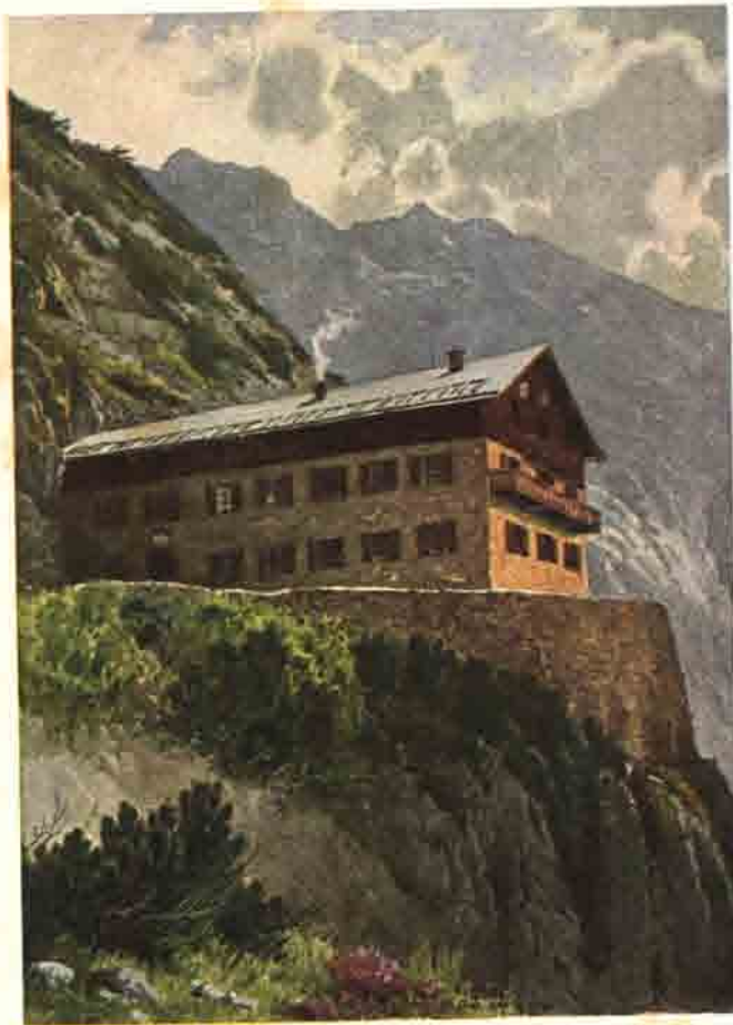
Nach einem Aquarell von Hans Frey.