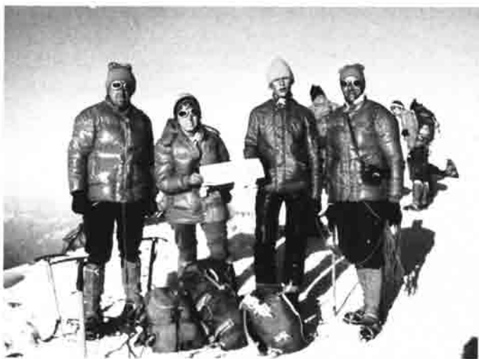
Aus Anlaß des 25-jährigen Bestehens auf dem Mont Blanc 4807 m.

Außer dem Grasskillauf im Sommer konnte die Skiabteilung in heimischen Gelände keine Übungen durchführen, es fehlte der Schnee. Die fünf Bergfahrten zu alpinem Gelände fanden jedoch großen Zuspruch.