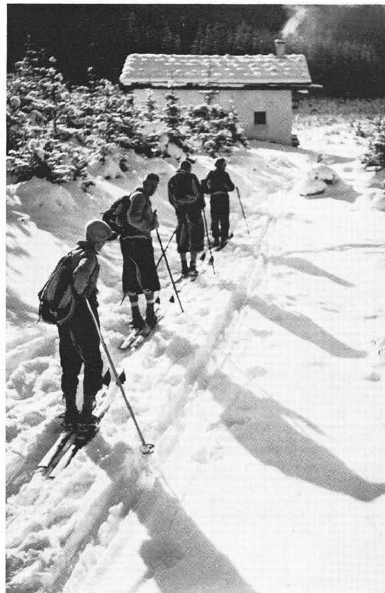
In guten wie in schwierigen Jahren war diese Forstdiensthütte ein gernbesuchter Stützpunkt zu allen Jahreszeiten. In ihr fanden prächtige Hüttenabende statt; von ihr aus stieg man auf zu Gipfeltouren und Skiabfahrten