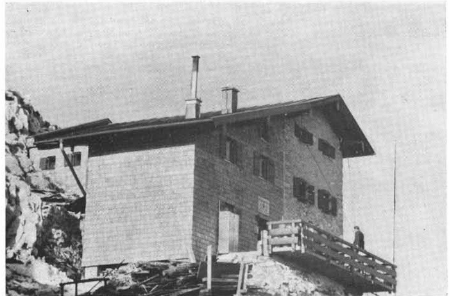
Das Reichenhaller Haus der Sektion nach seinem Ausbau im Jahre 1974

Der Ski-Club Bad Reichenhall beging am 5. Mai 1973 sein 50jähriges Bestehen. Er hält getreu die einstige Verbindung mit der Sektion aufrecht durch die alljährlichen Veranstaltungen des Pewo-Pertsch-Laufes am Predigtstuhl und des Anderl-Hinterstoßer-Staffellaufes auf der Reiteralpe.