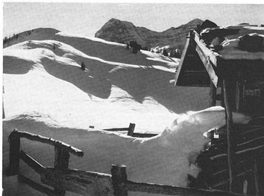
Der „Bräukaser“ auf der Lofereralm wurde 1929 ein „Daheim“ für viele Bergfreunde

geht hervor, daß 1939 15, 1940/41 14, 1943/44 33 Hilfeleistungen und Bergungen erfolgten. Den Männern der BW wurde im Jahre 1944 „allerhöchste Anerkennung“ für ihr Einsätze übermittelt.