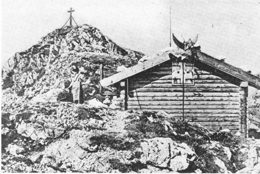
Die erste Sektionshütte auf der Westseite des Staufengipfels – 1908

stauen beseitigt werden; der Klettersteig über die „Steinernen Jäger“ wurde markiert. Wetterschäden zwang auch zu Reparaturarbeiten am Steig zum Sonntagshorn. – Aus der Stauen-Ostwand mußte ein tödlich abgestürzter Bergsteiger geborgen werden. – Auch im Jahre 1913 bildeten Wegebauten und -Ausbesserungen die Hauptaufgaben für die Sektion.