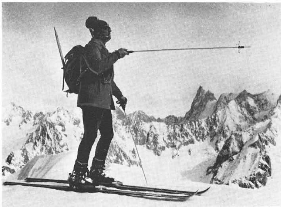
Der „Loisl“ weist seinen Bergkameraden beim Skiurlaub 1975 im Gebiet des Montblanc ferne und lockende Tourenziele

wurde einige Male wiederholt. Im Wilden Kaiser wurden Totenkirchl, Fleischbank, Ellmauer Halt bestiegen, in der Glocknergruppe dreimal Großglockner, dreimal Wiesbachhorn, viermal Kitzsteinhorn; Granatspitzgruppe: Sonnblick, Granatspitze, Hocheiser, Großvenediger, Schlieferspitze; Zillertaler Alpen: Olperer; Reichenspitzgruppe: Gflorene-Wandspitze; in den Stubai: Zuckerhüttl, Schaufelspitze, Habicht, Schußgrubenkogel; ferner Ortlergipfel (34 Teilnehmer), Ankogel (32), Bernina und Piz Palü (27); Dachstein und Bischofsmütze. Zahlreiche Sektionstouren führten in die Berchtesgadener Alpen, das Tennengebirge, ins Steinerne Meer, in die Loferer und Leoganger Steinberge, in das Rofangebirge und in die Kitzbüheler Berge.“ Alljährlich wurden so je fünf bis zwölf Touren geführt.