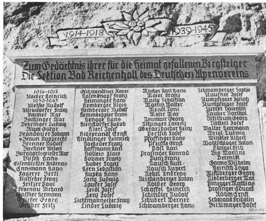
Dreiundneunzig Namen erinnern an die schweren Opfer der beiden Weltkriege

Mitglied Bildhauer Franz Xaver Zerle schaffte die Gedenktafel für die im Weltkrieg umgekommenen Sektionsmitglieder; sie wurde am Sonntag, 28. September 1952 unter dem Gipfelkreuz am Staufen feierlich eingeweiht; aus freiwilligen Spenden war das gute Werk finanziert worden.