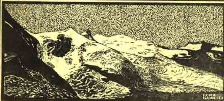
BLICK VOM LÖBBEN TEERL