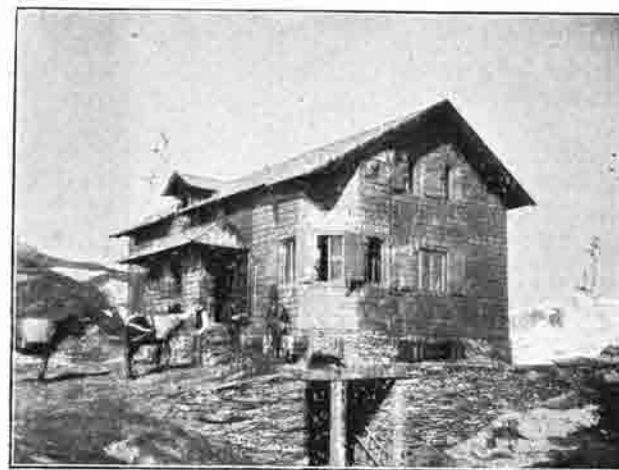
Die Badner Hütte (2620 Meter).

Der prachtvolle Sommer war für den Bau der Hütte äußerst günstig. Anfang Januar wurde die Hütte zerlegt und mit Bahn und Wagen nach