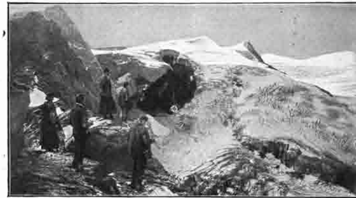
Am Löbbentörl, Blick gegen Hoher Tauern, Schwarze Wand, Großer und Kleiner Benediger, links Eisabbruch der Kristallwand.