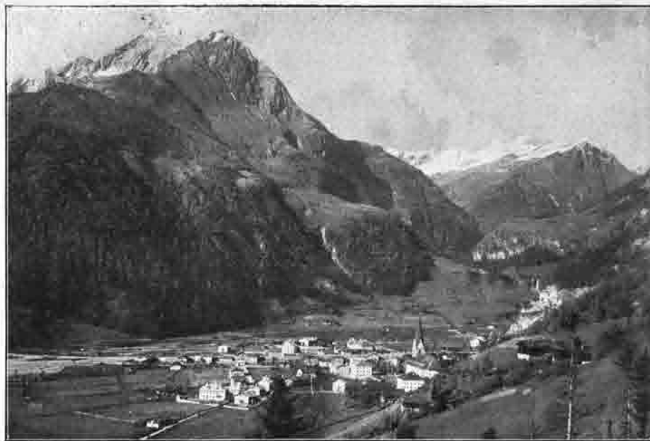
Ansicht von Windisch-Matrei.

Die Alpenvereinssektion Baden bei Wien beging am 3. Februar 1915 ihr 10. Stiftungsfest. Bereits im Jahre 1872 hatte in Baden eine Sektion des Deutschen Alpenvereins bestanden, doch nur 6 Jahre lang. Auf der Hauptversammlung zu Bludenz im Jahre 1873 nahm der Deutsche Alpenverein nach Vereinigung mit dem Oesterr. Alpenverein den Namen D. u. O. A. V. an, und so wurde die Sektion Baden eine Sektion dieses Vereines. Im Jahre 1878 führten Mißhelligkeiten in einigen oesterr. Sektionen zur Auflösung mehrerer Sektionen, darunter auch der Sektion Baden. In den nun folgenden Jahren wurden die meisten aufgelösten Sektionen neugegründet, nur in Baden kam es lange nicht dazu. Endlich im Jahre 1903 wurde der Gedanke gefaßt, auch hier eine Sektion entstehen zu lassen. Im Sommer 1904 hatten sich fünf junge, bergfrohe Leute zusammengetan, um aus Begeisterung für den Deutschen und Oesterreichischen Alpenverein in ihrer Vaterstadt Baden eine Ortsgruppe dieses großen Vereines zu gründen. Für den 25. November hatten sie eine Besprechung angefaßt. Das Ergebnis war äußerst erfreulich, nachdem die Gründung der Sektion durch die schriftliche Beitrittserklärung von 22 Herren gesichert schien.