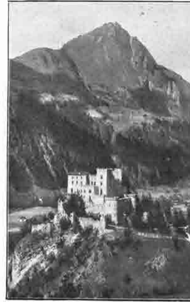
Schloß Weissenstein bei Windisch-Matrei.