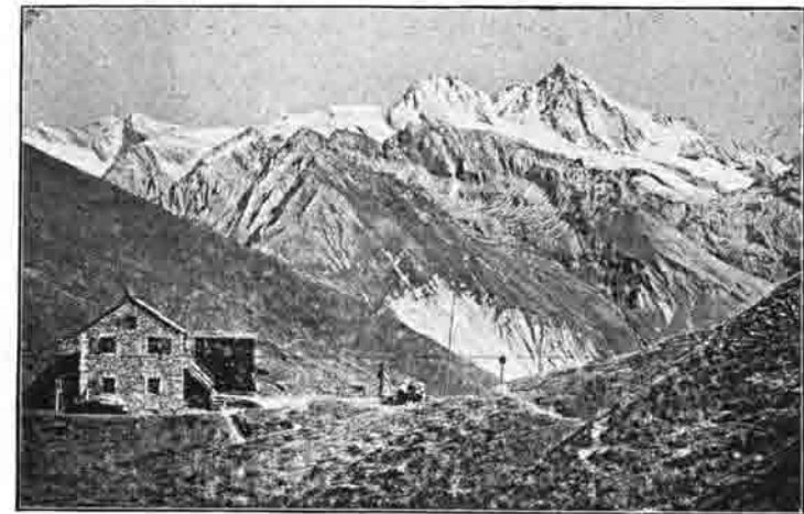
Die Badner Hütte mit der Hohe Achsel (3140 Meter).

Während draußen ein heftiges Gewitter niederging, entwickelte sich drinnen eine fröhliche Stimmung, die die Enge bald vergessen ließ. In der Gaststube speisten gleichzeitig 41 Personen, obwohl sie nur für 22 bestimmt