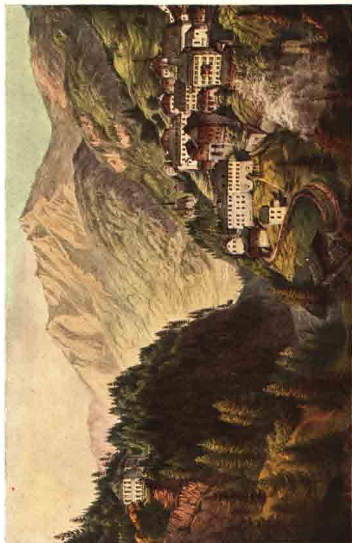
Badgastein in den Achtzigerjahren mit Gamskarkogel