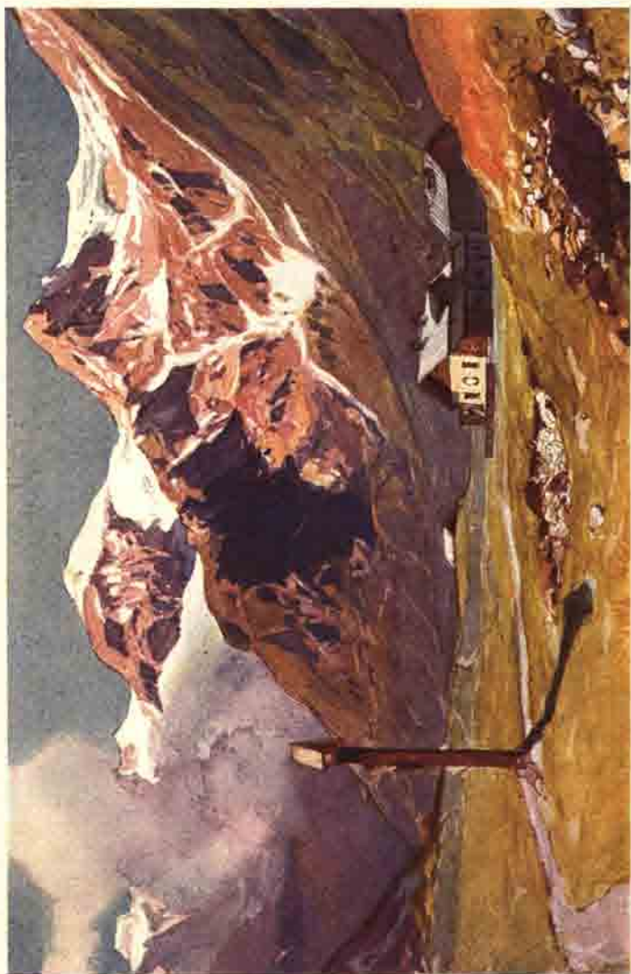
Naßfeld mit Valeriehaus, Geiselkopf, Murauer und Schlappereben

Neben diesen Aufgaben nahm sich die Sektion auch der Hebung des Bergführerstandes an, schlug geeignete Leute zur Autorisierung vor, verfaßte Bergführertarife und teilte die Führerstützpunkte ein. Bis 1908 hatte sie die Führeraufsicht inne; dann wurde damit die Sektion Salz-