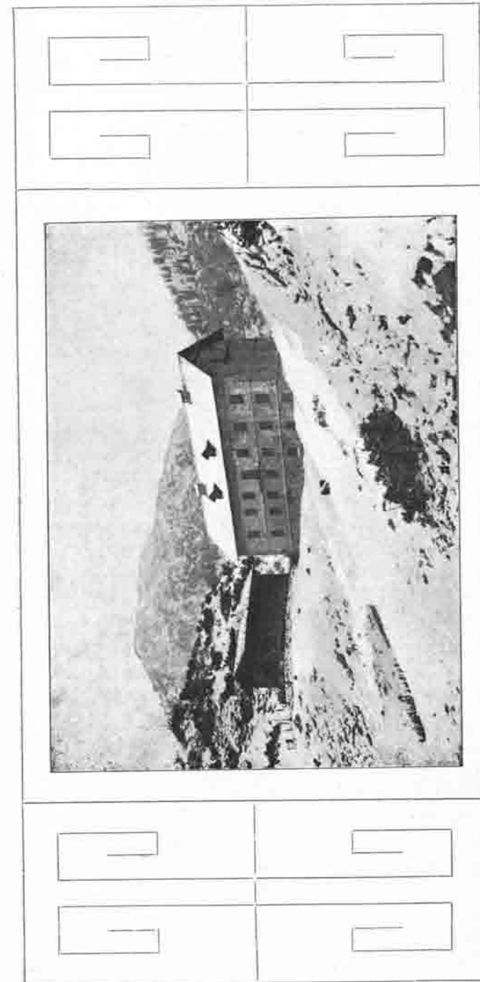
Alte und neue Funtenseehütte.

Wir hoffen zuversichtlichst, daß wir das Haus bis Anfang des kommenden Sommers fertigstellen und die zum Ausbau noch fehlenden Mittel, welche sich auf 10—12000 Mk. belaufen werden, voll und ganz aufbringen können, um es dann mit Beginn der Reisesaison seiner Bestimmung zuzuführen. Das Schlafhaus wird nicht nur uns, die wir es mit mancher Sorge erbaut haben, stets ein Werk der Freude und Befriedigung sein, sondern auch jenen, die als ermüdete Wanderer am Funtensee Einkehr haltend eine gemütliche Heimstätte vorfinden.