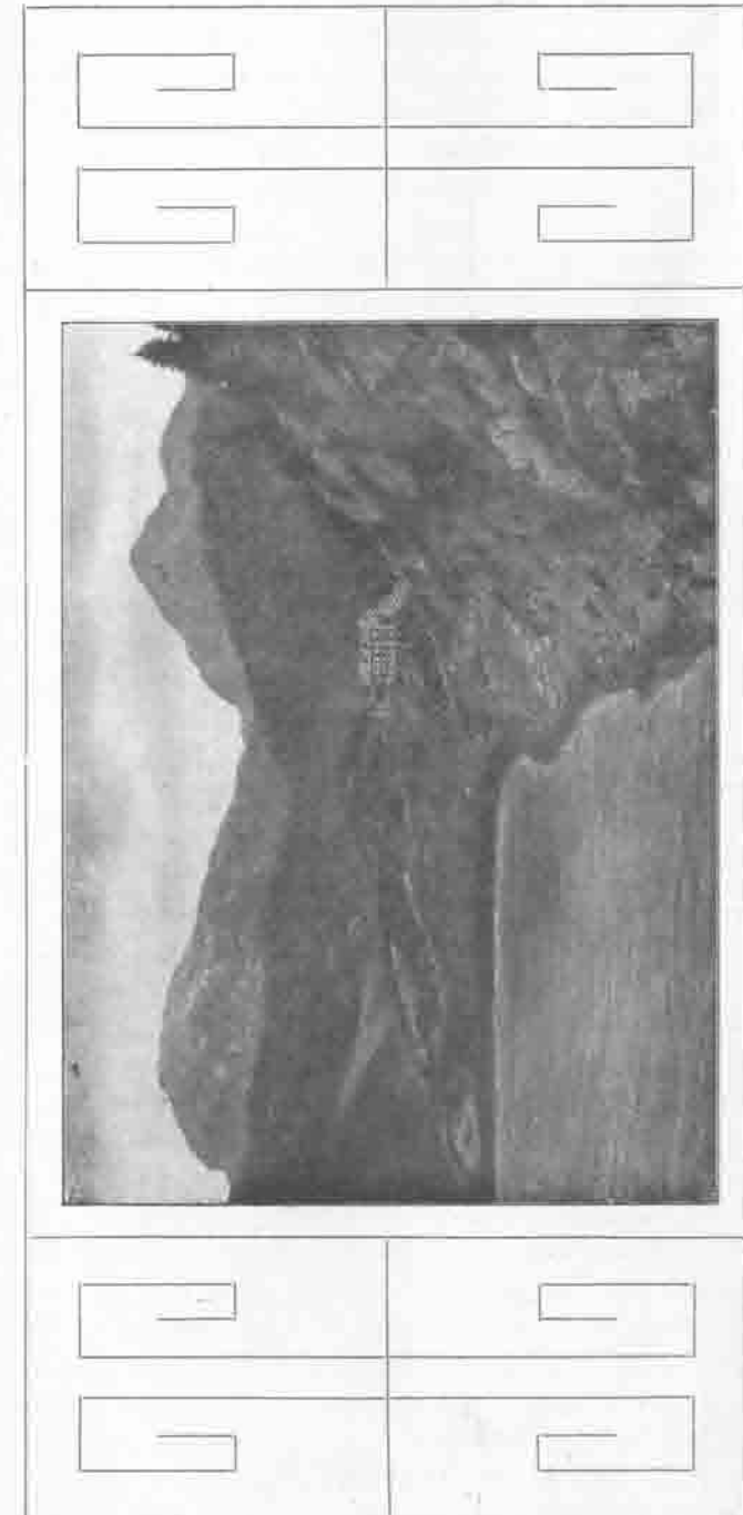
Funtensee mit der alten und neuen Unterkunfthütte.

Dem Rettungsausschuß war leider mehrfach Gelegenheit