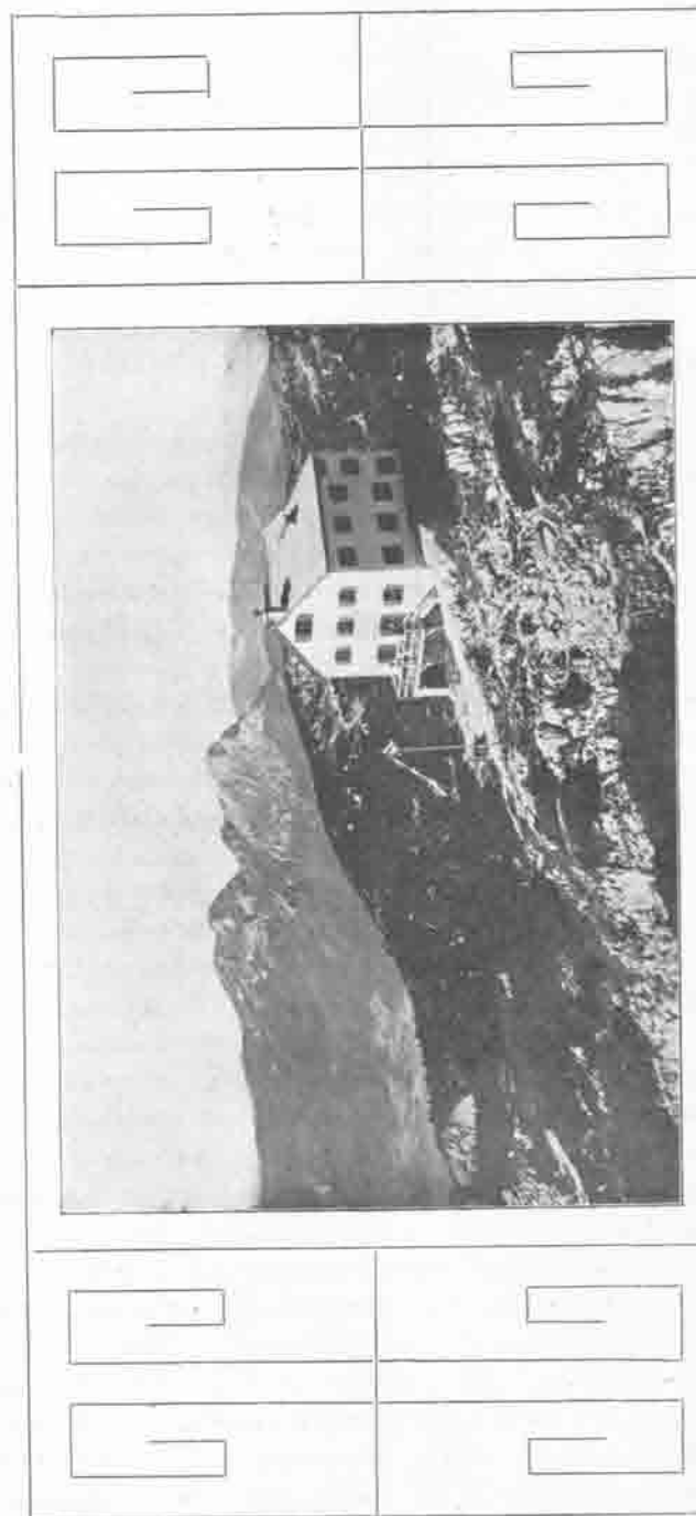
Stöhrhaus auf dem Untersberg.

Der Watzmann übte von jeher die größte Anziehungskraft auf die Touristenwelt aus. Als Wahrzeichen des Berchtesgadener Ländchens grüßt er stolz mit seinen zwei gewaltig in die Lüfte ragenden und durch den Watzmannletscher getrennten Bergzinken in das liebliche Tal und weiß jährlich viele Besucher in seinen Bannkreis zu ziehen. Hiezu kommt noch die Annehmlichkeit, daß derselbe über das Falzköpfchen verhältnismäßig unschwierig zu besteigen ist und schon anfangs der achtziger Jahre eine Steiganlage von unserer Sektion geschaffen wurde, welche die Besteigung wesentlich erleichterte und die schwierigen Stellen durch Anbringung von Drahtseilen zugänglicher machte.