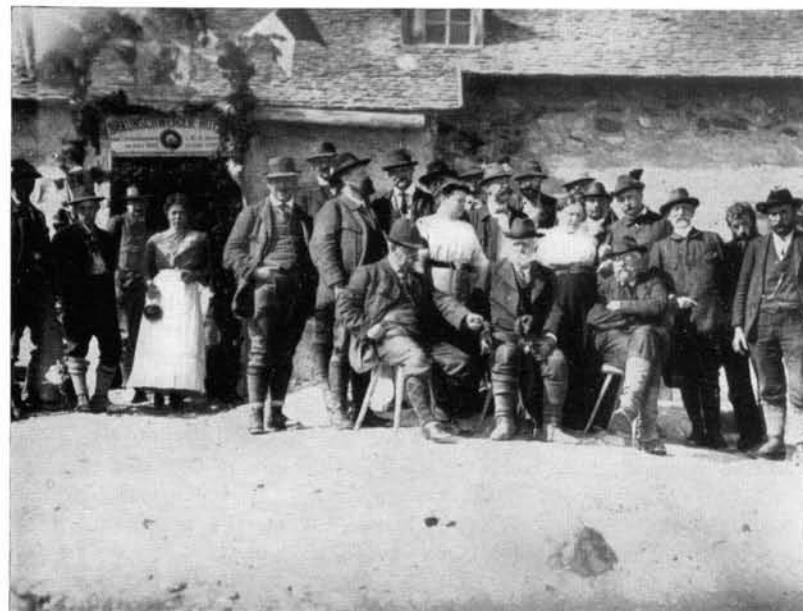
25jähriges Jubiläum auf der Braunschweiger Hütte

So stark war das geistige Band zu diesem Münchener Maler, daß man ihn bei uns zum Ehrenmitglied ernannte. Die Festschrift anlässlich des 25jährigen Bestehens der Sektion, die in ganz wenig Exemplaren im