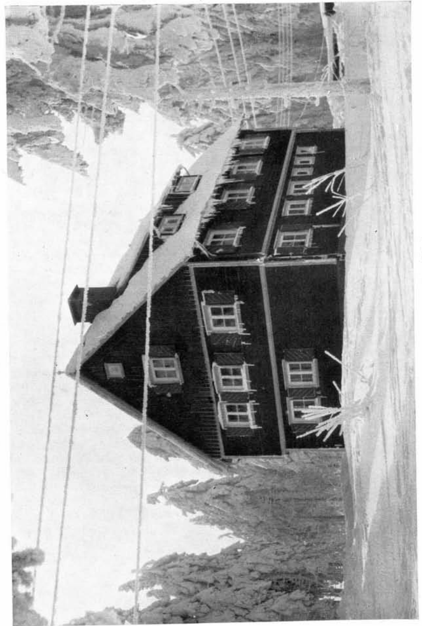
Die Torfhaus-Hütte im Harz (804m)