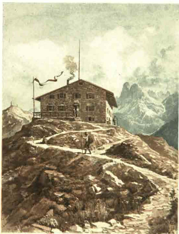
Plosehütte gegen den Peitlerkofel.

ausgegeben anlässlich der Eröffnung des Zubaues zur Plosehütte vom Sektionsausschuss. □