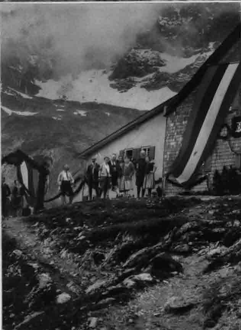
25jähriges Jubiläum Coburger Hütte 6. August 1926