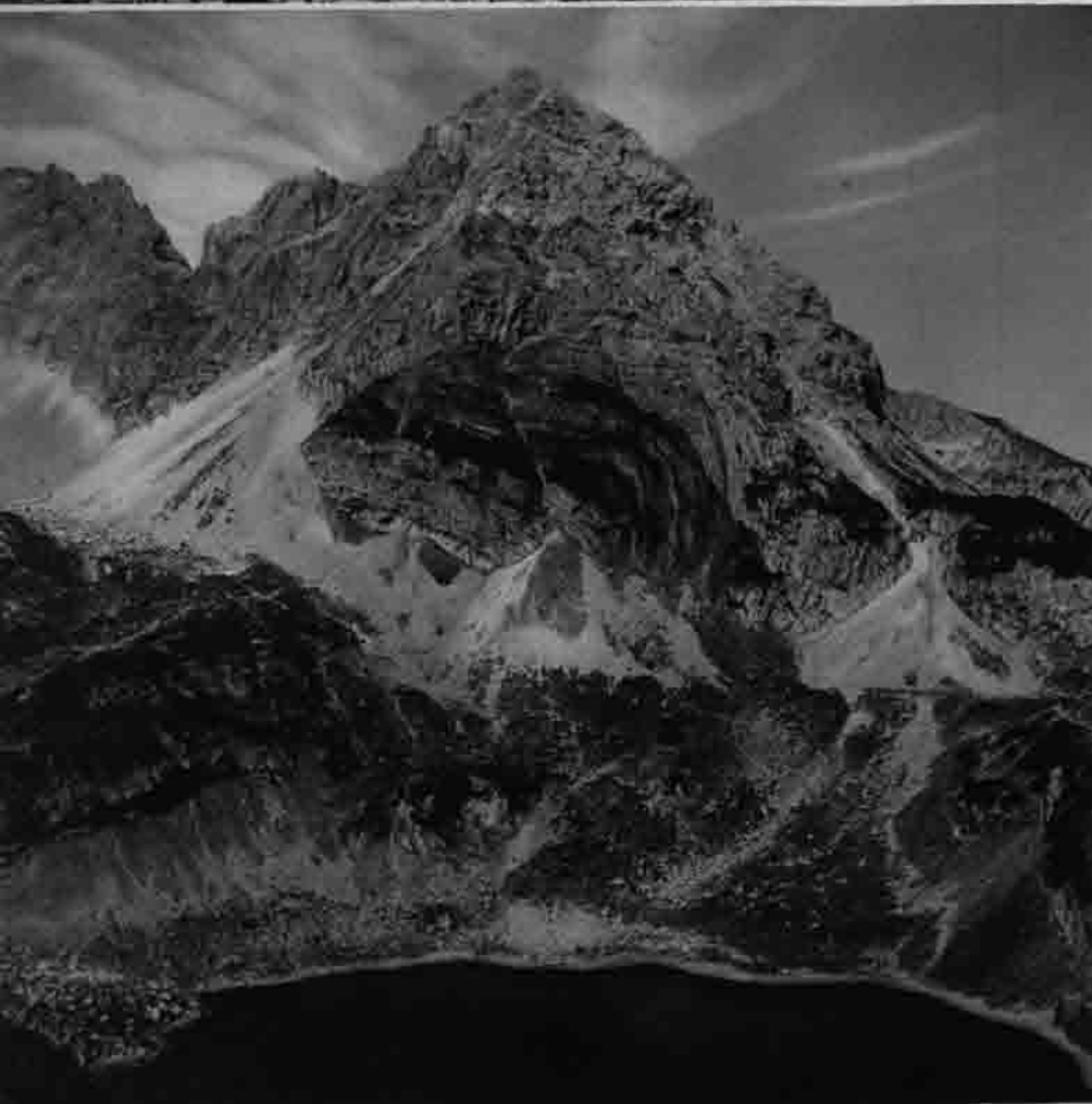
Drachensee und Vorderer Drachenkopf