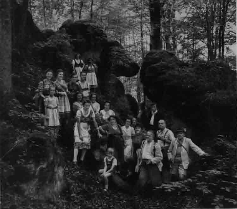
Im Wattendorfer Felsgarten