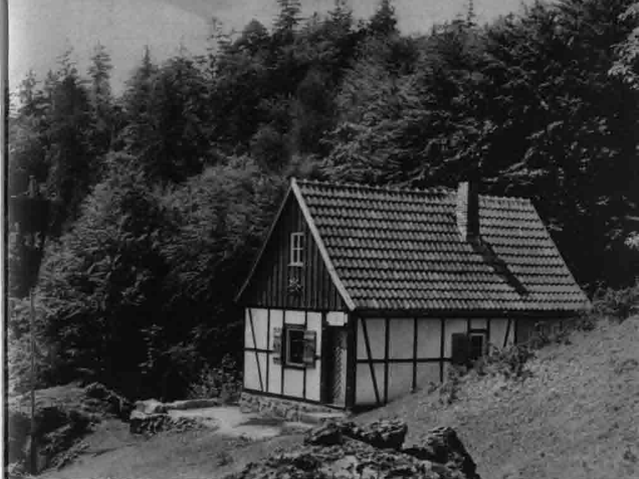
Jurahütte bei Wattendorf