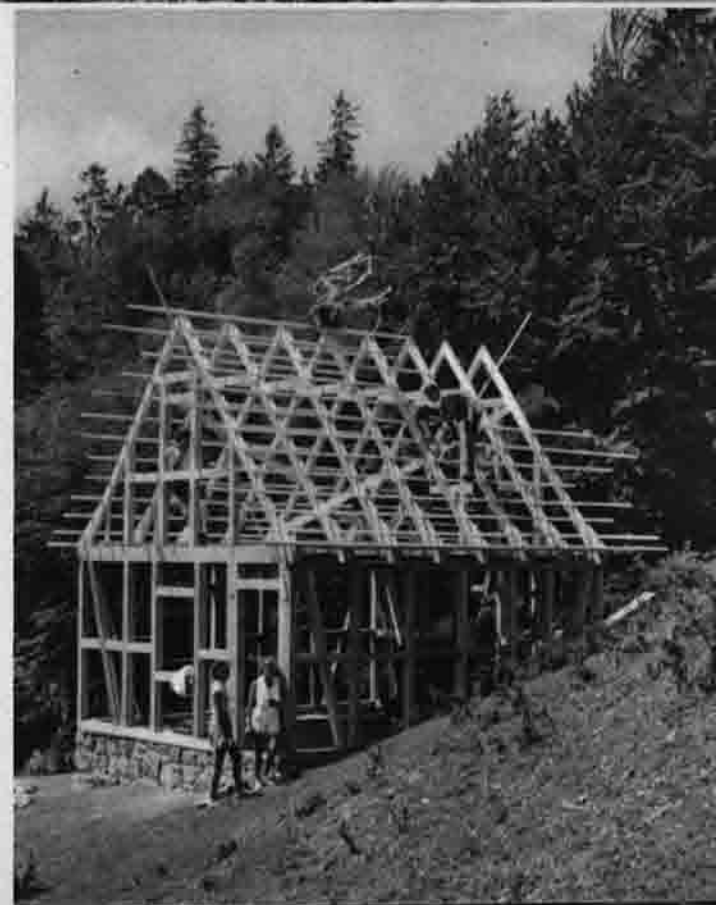
Wattendorfer Jurahütte im Bau