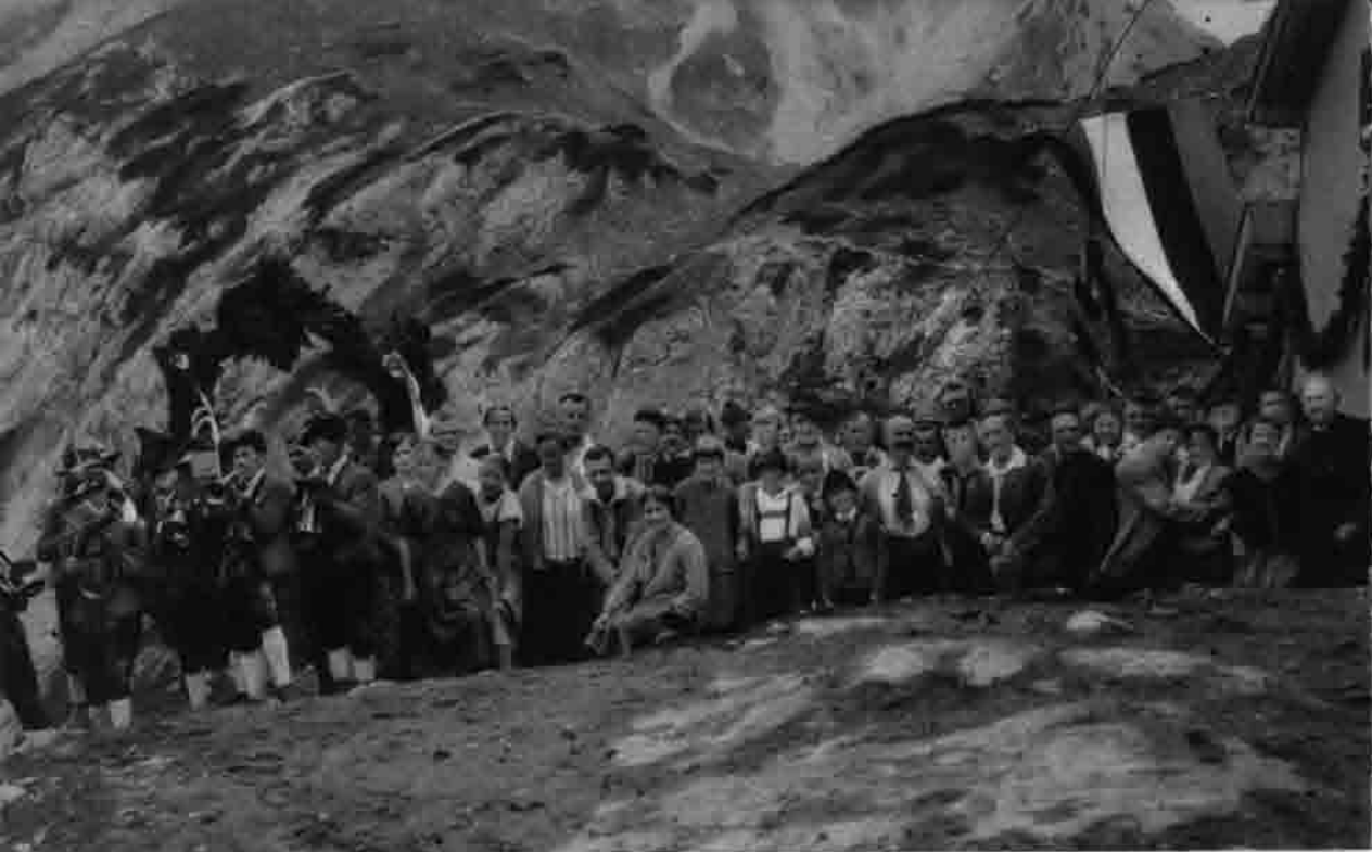
50jähriges Jubiläum Coburger Hütte 6. August 1951