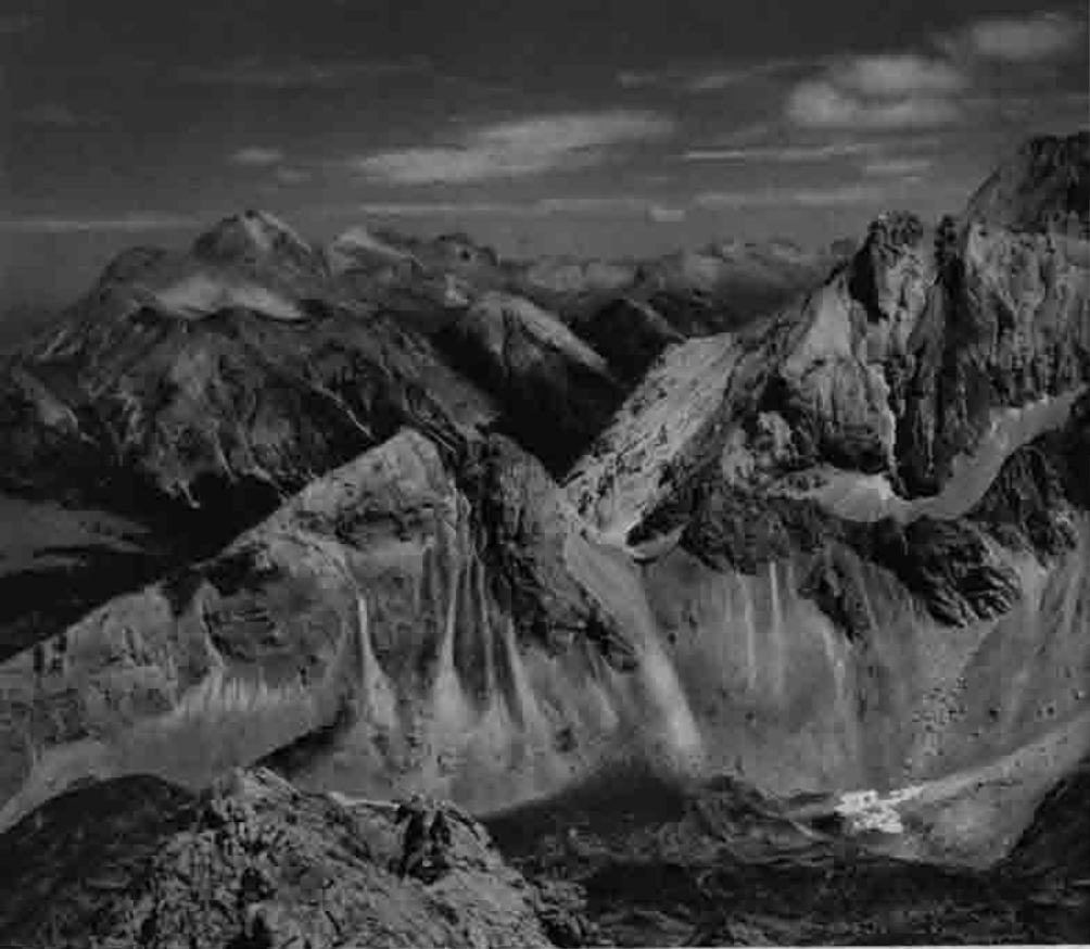
Brendelkar mit Igelscharte u. Breitenkopf vom hinteren Tajakopf