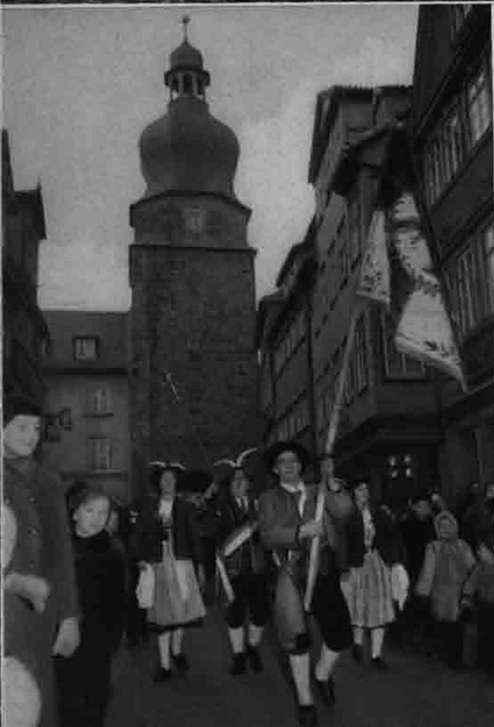
Einmarsch der Ehrwalder in Coburg