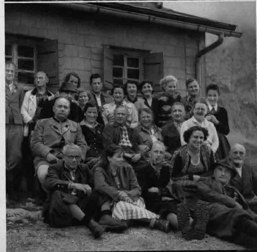
50jähriges Jubiläum Coburger Hütte 6. August 1951