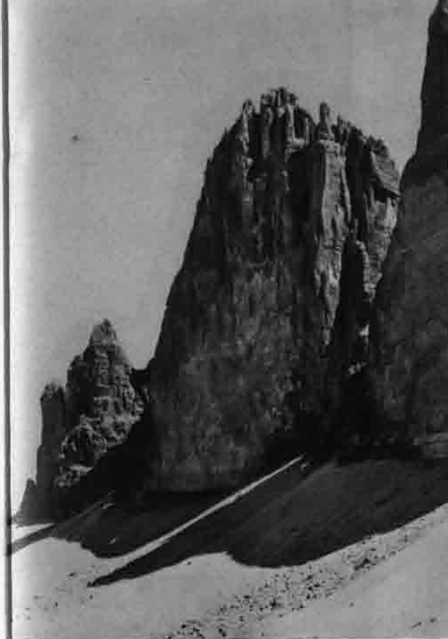
Bild unten rechts: Matterhorn (Schweizergrat)