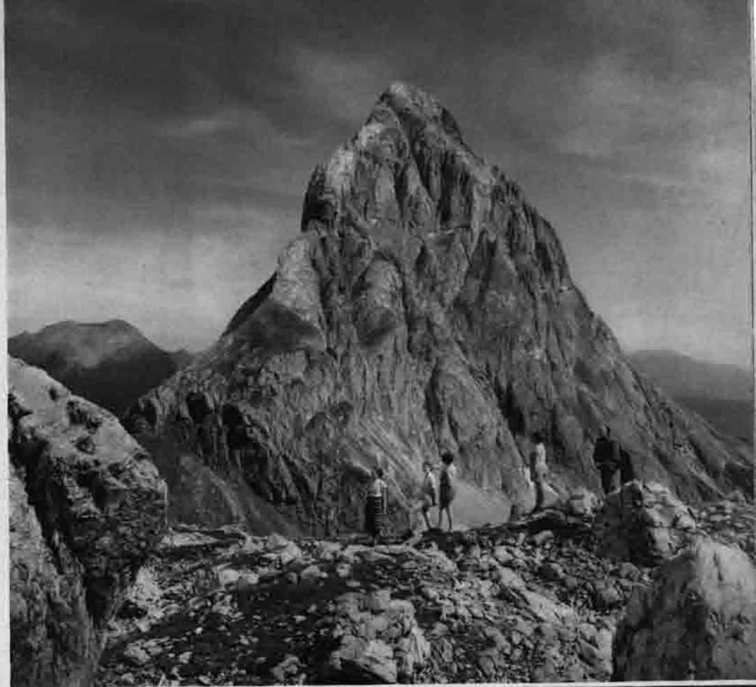
Sonnenspitze aus dem Schwarzerkar