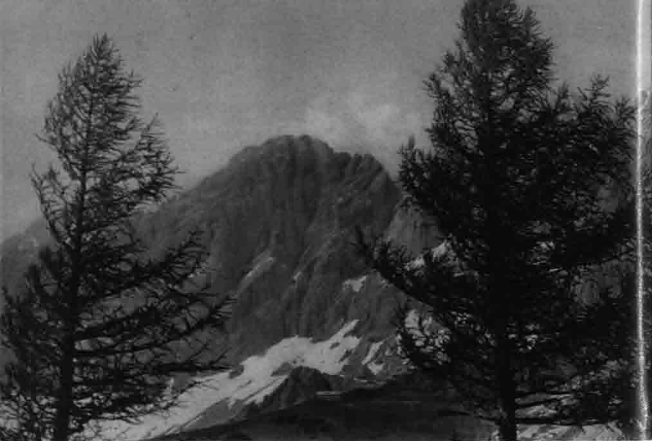
Dachstein Südwand