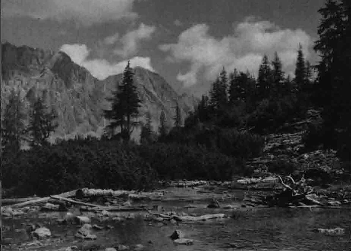
Seebenseeabfluß mit Wetterstein.