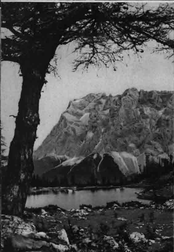
Seebensee und Wetterstein