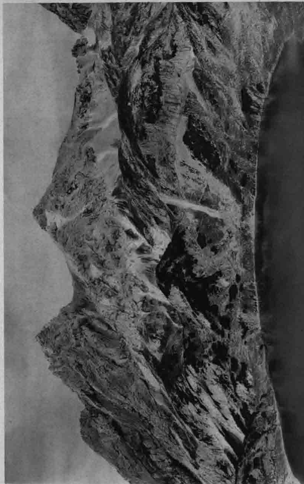
Drachensee mit Tajaköpfen