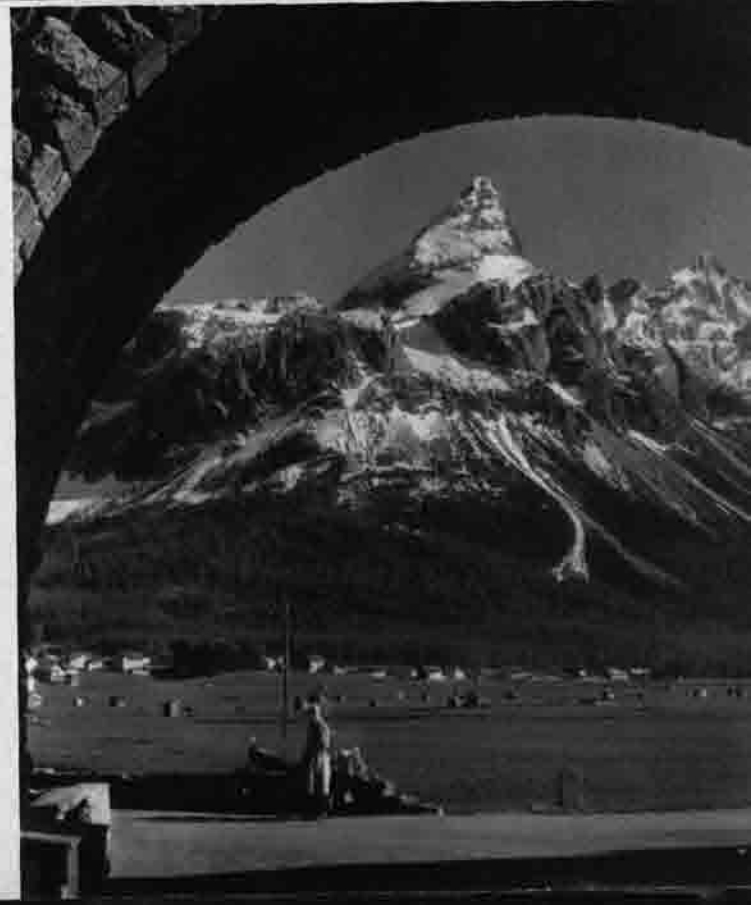
Sonnenspitze Aufnahme Fritz Schübler Coburg