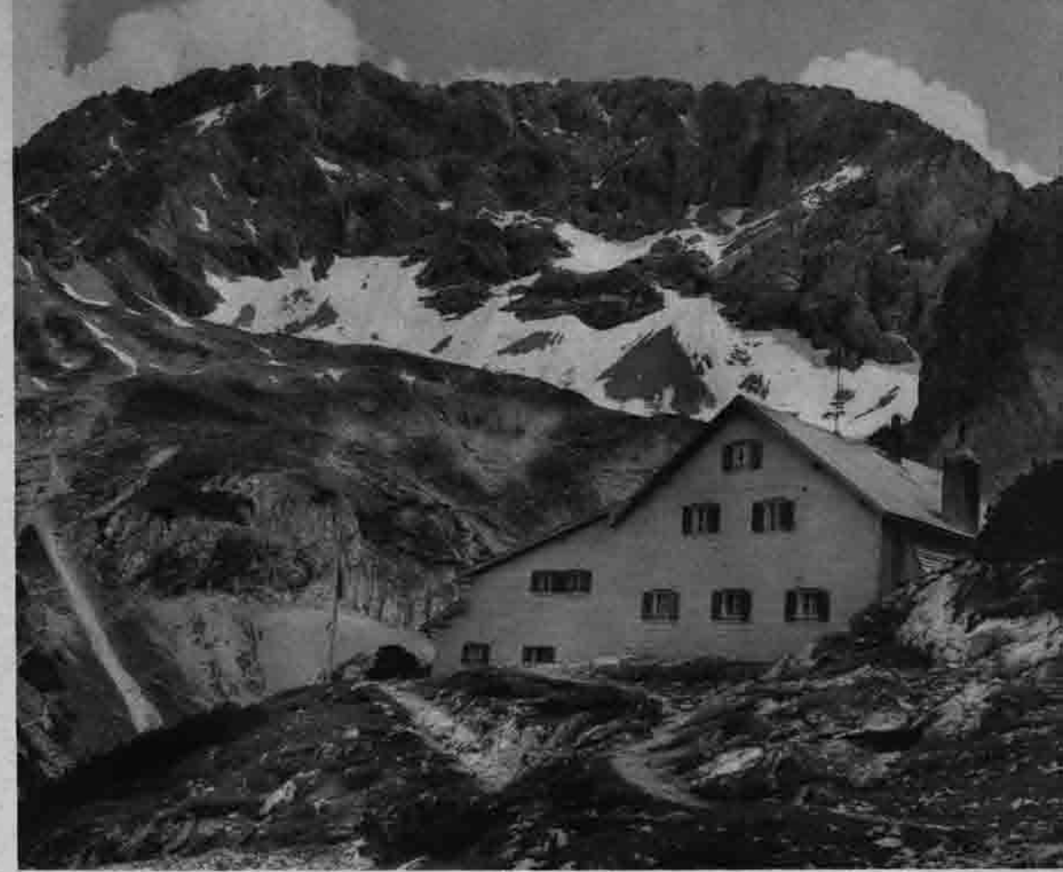
Coburger Hütte von Norden