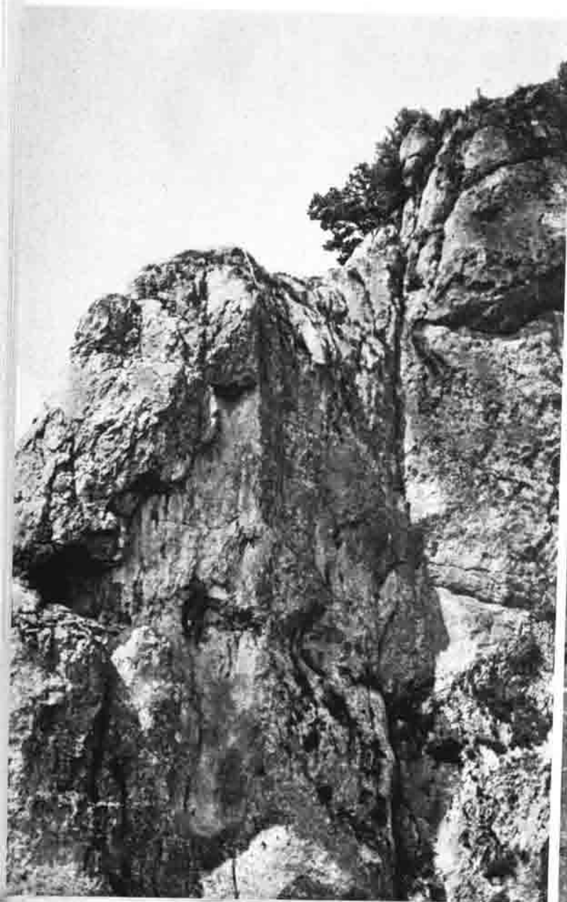
Burg von Wellheim