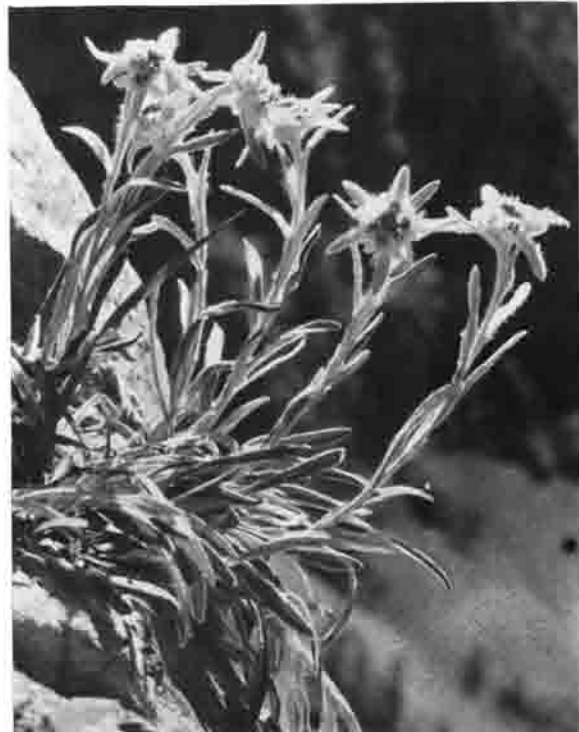
Nur wer die kleinen Wunder am Wege sieht, der weiß, wie schön die Bergwelt ist

doch unsere Alpen alles an Abwechslung! Immer wieder gibt es andere Eindrücke. Ganz anders ist der Charakter der Kalkberge wie der des Urgesteins. Ganz anders die Welt der reinen Felsberge als die Gletschergegend. Und das staunende Auge konnte sich nicht satttrinken an der Majestät der Formen, an der Urgewalt der Eisströme, an dem wogenden und doch erstarrten Meer der Gipfel. Und stieg man dann hinab ins Tal, da grüßten zuerst die zarten vielfarbenen Blumenpolster, da leuchtete ein himmelblauer See, da begrüßte einen das lustige Blöcken der Ziegen, das Muhen der Kühe; da rastete man gerne auf einer gastlichen Alm; da empfand man wohltuend den Schatten der ersten Bäume; da erfreute sich das Herz an den wundervollen Farben der Alpenblumen, da lauschte das Ohr dem geheimnisvollen Murmeln der sprühenden Bergwasser. So erlebte man den Berg. Und im Tale war es die Vielfalt der Häuser und Kirchen, die Trachten der Bewohner, das Leben der Bergbauern. Nur wer im Schritt des Bergwanderers dahinging, der konnte wirklich den Berg und seine Welt erleben. Das ist mit der Grund, warum es den schon ergrauten Bergfreund immer wieder mit Allgewalt zu einem inneren Erleben des Berges in die Alpen treibt. Und ich glaube, gerade dadurch haben die Begründer unserer Sektion ihren Nachfahren ein wertvolles Erbe hinterlassen.