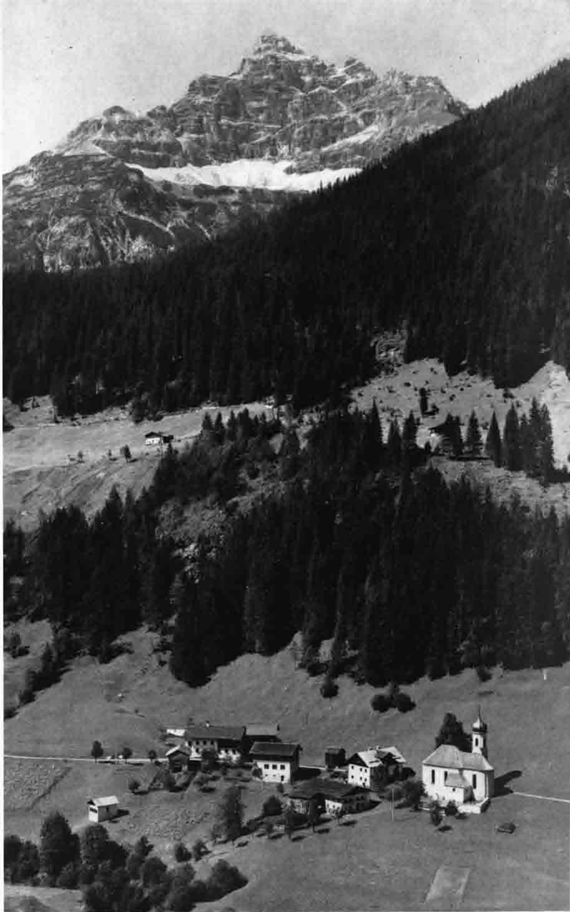
Hinterhornbäch mit Hochvogel