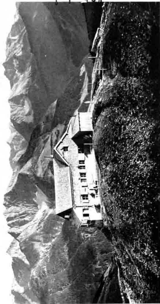
Hermann-von-Barth-Hütte (Düsseldorfer Hütte, Rückansicht) mit Blick auf die Lechtaler Alpen