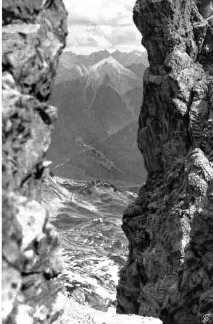
Durchblick von der Ilfenspitze ins Wolfebener-Kar mit der Hermann-von-Barth-Hütte

An Rasttagen kann man von der Talstation Elbigentalp aus schöne Talwanderungen über die Lechwiesen und durch schöne Wälder unternehmen, zu erwähnen wären die Tageswanderungen nach dem Bergdörfchen Gramais oder Madau im Madautal, oder nach Kaisers