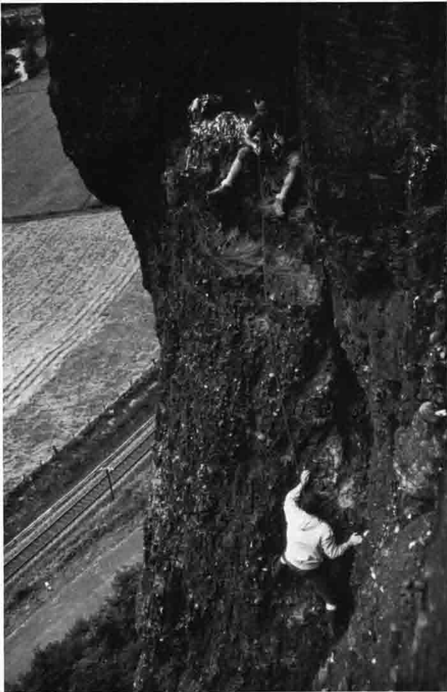
In der „Kölschen Kneipe“ am Exelsior (Eifel)