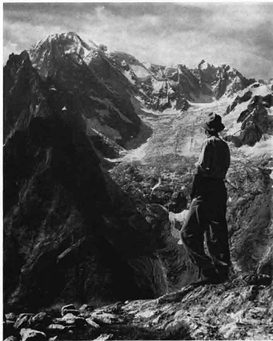
Brenva-Flanke des Mont Blanc

Die beiden Bergsteigerorte Chamonix und Courmayeur, im Norden und im Süden zu Füßen des Weißen Berges gelegen, sind von ebenso gegensätzlicher Art wie seine Flanken hüben und drüben. Hier der mondäne französische Fremdenort mit riesigen Hotelkästen, dort das schlichte italienische Alpendorf mit seinen ineinandergeschachtelten Häusern. Der üppige südliche Blumenschmuck in den Gärten, auf den Balkonen und an den Fenstern auch der ärmlichen Häuser legt ein beredtes Zeugnis ab von Farbensinn und Naturfreudigkeit der Bergbewohner. Dem von Italien