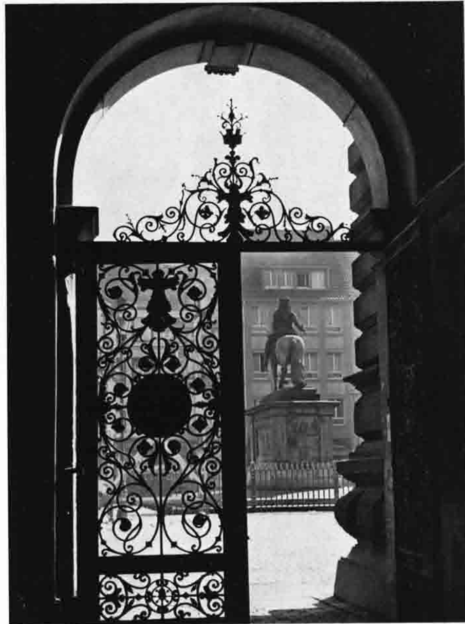
Blick vom alten Rathaus auf Jan Wellem