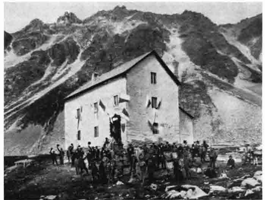
Alte Düsseldorfer Hütte im Zaytal