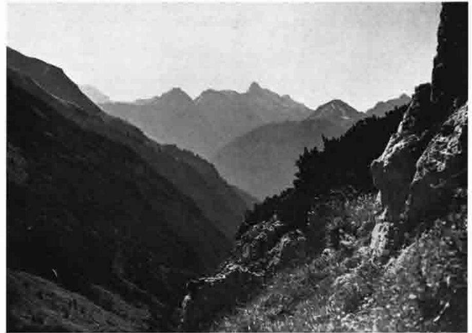
Blick auf Lechtaler Wetterspitze

Nach dem Kriege wurde auf Anordnung der Alliierten das gesamte deutsche Eigentum im Ausland beschlagnahmt. Dieses Schicksal traf auch die deutschen Hütten in