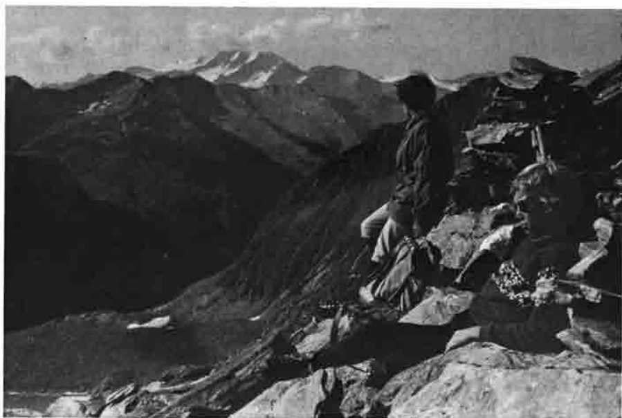
Rast in der Klammerscharte

Da ist es gut, durch das Bergsteigen mit seinen unvermeidbaren Gefährdungen zu erfahren, daß der Mensch die Höhen und Tiefen durchleben muß, um an sich zu wachsen, um seine Grenzen zu spüren und ebenso zu spüren, daß er Teil einer Gemeinschaft ist. Die Überwindung der Gefahr durch eigene Kraft schafft Selbstvertrauen, zugleich aber auch Ehrfurcht vor dem Leben und der Natur.