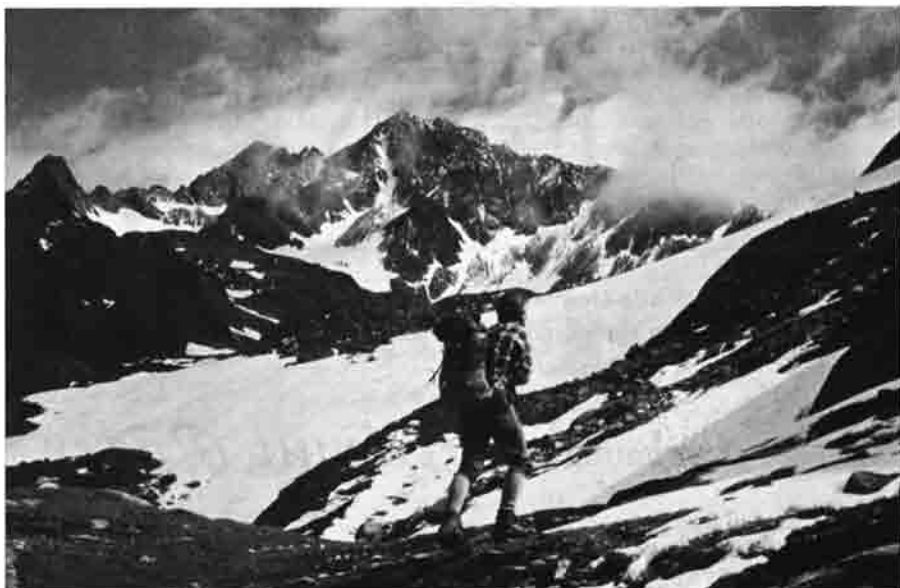
Auf dem Elberfelder Weg – von der Lienzer Hütte hinauf zum Gößnitz-Törl.