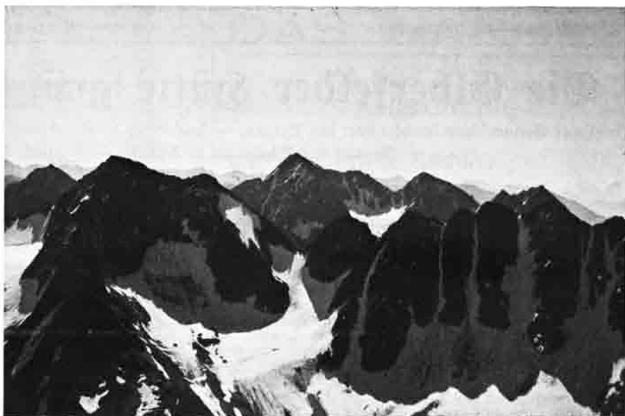
Schobergruppe – Blick vom Roten Knopf nach Südosten; Hornkopf, Klammerscharte, Klammerköpfe.