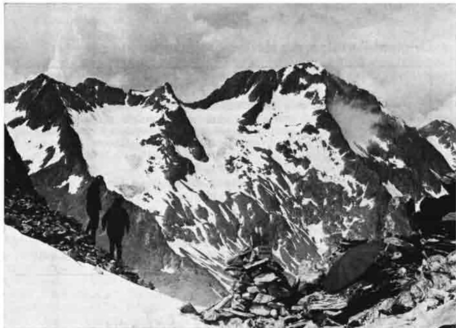
Auf dem Wiener Höhenweg – in der Klammerscharte. Blick auf Talleitenspitze und Roten Knopf.