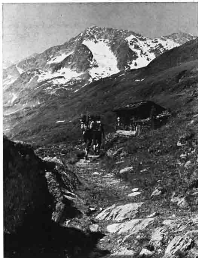
Aufstieg durchs Gößnitztal – die letzte Almhütte. Darüber der Rote Knopf 3281 m