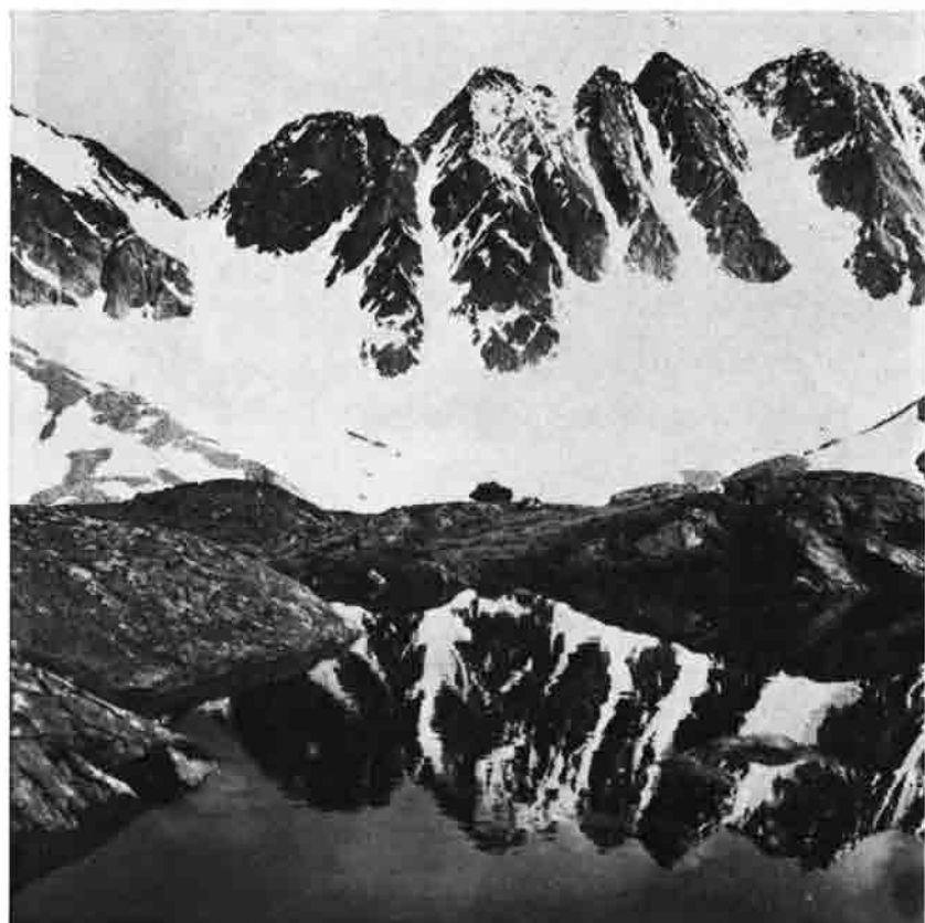
Dreitausender spiegeln sich im Gletscherwasser: die Klammerköpfe