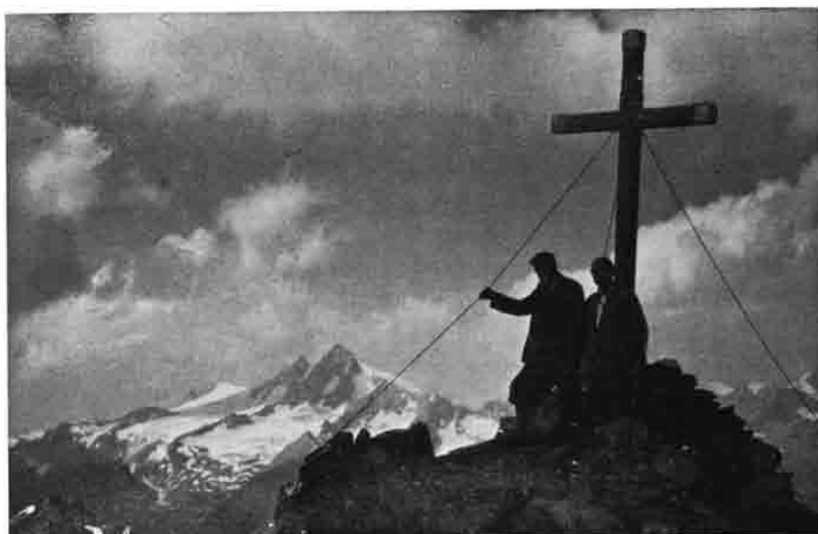
Roter Knopf – Gipfelkreuz 3281 m – mit Blick auf die Glockner-Westwände