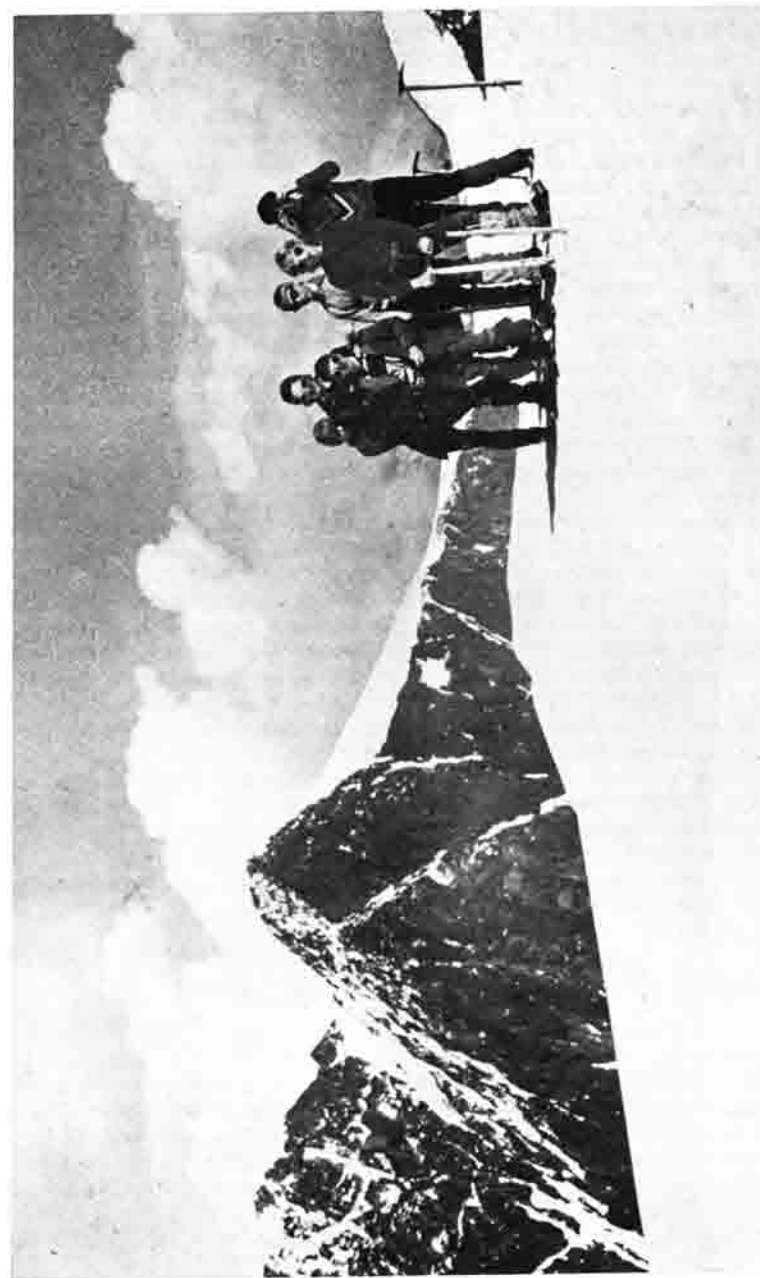
Sonnkarspitze Stubai mit dem Zuckerhütli im Hintergrund