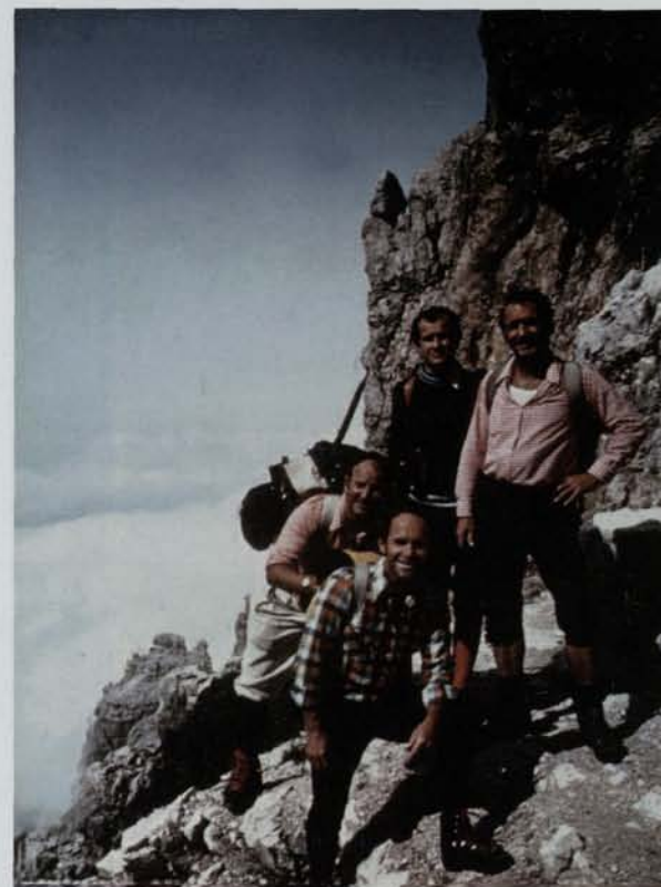
Unterwegs auf dem Bocchette Weg in der Brenta in den Dolomiten: