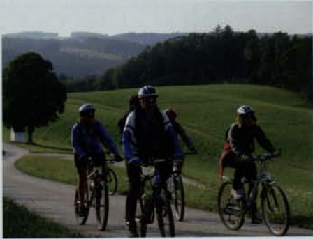
bei Familientouren dabei sein: