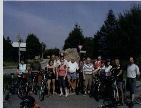
bei einer Umweltbaustelle mithelfen: