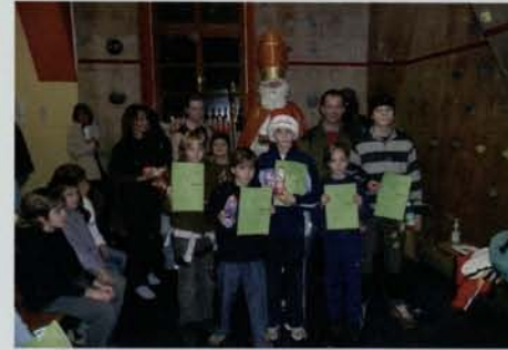
bei Radtouren mitmachen: