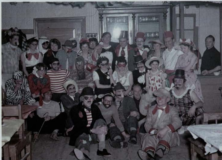
14. Januar: Maskierte Faschingsveranstaltung mit Rehessen beim Stauernwirt