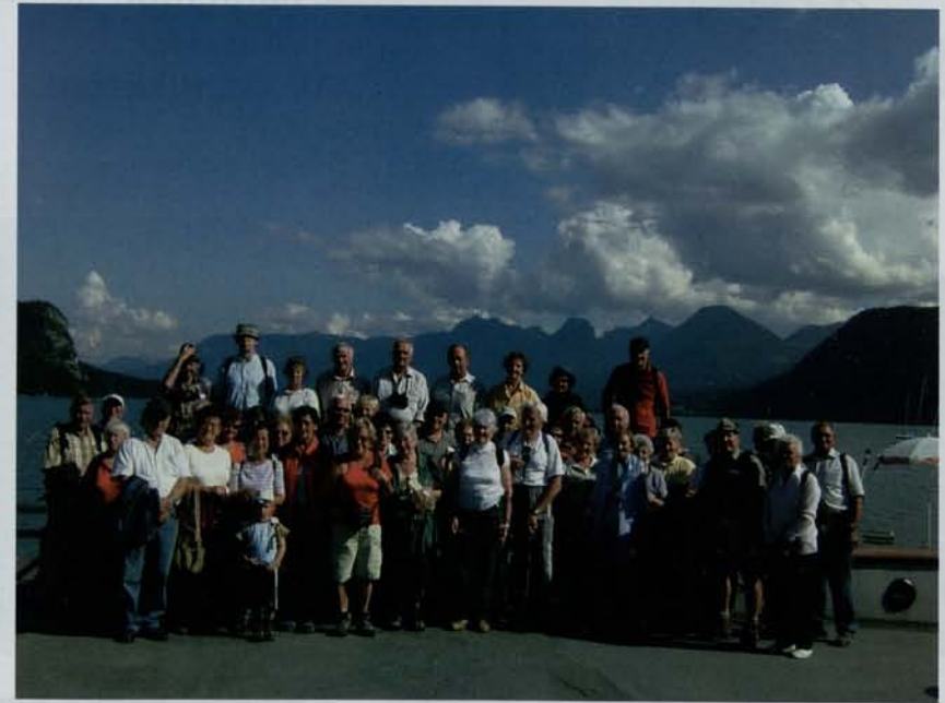
Die DAV-Senioren genießen das herrliche Wetter bei ihrem Ausflug an den Wolfgangsee.