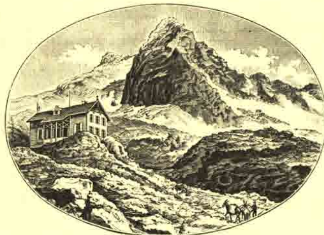
Geraer Hütte an der Alpeiner Scharte (2350 m).