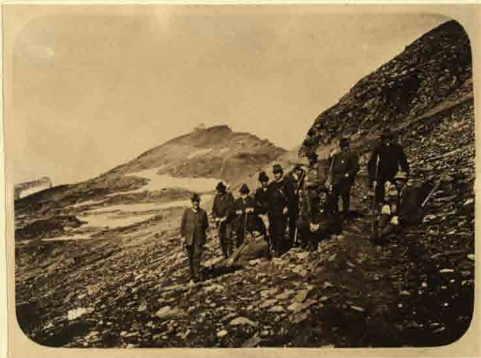
Blick vom Goslarer Weg auf das Hannoverhaus.