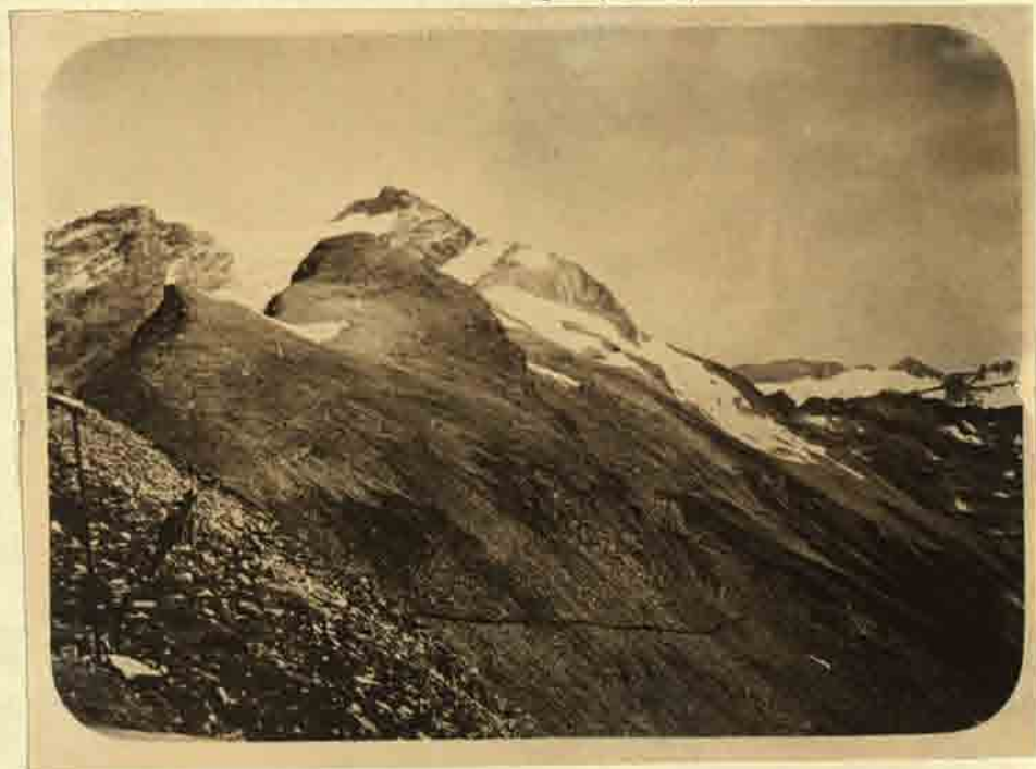
Blick vom Goslarer Weg auf den Ankogel und nach der Gr. Elendscharte.