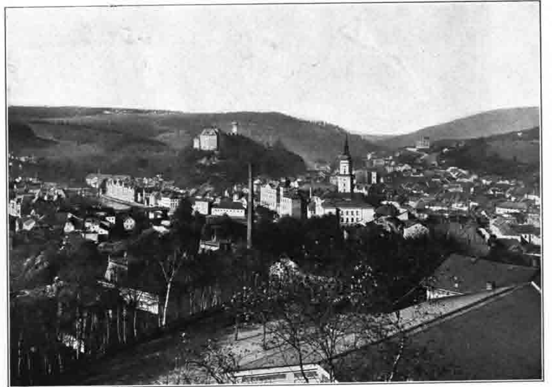
Ansicht von Greiz i. V.

Fürstl. Hofbuchdruckerei Löffler & Co., Greiz i. V.