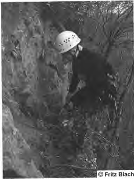
Arbeiten am Seil

Über den Erfolg der bisherigen Arbeitseinsätze aus den vergangenen zwei Jahren könnt Ihr euch auf unserer Homepage unter „Aus den Bereichen“ informieren.