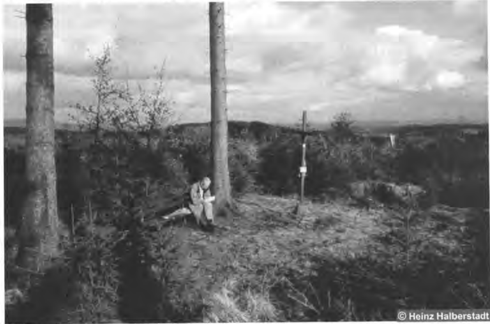
Prächtige Sicht ins Sauerland - der Homertgipfel nach Kyrill

späteren Helfer, die ein neues Kreuz bauten, es fest einmauerten und anstrichen, dem unbekanntem Spender der Bank und allen Führern und Verführern zu unserm Kreuz, von dem man durch den wütenden Sturm Kyrill über die lärmende Autobahn hinweg eine neue, prächtige Sicht ins Sauerland hat.