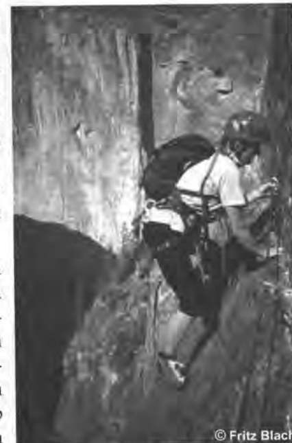
Traverse am Lower Cathedral Rock

Die anschließende Autofahrt durch das nördliche Utah mit Ziel Yosemite Valley lässt immer wieder meine Traumbilder aufblitzen. In Gegenden, wo man es nicht vermutet, tauchen immer wider bizarre Felsmassive aus dem Boden. Wir schaffen es kaum, weiter zu fahren. Zu groß ist die Verlockung, den Türmen einen Besuch abzustatten. In uns bleibt der Wunsch, hierher irgendwann einmal zurück zu kehren. Nevada ist groß sehr und sehr warm, und wir mussten mit unserem Auto einmal quer durch. Da verwundert es nicht, wenn ich als Fahrer auf der langen, eintönigen Fahrt ein wenig schläfrig werde. Daher kommt die Frage von Martin, was denn ein Dip sei (es stand ein Schild am Straßenrand mit der Aufschrift „Dip“) durch einen dicken Wattebausch bei mir verzögert an und bevor ich noch über die