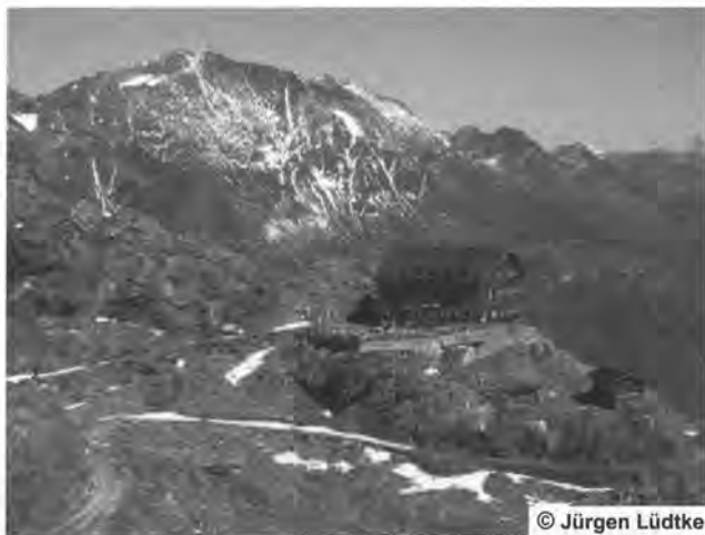
Die Stettiner Hütte

Während unserer Mittagspause kommt ein Mountainbiker hochgefahren, den wir bis zur Eisjöchlscharte beobachten. Als wir selbst dort sind, ist auch die Stettiner Hütte auf 2.870 m fast erreicht. Nach unserem Erfrischungsrund geht's ohne Gepäck auf die Hohe Wilde. Locker und leicht kommt unsere Gruppe hier über 3.000 m Höhe. Aber danach ist der Weg mit kleinen Schneefeldern bedeckt, so dass wir nicht weiter gehen.