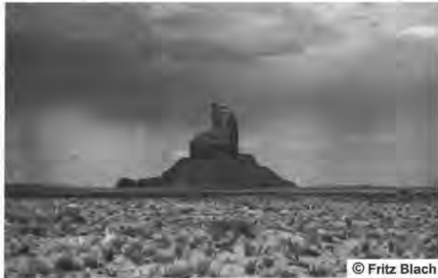
Auf der Fahrt durchs Monument Valley