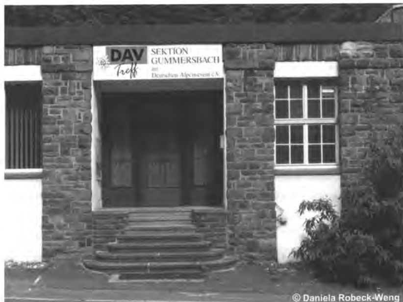
Der Eingang zum DAV-Treff