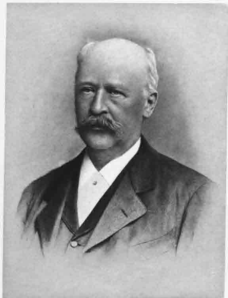
Heliogravüre v. J. B. Obernetter, München.