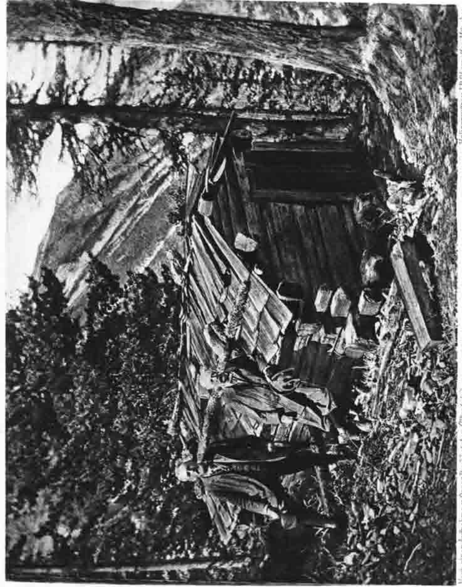
Mont. stror: Aufnahme v. Ober-Buchheister (Chontsin)

Die Sectionsversammlung vom 14. October genehmigte nach eingehender Behandlung zwei wichtige Anträge des Vorstandes, nämlich 1) Erbauung einer neuen Unterkunftshütte am Berg I oberhalb Trafoi, und 2) Vergrößerung der Schaubachhütte. Zur finanziellen Durchführung dieser beiden Unternehmungen wurde die Ausgabe von 120 Antheilscheinen à 100 M. beschlossen.