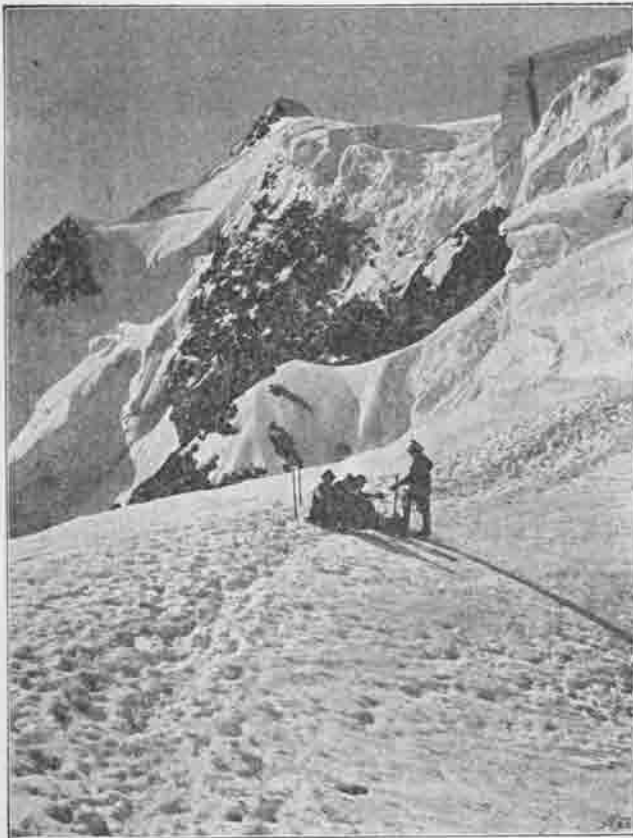
Der Ortler in Sicht!

Die Sections-Versammlung am 3. März nahm den Antrag 1890 des Vorstandes auf dessen Vermehrung um zwei Mitglieder an. Zu dieser Veränderung des Personalbestandes trat ferner im Mai noch ein Wechsel im Amte des zweiten Vorsitzenden ein, indem H. Seippel auf seinen Wunsch aus diesem entlassen