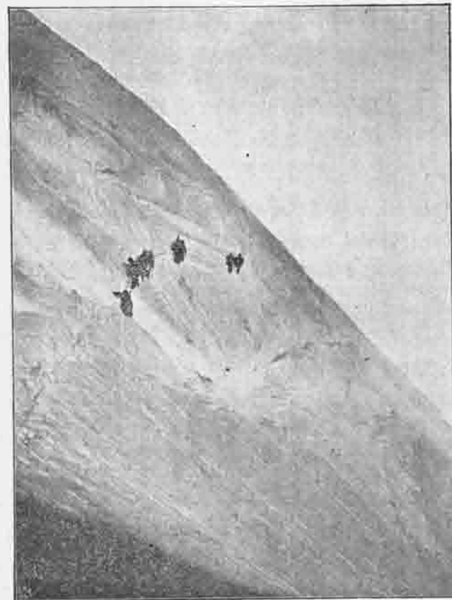
Eiswand am Ortler.