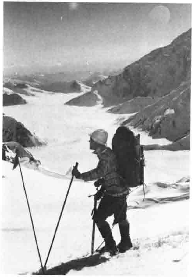
o.l. Hauptlager am Kahiltna- gletscher (2100 m), Flugzeug- basis