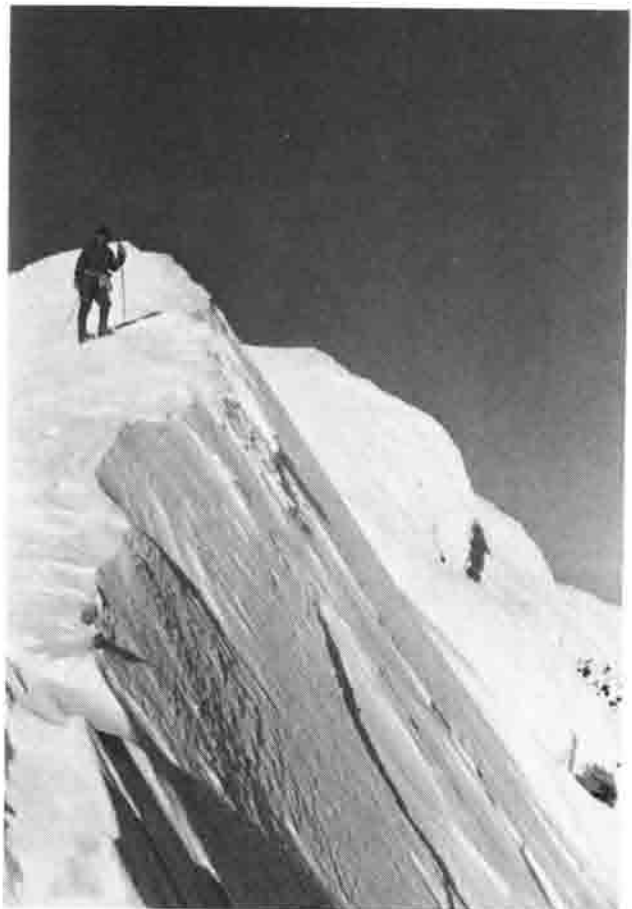
u.r. Der höchste Punkt Nordamerikas (6200m)