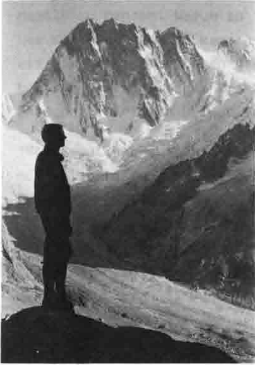
Im Reich der Viertausender (Mt. Blanc-Gebiet)