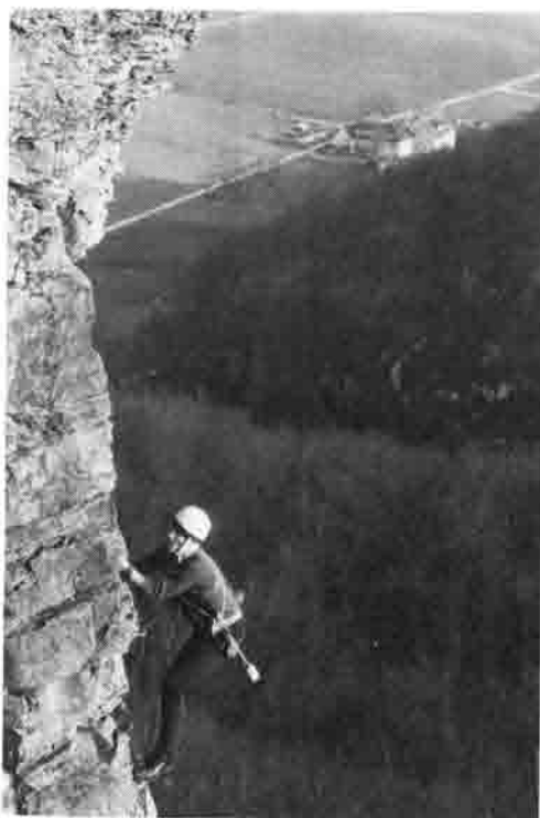
Im schweren Steilfels (Hohenstein, Fledermauskante VI ) Blick auf die Pappmühle