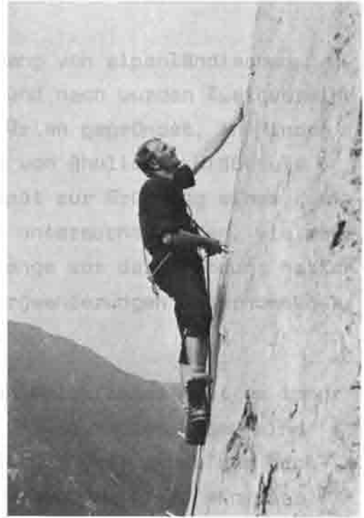
Im silbernen Kaiserkalk