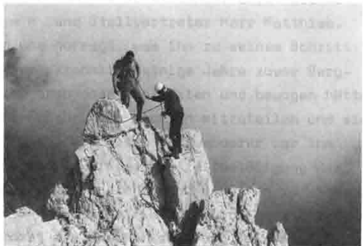
Gipfel über den Wolken (Christaturm im Wilden Kaiser)