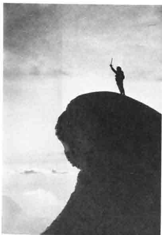
Durch Urwälder zu den Eisregionen