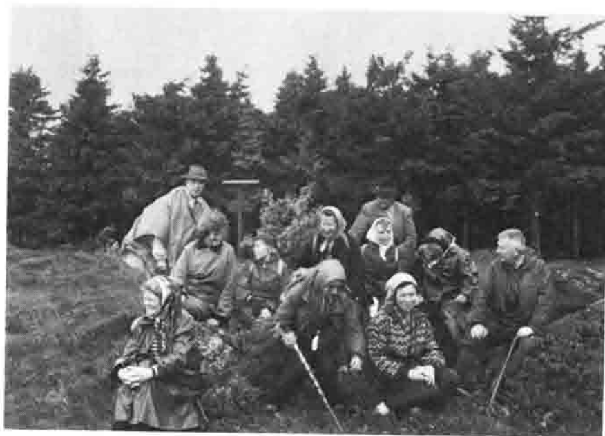
In der Rhön