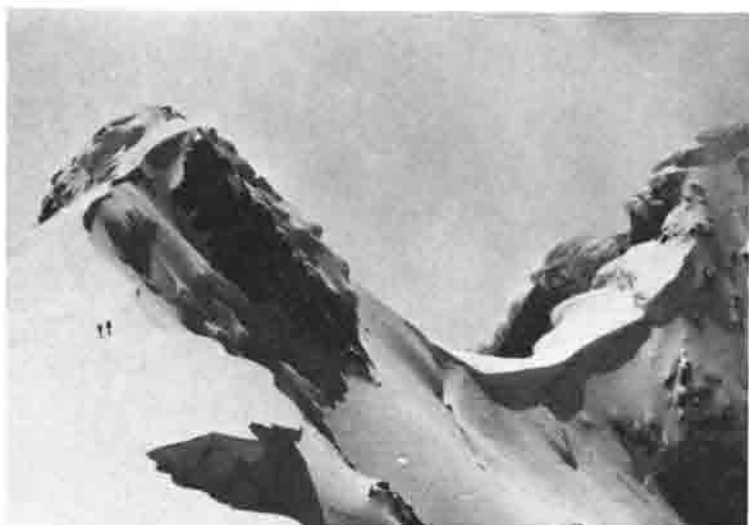
Die Gipfelwächte des Kilimantscharo, 6100 m