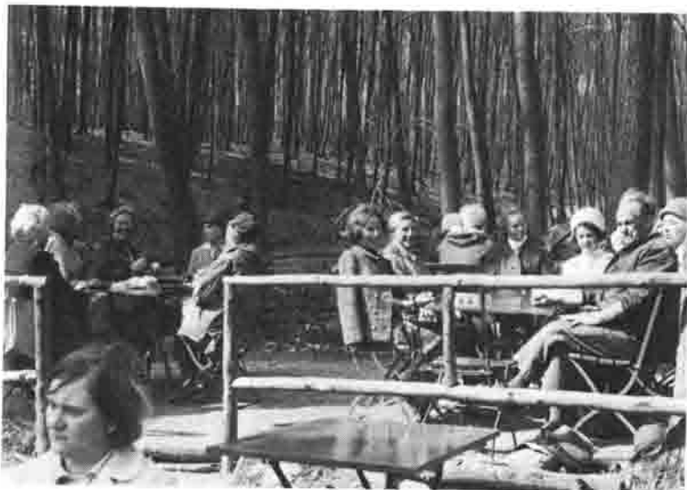
Rast vor der Baxmannbaude im Blutbachtal ( Hohenstein )

W a n d e r n , o h W a n d e r n . . . . .