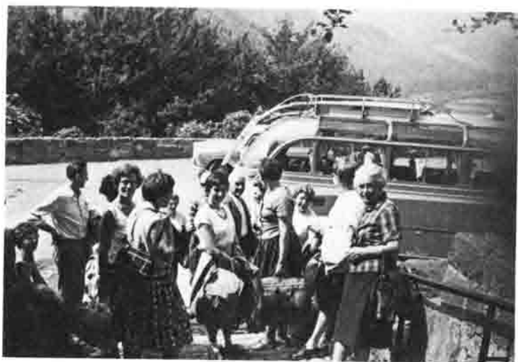
Fahrt zum Ludwigstein