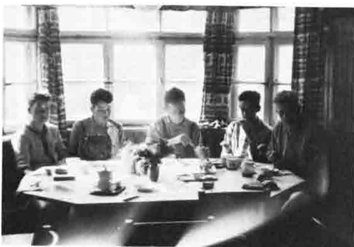
In froher Runde am Hüttentisch