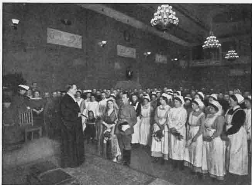
Eine Kriegstrauung im Casarett der „Sektion Mark Brandenburg“