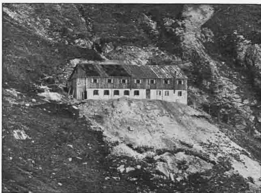
Die Sammoarhütte am Niederjoch, 2525 m hoch