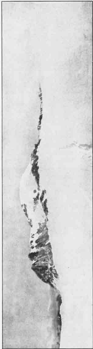
Das Brandenburger haus und die felsenwände (Dabmannspitze). Blick vom Spatzschferner von Süd nach Nord