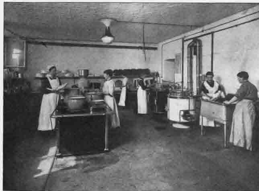
Die von der „Sektion Mark Brandenburg“ eingerichtete Lazarettküche