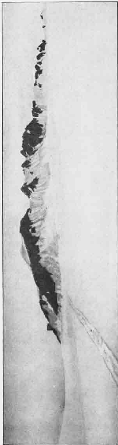
Das Brandenburger haus und die felsenwände mit Dabmannspitze und Ehrhöpflspitze. Blick von Ost (Brandenburger_joch) nach West