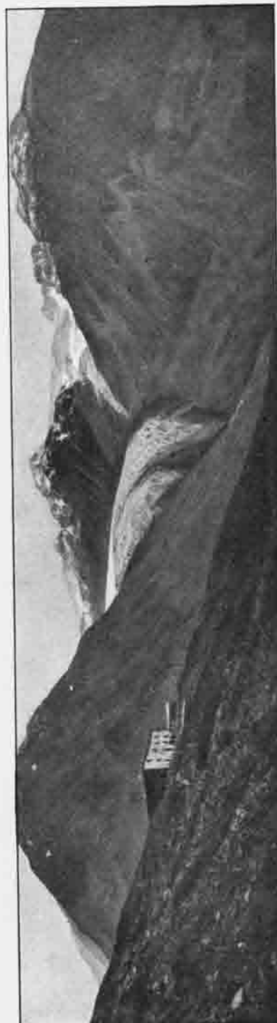
Das Hochhochspiz (2448 m) mit dem „Oberem Berg“. Hintereiserner Muthspitze mit Felswandfenster

„Wir stehen hier,“ so begann der Geistliche, „auf einer Insel, auf einem Riffe, das nicht bewegte Gluten umbranden, das jedoch Eis-meere schweigend umgeben. Eine Insel des Todes war es bisher. Kein Kräutlein fand eine Ritze zum Fußfassen im Felsengewirre, und der Adler zog seinen Hochweg über den Gletschern und würdigte sie keines Blickes. Nur ein Schmetterling, vom Sturme verschlagen, konnte sich hierher verirren, fand aber keine Blüte, darauf sich auszuruhen, und mußte elend zugrunde gehen. Auch eine Insel des Schweigens war es; nur leise rieselten die Schmelzwasser am sonnenwarmen