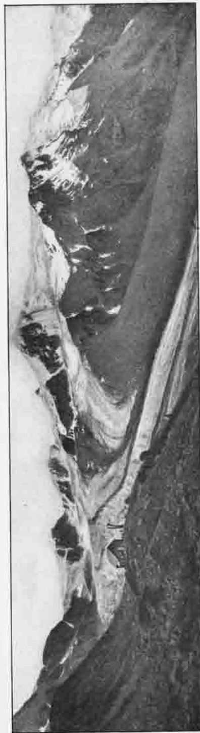
Die Weißkugelhütte (2509 m) mit dem Langtaufener Gletscher, Dornagelwände, Langtaufenerjoch, Langtauferspiz, Weißkugel und Bärenbarthogel