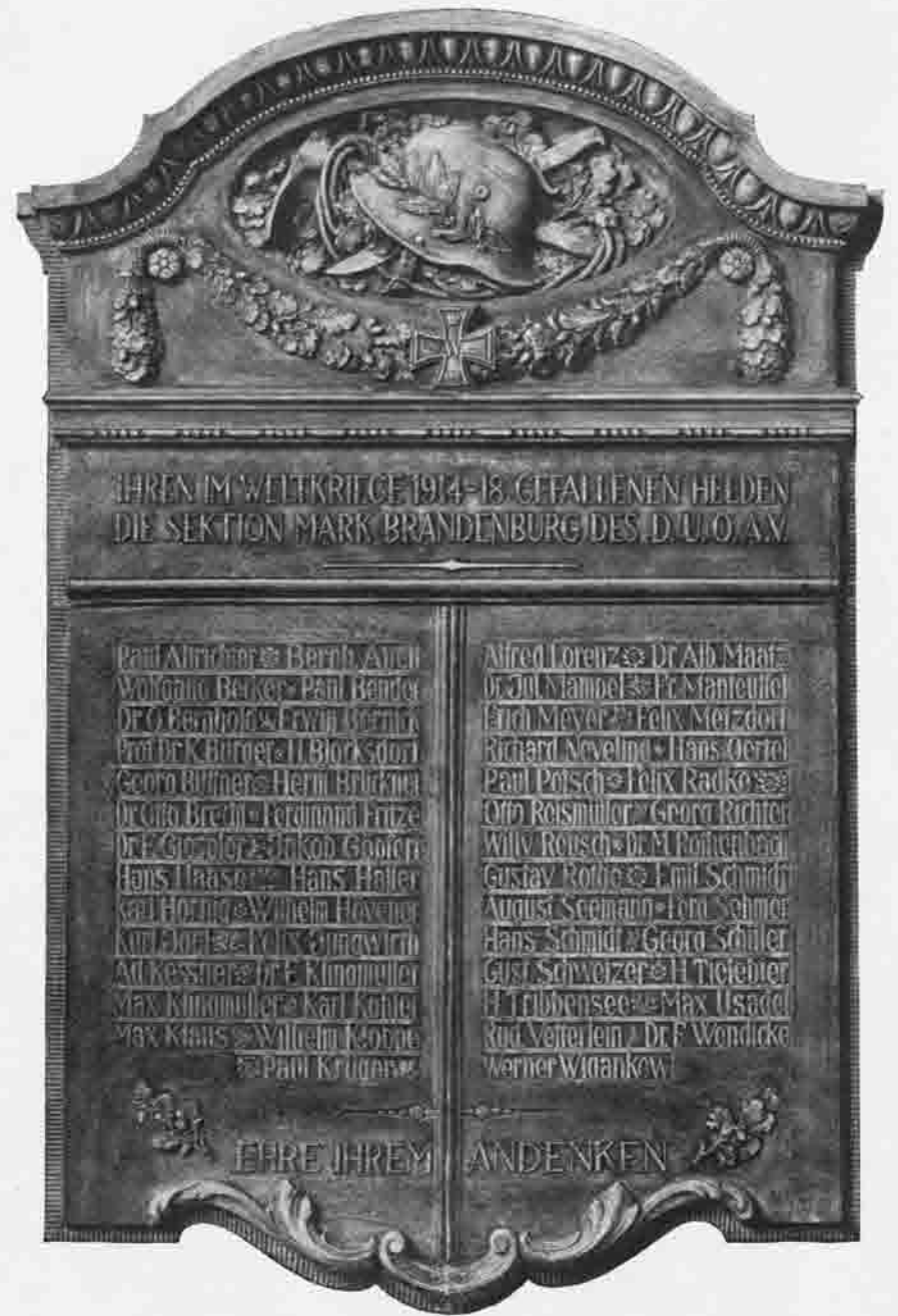
Erstafel am „Brandenburger Hause“