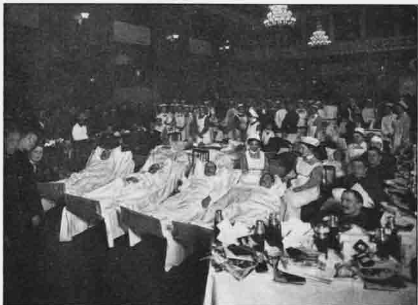
Kriegsweihnachtsfeier im Casarett der „Sektion Mark Brandenburg“