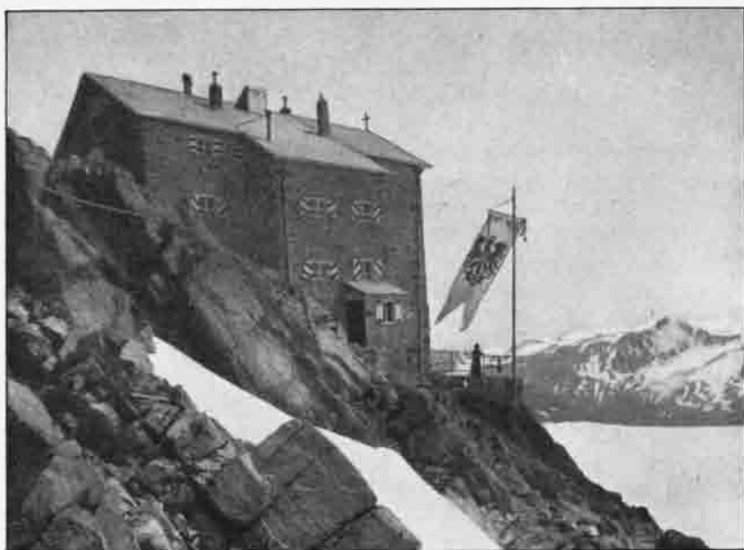
Das „Brandenburger Haus“ 3277 m hoch