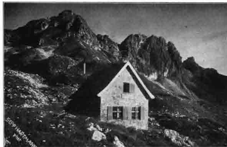
Mindelheimer Hütte mit Blick gegen Westen (Teilblick mit Mindelheimer Kopf und Sechszinkenspitze)