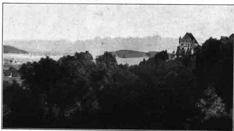
Schloß Mindelburg bei Mindelheim, die Geburts- und Sterbestätte des großen Landsknechtführers Georg I. von Frundsberg (Blick gegen die Alpenkette)

Diese Denkschrift wurde im Auftrag des Sektionsausschusses bearbeitet von