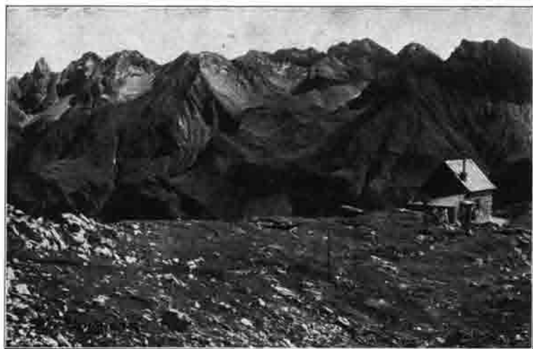
Mindelheimer Hütte mit Blick gegen Osten (Teilblick von der Trettach bis zum Hohen Licht)

und Butter von der 15 Minuten entfernten Almhütte). Die Hütte liegt in folgendem Schnittpunkte: Rappental (Einödsbach) — Mindelheimer Hütte — Bregenzer Wald und Kleines Walsertal (Mittelberg) — Mindelheimer Hütte — Lechtal. Es sind hier also bedeutende Uebergänge gegeben. Von der Hütte aus bietet sich dem Auge die ganze Mädelegabelgruppe, ein Rundblick von der Höfats bis zur Valuga von berückender Schönheit. Der volle Zauber dieses überwältigenden Anblicks offenbart sich dem Beschauer ganz besonders bei Sonnenuntergang: Wir stehen mit der Hütte in \frac{5}{10} -Gipfelhöhe. Der sinkende Feuerball hinter uns schleudert noch seine spitzen Pfeile in das breit und weit vor uns ruhende Land. Er prägt seine scharfen Konturen und der schroffe Wechsel von Licht und Schatten läßt das ungeheure Gebiet als das großartigste Relief gleich einem Märchenreich erscheinen.