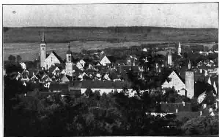
Mindelheim, die Stadt Frundsbergs (Blick vom Katharinenberg auf die Altstadt)