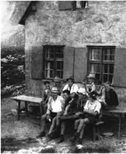
Berufsschüler beim Nothüttenbau

tige Baubeginn ist beschlossene Sache. In der zum Wasserbaubetrieb Abt gehörenden Schlosserwerkstätte wird die Dachstuhlkonstruktion durchgeführt. Sie soll in die Baugrube gestellt, mit Holz verschalt und mit Blech gedeckt werden. Die gesamte Konstruktion kann im folgenden Jahr gehoben und mit einem Stockwerk untermauert werden. Das „kann“ aber wird lange nicht Wirklichkeit. Erste Schwierigkeit macht der Transport des wieder in die einzelnen Konstruktionsteile zerlegten Dachstuhles. Träger aus dem Lechtal übernehmen diese schwere Arbeit: sperrige Teile (Dachsparren mit 7 m Länge und 90 kg Gewicht — 52 Stück) und schwere Flacheisen muß der Träger mit größter Anstrengung in täglich zweimaligem Gang hochschleppen. Bretter und Bohlen werden in freiwilligem Arbeitseinsatz von der Schwarzen Hütte hochgetragen. Fenster und Türen fertigte Schreinermeister Albert Stölzle. Der Trans-