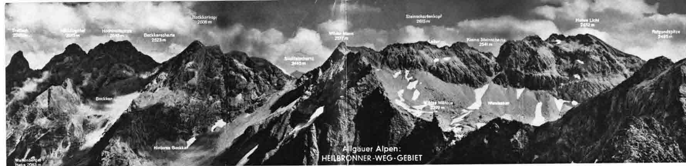
△ Heilbronner Weg von der Trettach bis zum Hohen Licht