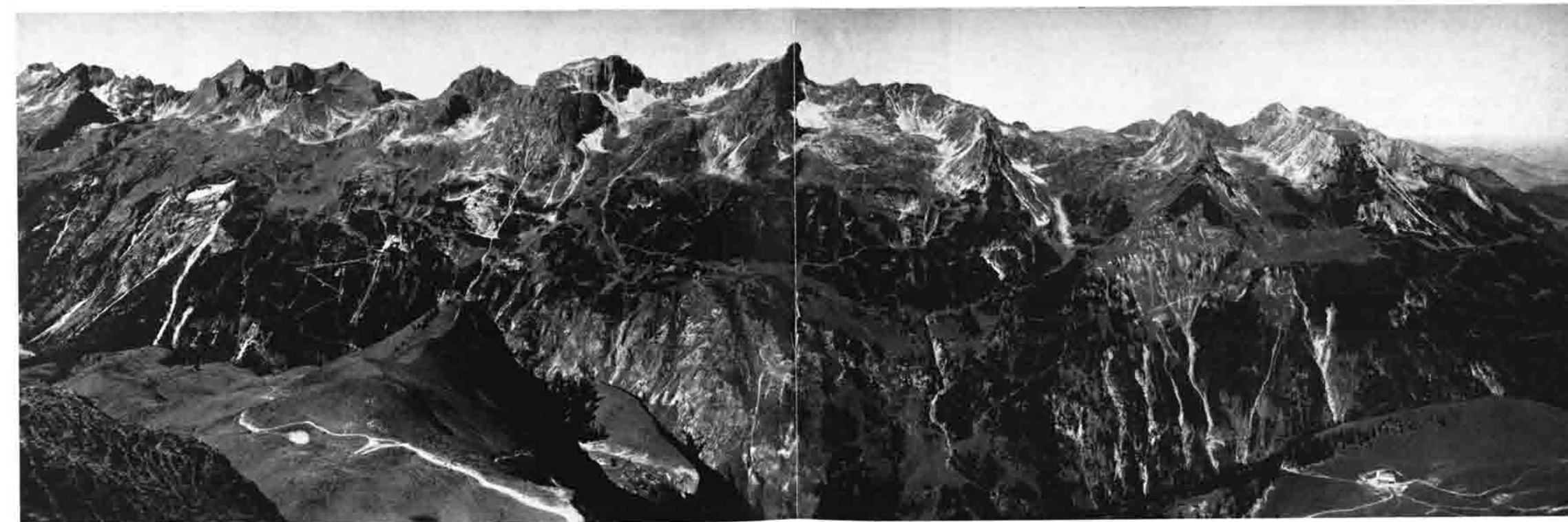
▽ Schafalpengruppe vom Widderstein bis zum Griesgundkopf; geplanter neuer Höhenweg