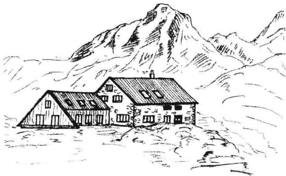
Neues Gesicht der Mindelheimer Hütte 1971