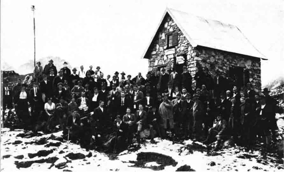
Einweihung der 1. Mindelheimer Hütte am 29. August 1920

delheim treu und heute noch verbindet uns eine aufrichtige Kameradschaft mit der Sektion Krumbach.