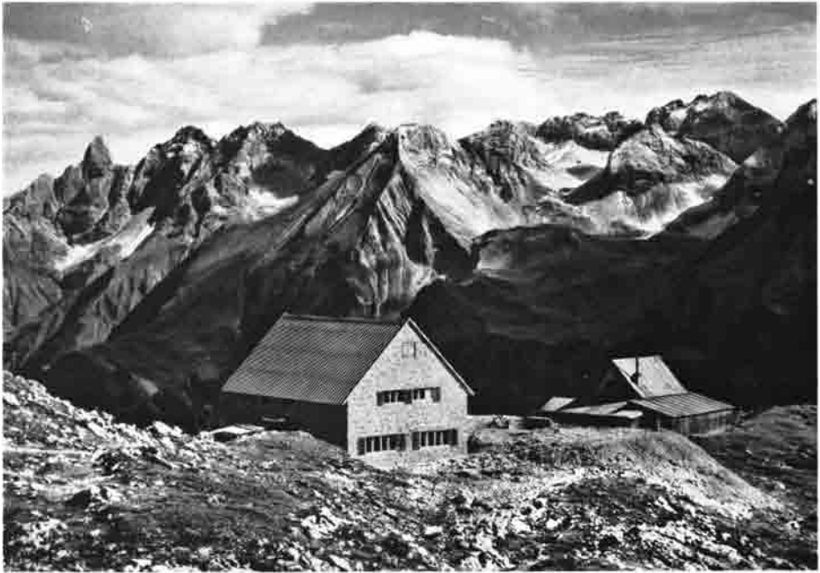
Mindelheimer Hütte mit Blick zum Heilbronner Weg

vorausgehenden Darstellungen dieses dornen- und sorgenvollen, dieses mühsamen und erfolgekrönten Weges wiederholen und so verzichte ich auf den Abdruck des Wortlautes.