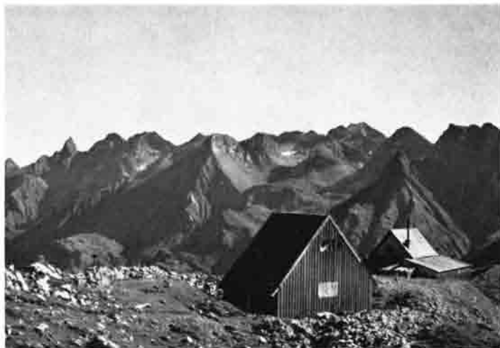
Die Nothütte – erbaut während des 2. Weltkrieges, zur Lagerung des Baumaterials

teile darin verstaubt – und dann kommt sechs Monate lang der Winter. Der größte Teil der Lasten ist auf dem Hüttenplatz gesichert – mit Fragezeichen. Im nächsten Jahr hofft Vorstand und Sektion endlich auf den eigentlichen Baubeginn. Die Kosten waren mittlerweile auf über 30 000 Mark angestiegen und eine ganze Reihe von Rechnungen standen noch aus. Einrichtungsgegenstände wurden gekauft, Matratzen beim 2. Vorstand Singer gelagert.