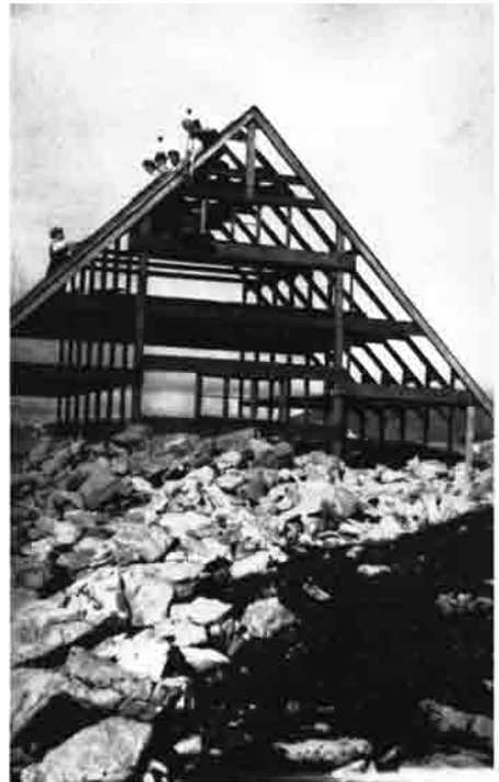
Nothüttenbau — Eiserner Dachstuhl

port verbraucht den Sommer 1936. Fenster, Türen und etwa 5 cbm Bretter bleiben im sog. Krankenstall der Rappentalpe. 1937 soll mit dem Aufbau begonnen werden. Das Aussprengen der Baugrube erfordert viel Zeit und Geld und zieht sich bis in den Sommer 1938. Noch mehr Zeitverlust verursacht das Kalkbrennen 1938 auf dem Hüttenplatz. 300 cbm Latschenholz müssen geschlagen und 300 m hochgezogen werden. Dazu wird ein eigener Aufzug gebaut. Der erste Dieselmotor ist zu schwach — ein zweiter mit ca. 250 kw wird von der Schwarzen Hütte hochgeschleppt mit unendlicher Mühe. Eine Bauhütte wird erstellt und Geräte, Holz und Eisenkonstruktions-