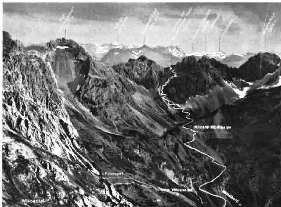
Weg Mittelberg – Wildental — Mindelheimer Hütte

(für den Viehtrieb) vom Hauptverein erhalten. Um diese Mittel zu strecken, zog der Vorstand mit Frau, Bruder und dessen Tochter und einer Reihe freiwilliger Helfer ins Höfle bei der Schwarzen (Forst-) Hütte, um in 4-wöchiger Arbeit diesen Weg endlich in Angriff zu nehmen. Noch ein paar solcher Arbeitsurlaube mußten durchgestanden werden und dann konnte Sektionsvorstand Abt verkünden: die vertragliche Verpflichtung zum Ausbau des Alpaufzuges ist erfüllt – der alte Weg mit seinen sogenannten Schindern war gut gangbar geworden und nun auch für Tragtiere genügend ausgebaut. Bald konnte Kracksen und Rucksack des Hüttenwartes entthront werden und eine bessere Bewirtschaftung durch Versorgung mit Tragtieren war nun möglich.