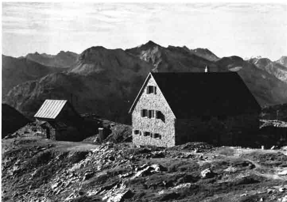
Mindelheimer Hütte mit Blick zu den Lechtalern