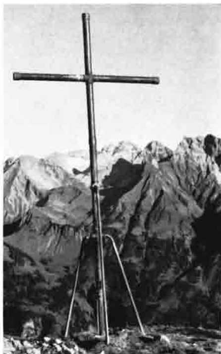
Hüttenkreuz, errichtet 1914

Vier junge Mitglieder brachten von einer Wanderung im Gebiet der Rappenseehütte eine fotografische Aufnahme des südlichen Teiles der Schafalpkopfgruppe mit, die Vorstand Abt, Max Abt und Albert Schuler anregten, in diesem nach Südosten offenen großen Kessel nach einem geeigneten Hüttenplatz zu suchen. Als der schönste Punkt und geeignetste Platz für den Hüttenbau erwies sich der heutige Platz der Mindelheimer Hütte. Um darauf eine Sektionshütte für die Dauer zu erbauen, wurde sofort ein Platzkauf