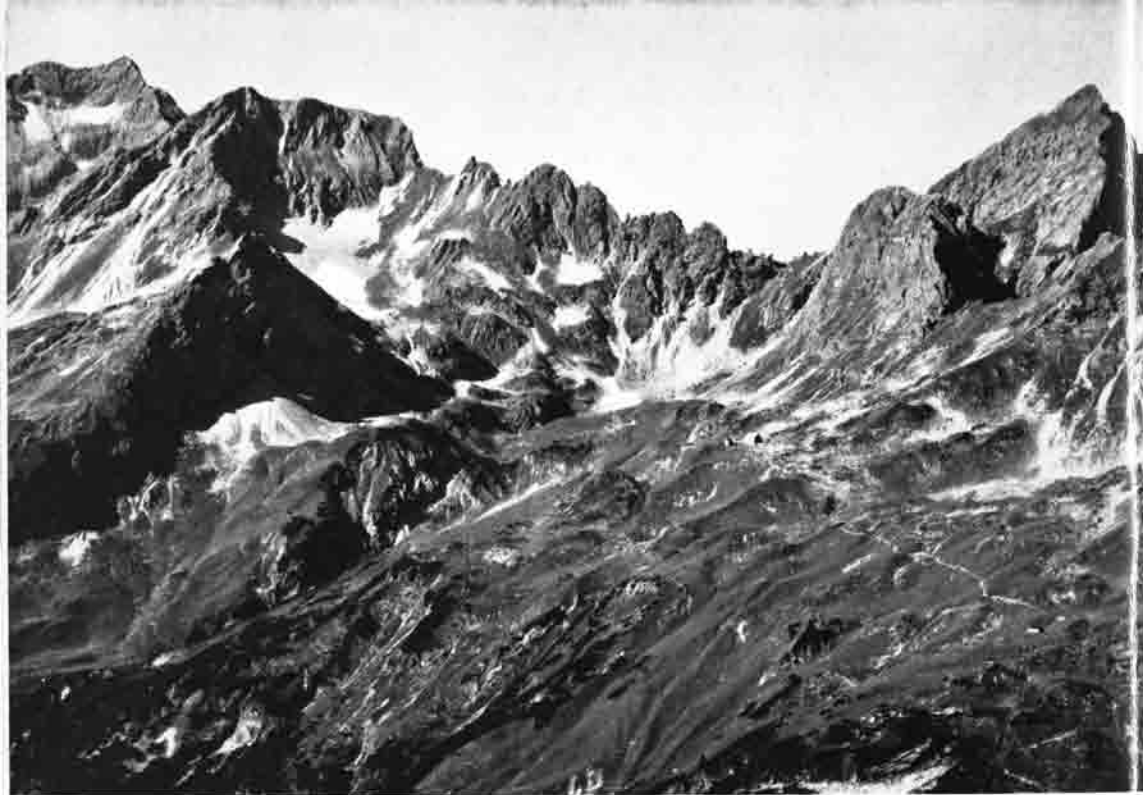
Bergkranz um die Mindelheimer Hütte von links Widderstein, Gaishorn, Angerkopf und Liechelkopf

Das Hochgebirge ist dem rechten Bergfahrer der Inbegriff natürlicher Schönheit und Größe, ein Tempel voll Stille, Friede, Erhabenheit und begeisternder Macht. Die Felsen und Firne sind die starken Säulen und schimmernden Wände, der Himmel das Dorgewölb und die Matten und Wälder die Teppiche drein. Nur das wilde, natürliche Bergland ist jener herrliche Quell der Freude! Hilf es erhalten!