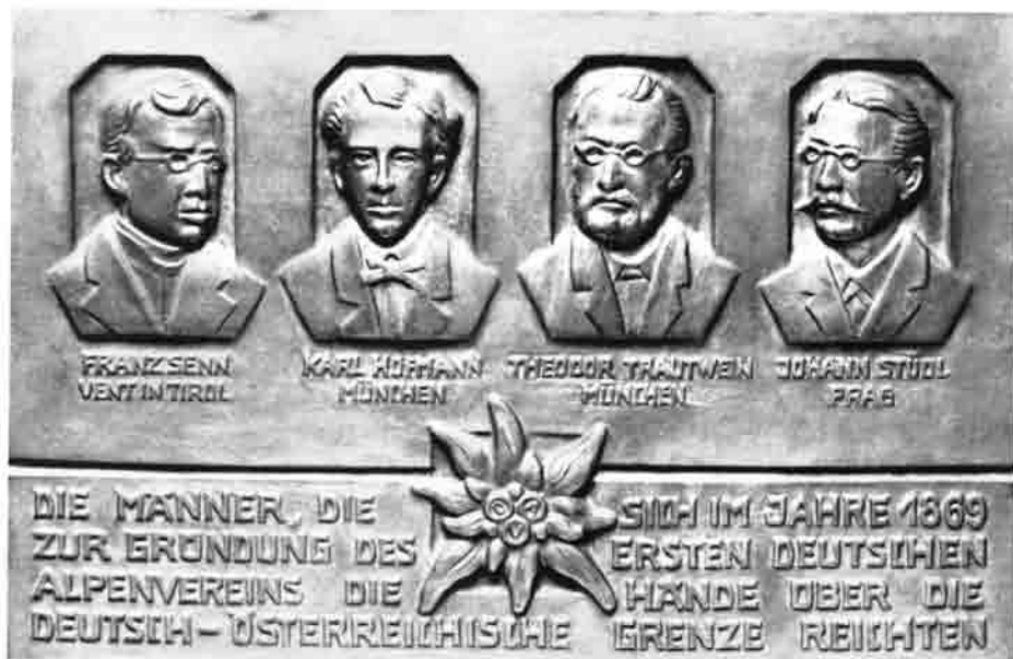
Die Gründer des Deutschen Alpenvereins. Bronze-Tafel in der Mindelheimer Hütte – Original in Kupfer getrieben vom ehemaligen 1. Vorstand Frz. Xaver Abt im Alpinen Museum in München.