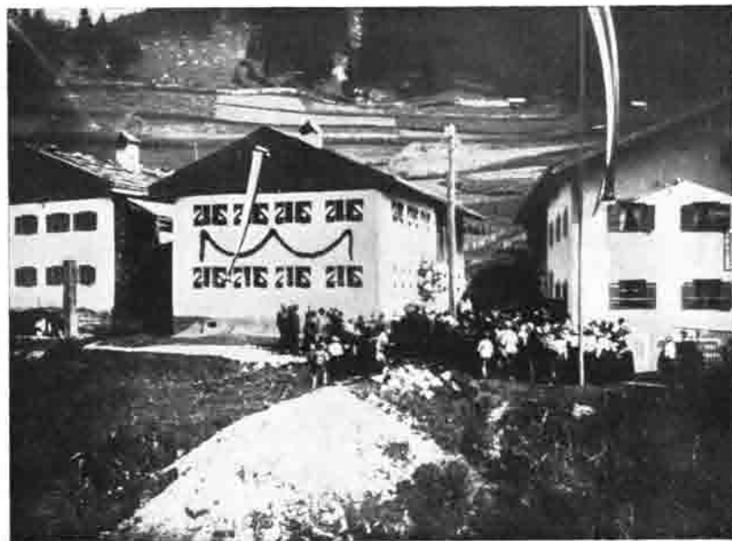
Rinnen (Tirol) Einweihung unseres Bergsteigerheimes Pfingsten 1925

Als nach Kriegsende endlich wieder spärliche Nachrichten über die wiedererstandene deutsch-österreichische Grenze drangen, bekamen wir wenig Gutes über das Haus, beziehungsweise über seinen baulichen Zustand zu hören. Vor allem war das Holzschindeldach während der Jahre der geschlossenen Grenzen so in Verfall geraten, daß das ganze Haus Schaden gelitten hatte. Daß ein wesentlicher Teil der Innenausstattung unauffindbar geworden