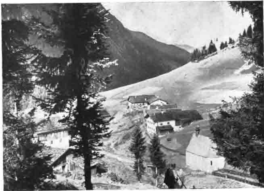
Rinnen (Tirol) Blick gegen das Rolledtal