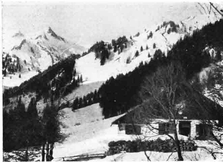
Engeratsgundalm (Allgäu) Blick gegen Zeiger und Seekopf