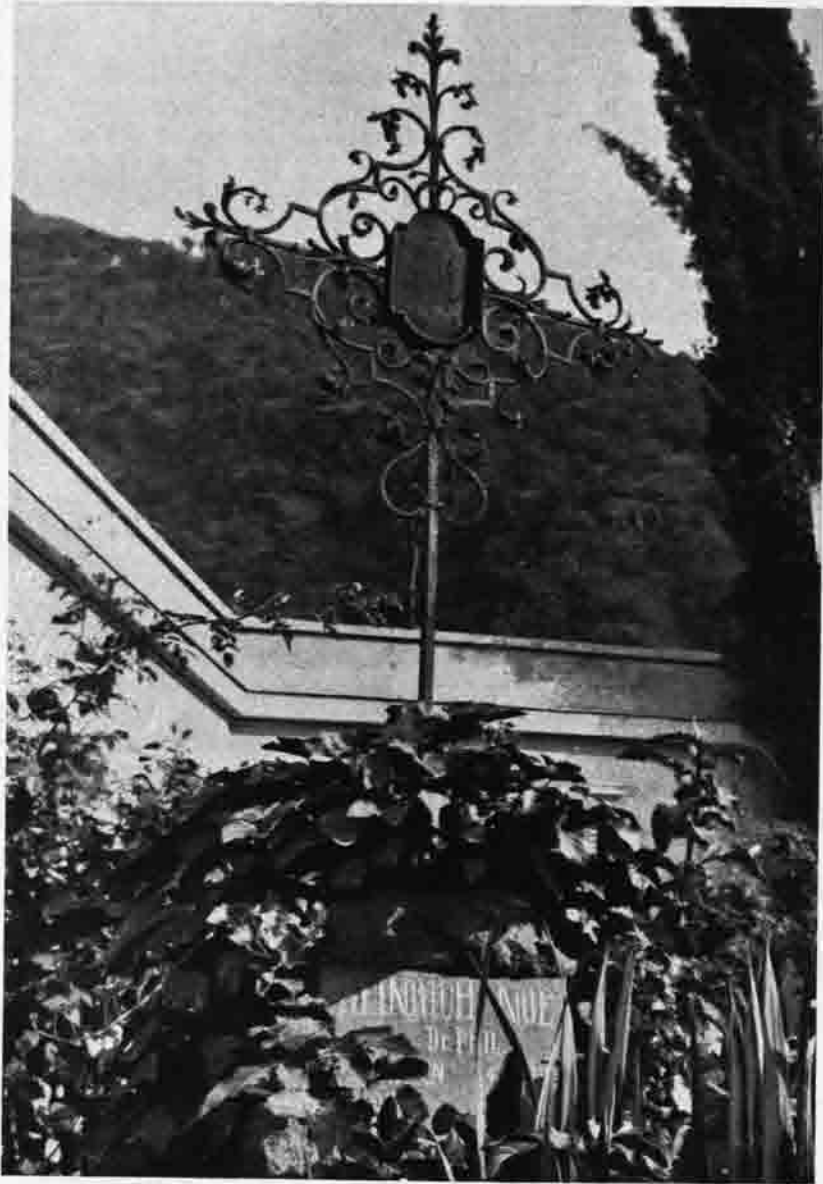
Heinrich Noë's Ruhestätte auf dem alten Friedhof in Bozen-Gries