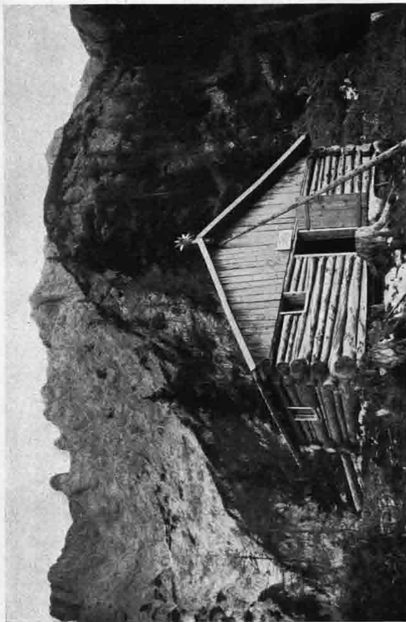
Die alte Karwendelhütte

Die erst kleine, aber sehr rührige Sektion Mittenwald erbaute bereits 1876 eine einfache Unterstandshütte auf dem Hohen Kranzberg (1392 m). 1888 wurde diese Hütte durch einen Orkan zerstört, jedoch mit Unterstützung des Hauptausschusses wieder errichtet. Auch später brannte sie einmal nieder und wurde wieder aufgebaut. Vor 1934 war sie sehr baufällig und eigentlich durch das schon gegen die Jahrhundertwende vom Bergführer Georg Fütterer erbaute Kranzberghaus überflüssig. Nun wurde die Hütte in das Übungsterrain der Wehrmacht ein-