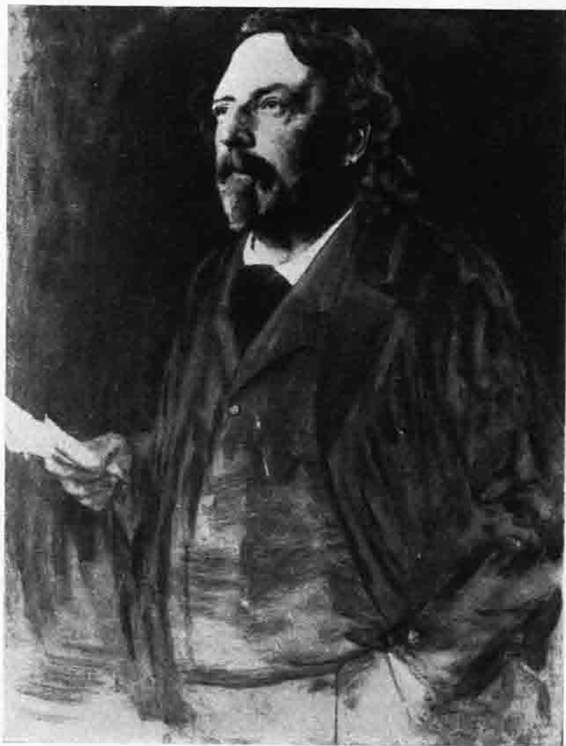
Nach einem Ölgemälde von Carl Amann