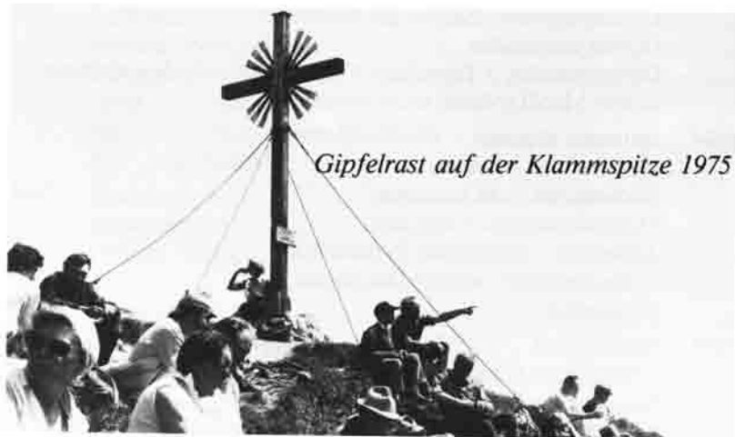
Gipfelrast auf der Klammspitze 1975

Eine Brotzeit in den Bergen schmeckt auch aus dem Papier, doch zuhause schmeckt's besser aus einem schönen Geschirr.