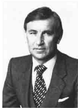
Der Landrat des Kreises Freising

Die Alpenvereinssektion Moosburg begeht im Herbst dieses Jahres ihr 25jähriges Bestehen.