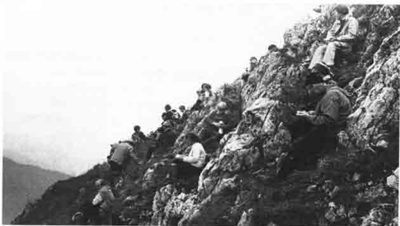
Moosburger am Fockenstein (1562 m) bei der Bergtour 1975.

8052 Moosburg, Herrnstr.4, Tel. 0 87 61 / 23 14