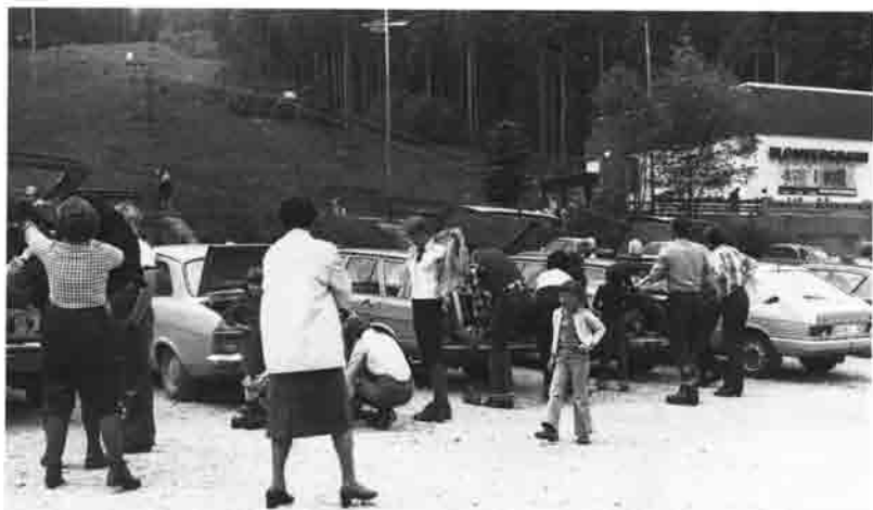
Großen Anklang fanden die Familienwanderungen für Selbstfahrer. Das Bild zeigt die Teilnehmer auf dem Parkplatz am Blomberg bei Bad-Tölz.