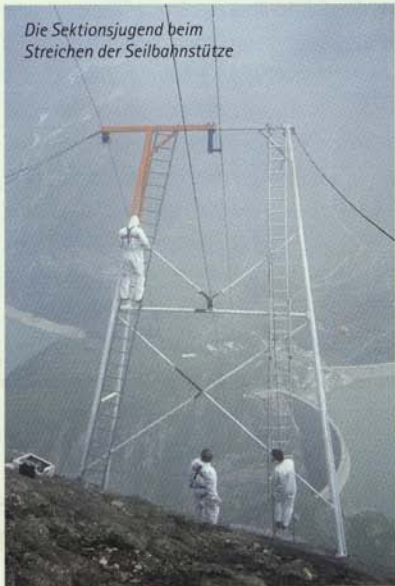
Die Sektionsjugend beim Streichen der Seilbahnstütze

ging um Sein oder Nichtsein des Hauses. Zusammen mit anderen kämpfte auch der damalige 1. Vorsitzende der Sektion, Dr. Erich Berger, wie ein Löwe, dass mit Ausnahmeregelungen doch wieder eine vorläufige Seilbahnbenützung möglich wurde. Kaum zu glauben: Das Äußere des Hauses konnte noch im Oktober wintersicher gemacht werden, und im nächsten Mai