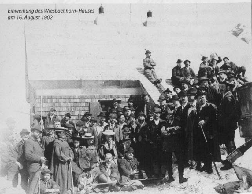
Einweihung des Wiesbachhorn-Hauses am 16. August 1902

Nach dem Bau eines Hotels am Mooserboden, einer Straße nach Kaprun und der Pinzgaubahn erwartete man mehr Besucher. Da wäre nun allerdings ein größeres Haus an einem trockeneren Platz besser gewesen. Es entbrannte ein heftiger Streit in der Sektion, ob es richtig wäre, dort ein Bergsteigerheim zu errichten, oder lieber ein attraktives Gast-Haus auf der Zugspitze. Für zwei Häuser war nicht genug Geld da. Es war fast eine Trotzreaktion, mit der – ohne viel Vorplanung – 35.000 Mark bewilligt wurden für ein fast überdimensionales Haus als Nachfolge für das „ewige Schmerzenskind“ Kaindl-Hütte. In der Folge verließ damals eine Gruppe von jungen „Oppositionellen“ wegen des nun doch gleichzeitigen Baus des Münchner Hauses auf der Zugspitze die Sektion und gründete die Sektion Bayerland. Natürlich gab es jetzt auch Probleme mit dem Grundbesitzer, dem Fürsten von Liechtenstein, der um seine Jagd fürchtete und zur Bedingung machte, dass keine Schusswaffen und Hunde hinauf dürften – unverschämte Pachtbedingungen stellte er obendrein. Dennoch konnte man