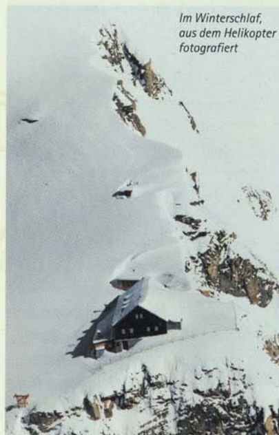
Im Winterschlaf, aus dem Helikopter fotografiert

Nach dem Zweiten Weltkrieg hatte der Österreichische Alpenverein, vertreten durch die Sektion Zell am See, das Haus verwaltet. Nach 1956 – wieder im Besitz unserer Sektion – wurde es für die immer zahlreicher herandrängenden Bergsteiger bald zu eng. 145 Personen sollen einmal in den 30 Lagern übernachtet haben. Da musste nun dringend erweitert werden.