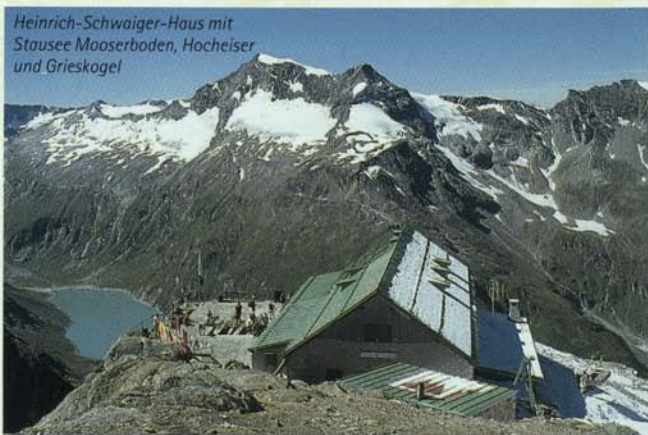
Heinrich-Schwaiger-Haus mit Stausee Mooserboden, Hocheiser und Grieskogel

Die Technik begann ab 1930 die Gegend zu verändern. Gewaltige Eingriffe der Tauernkraftwerke gestalteten das, was wir heute mit „Kaprun“ verbinden.