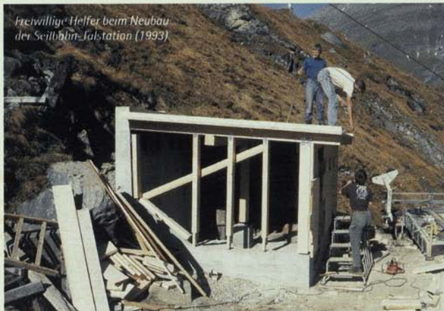
Freiwillige Helfer beim Neubau der Seilbahn-Fußstation (1993)

Emaillierte Warnkugeln, wetterfest und dauerhaft in der Farbe, sind über der Seilbahn aufgezogen worden, bei oft schrecklichem Wetter haben die Jungen den Weg repariert, die Seilbahnstützen und das Dach gestrichen, den Winterraum erneuert, ein Winterklo gebaut, neue Fenster eingesetzt ... Einmal, als der Sturm das Zugseil der Materialseilbahn um das Tragseil verwickelt hatte, konnten sie mit vereinten Kräften – ohne größere Hilfe durch die Sektion – die Bahn wieder zum Laufen bringen.