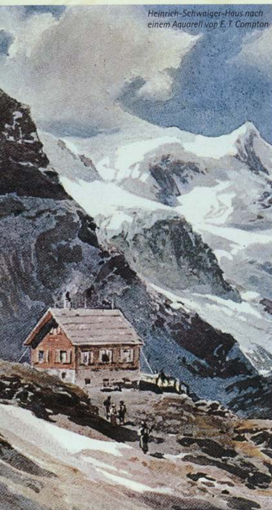
Heinrich-Schwaiger-Haus nach einem Aquarell von E. T. Compton

zenden Dreitausender. Dieses Jahr feiern wir das 100. Jubiläum seiner Errichtung, obwohl eigentlich ein vorausgehender Bau schon im Oktober 1901 an dieser Stelle stand. Ein Herbststurm hatte die Hütte allerdings schon im November des gleichen Jahres um 20 m verschoben, ein Sturm im März 1902 hat dem Bau dann den Rest gegeben. Der damalige Hüttenreferent der Sektion, Heinrich Schwaiger, sorgte für einen schnellen Wiederaufbau. Aus der nachstehenden Chronik können Sie entnehmen,