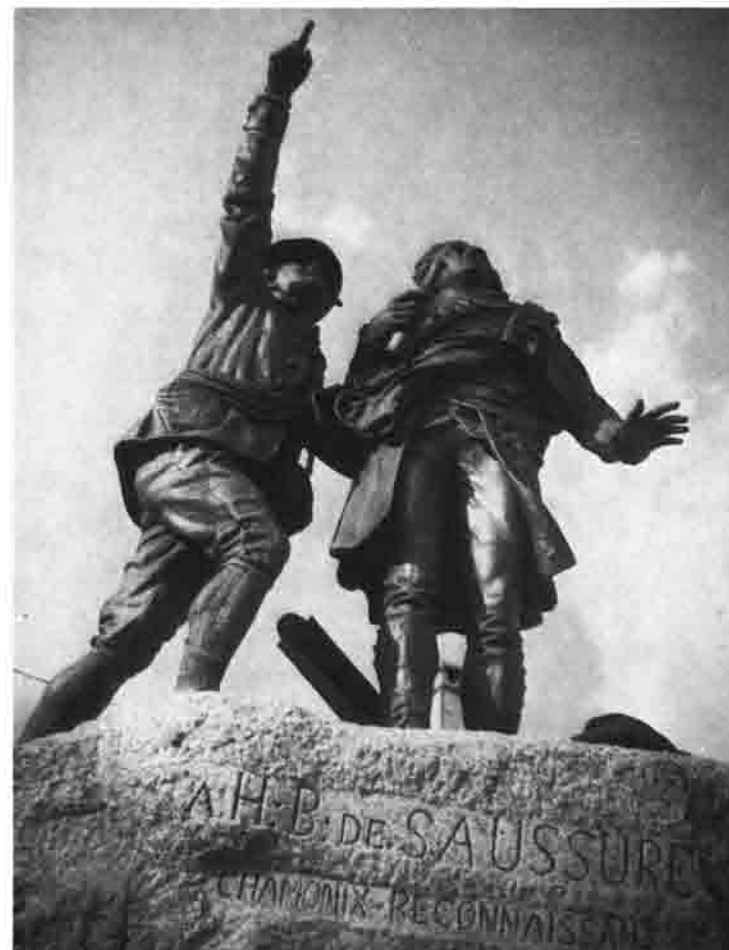
Das Denkmal für Horace Bénédict de Saussure und Jacques Balmat in Chamonix erinnert an die Erstbesteigung des Montblanc im Jahre 1786. Diese Erstbesteigung darf mit Recht als die Geburtsstunde des Alpinismus bezeichnet werden.