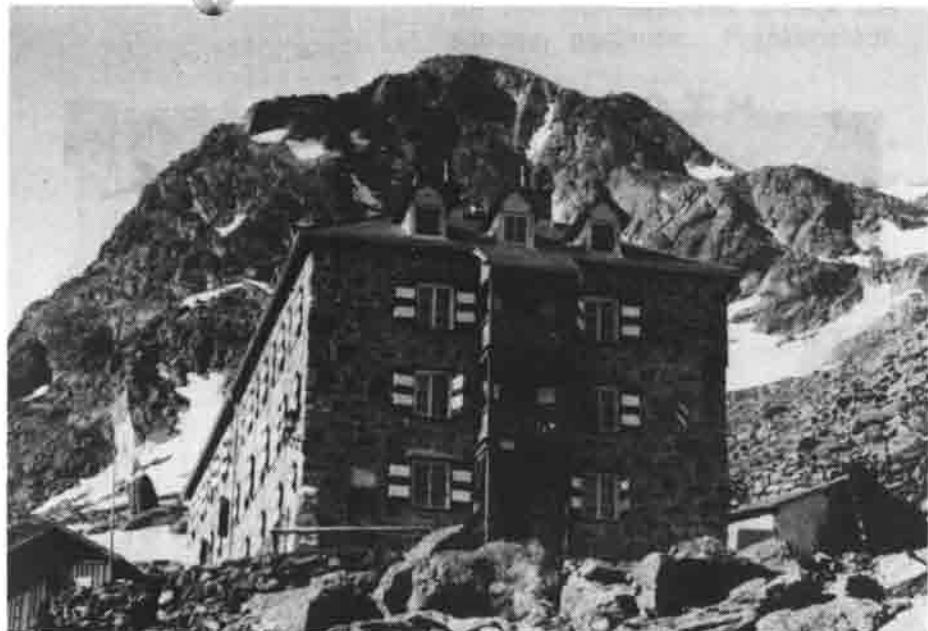
Die Nürnberger Hütte heute

Und nun mein Grußwort zur 25 Jahrfeier der DAV Gruppe Roth: Herzlichen Glückwunsch sagt Euch ein alter Freund; stellt 25 Kerzen um das Silberne Edelweiß, das zeigt den Geburtstag der Gruppe Roth an. Möge die DAV Gruppe Roth auch in aller Zukunft ein starkes Glied in der Kette der Alpenvereins-Sektion bleiben und mögen die Berge allen ihre Angehörigen Glück und Lebenskraft vermitteln. Berg Heil! Euer Hütenwart