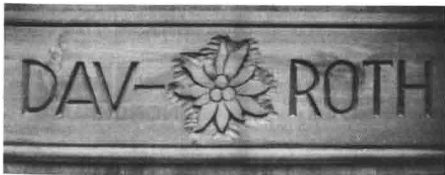
Ausschnitt aus der Eingangstür

Der DAV-TURM soll wie in der Zeit des Entstehens viele zusammenführen und aus dieser Gemeinsamkeit Allen viele frohe und berichernde Stunden schenken!