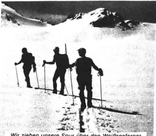
Wir ziehen unsere Spur über den Weißseeferner

Wir alle, die Sektion zählt nun schon über 6000 Mitglieder, wollen hoffen, daß unsere Sektion Nürnberg noch ein sehr langes Leben hat. Nach außen hin, so wie bisher anpassungs- und wandelfähig, im Innern aber beseelt von den heute noch gültigen Idealen ihrer Begründer. Bergkameradschaft bleibt auch weiterhin das festfügende Band.