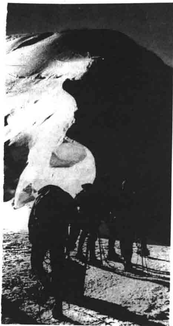
Gemeinsam zum Ziel