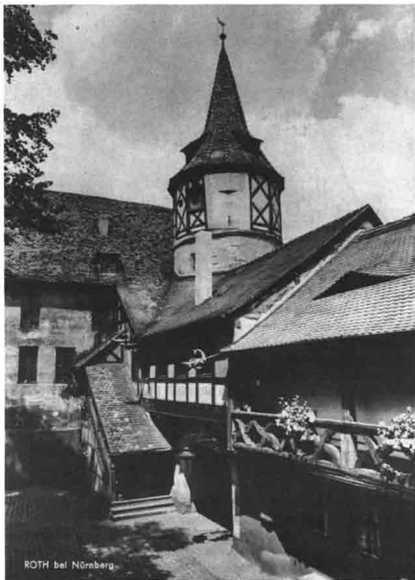
Schloß Ratibor. Im Schloßhof