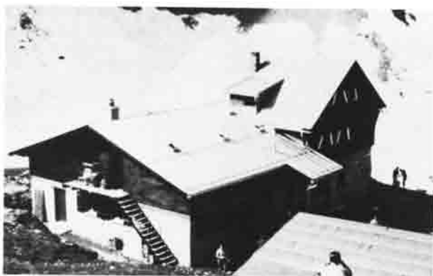
Der Anbau kurz vor der Fertigstellung.