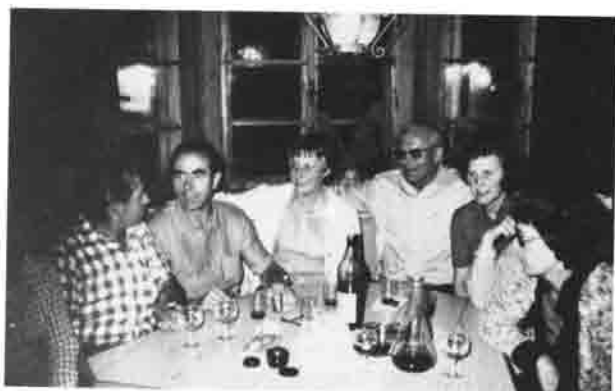
Gemütliche Runde im Erker der Anhalter Hütte.