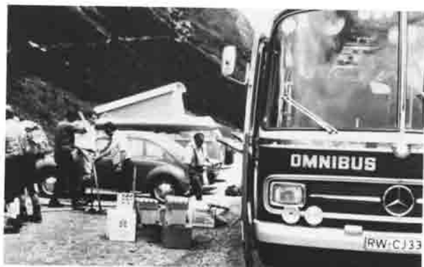
Das Wegebaukommando trifft am Hahntennjoch ein.