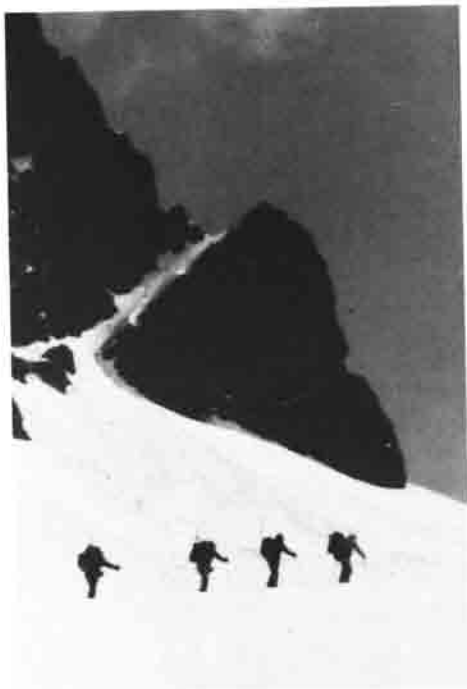
Schwer bepackt in der weißen Unendlichkeit der Haute Route..