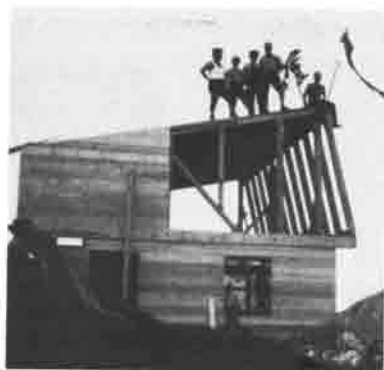
Auch ein Richtfest wurde gefeiert.