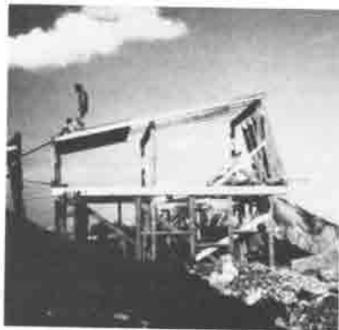
Die Zimmerleute beim Aufrichten..