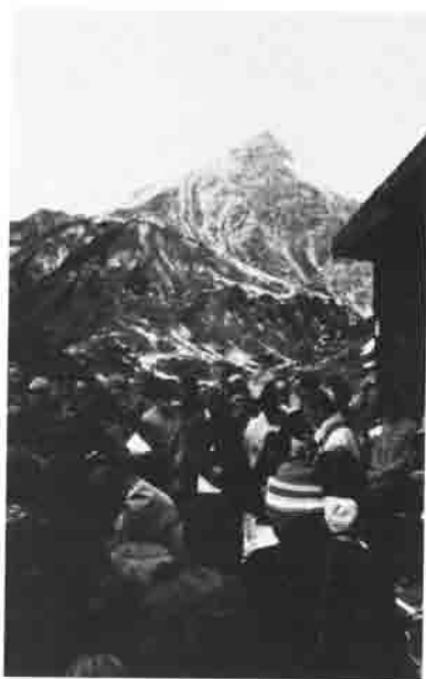
Bei der Einweihung: Die Bergmesse vor der Hütte.