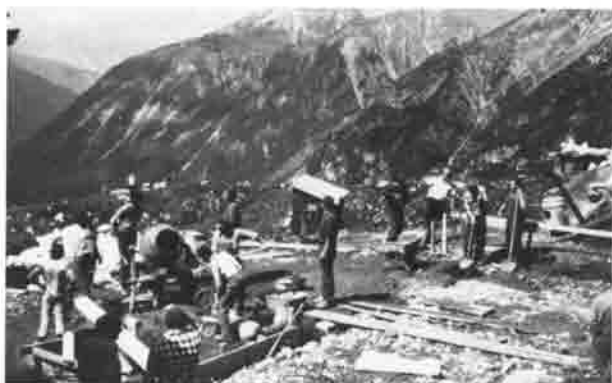
Die Betonkolonne beim Herstellen des Fundaments.