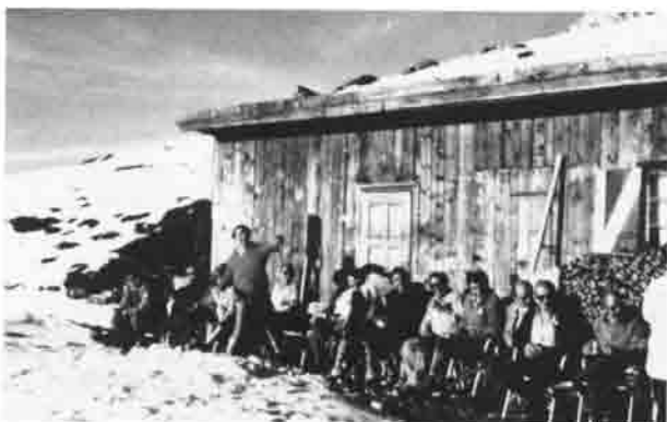
Der Vorstand sonnt sich vor dem Geräteschuppen im Bewußtsein der gemeinsamen „Großtaten“. Oktober 1978.

Einen Höhepunkt gab es Anfang Oktober 1978, als sich die gesamte Vorstandschaft auf der Anhalter Hütte von dem guten Zustand des Hauses überzeugen und in der stattfindenden Gesamtvorstandssitzung den Rahmen der Arbeiten auf der Hütte für die nächsten Jahre beschließen konnte. Zwei gemütliche Hüttenabende nur in eigener Runde ließen Freude und Stolz aufkommen über den Besitz der beiden Hütten, über die hinter uns liegenden erfolgreichen Jahre und über die Aufgaben, die uns noch zu tun bleiben.