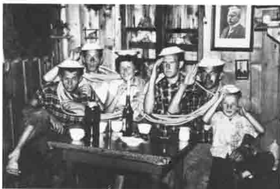
Hüttenzauber in der alten Heiterwandhütte.