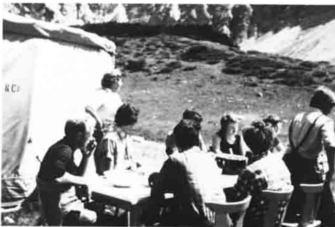
Die Hüttenbauer bei der wohlverdienten Mittagspause vor den Zelten.

Der Gastraum war zu klein und die Küche unzumutbar, auch die sanitären Verhältnisse waren nicht mehr tragbar. Also mußte wieder gebaut werden. Architekt