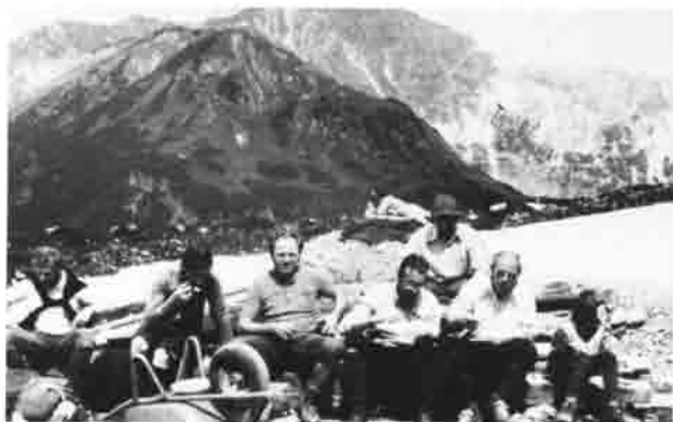
Baukolonne bei der „Zwischenmahlzeit“.