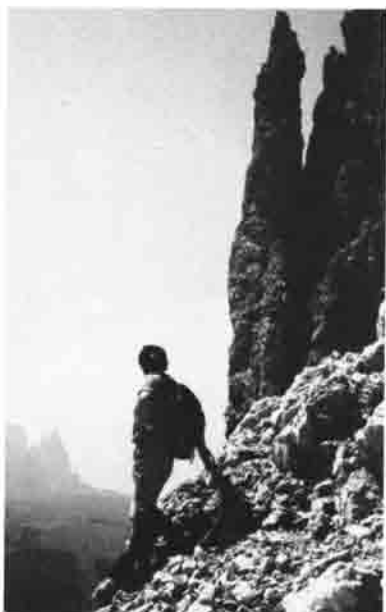
Auch an den Wänden und Türmen der Dolomiten sind unsere Kletterer zu Hause.