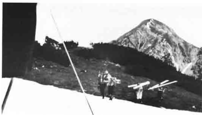
1967: Dacherneuerung der alten Heiterwand- hütte mit „Bergstei- gerkulis“.