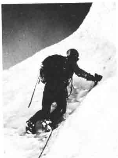
In der steilen Eiswand am Doldenhorn.