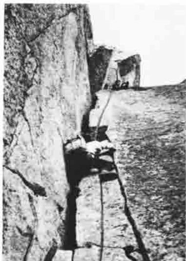
Beim Klettern in den Kreuzbergen.