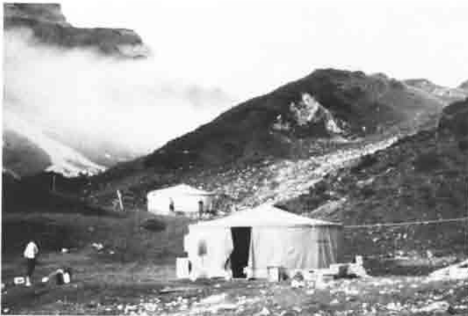
Kein Feldlager des Dschingis Khan, sondern das Lager des Schnellhüttenbaukommandos.

Unterkunftsmöglichkeit. In zwei Großzelten kampierten wir nahezu drei Wochen, und das alles bei einem Sauwetter ohnegleichen. Frauen, die unter primitiven Umständen kochten, und Männer, die bei Schnee, Regen, Sturm und Kälte und dann wieder bei Hitze schufteten – sie alle legten den Grundstein für eine verschworene Gemeinschaft.