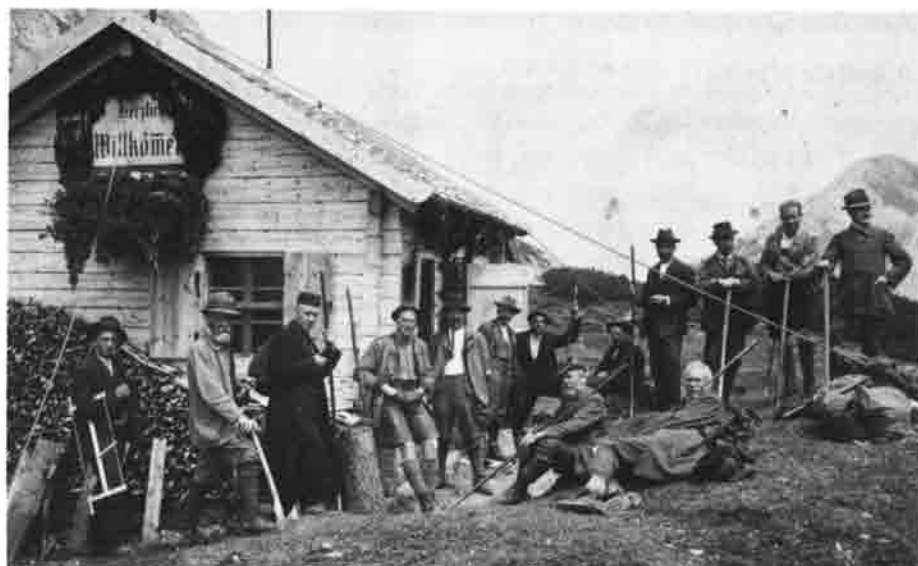
Einweihung der alten Heiterwandhütte als private Jagdhütte im Jahre 1911.

die Beschädigung der Kasse als durch den Verlust des Geldes, das jeweils von Woche zu Woche entnommen worden war. Diese kleinen Ärgernisse sind aber zu verkraften im Vergleich zu der Freude, die dieses einzigartige Hüttchen unseren Mitgliedern und allen Bergsteigern bereitet. Hoffen wir nur, daß es noch viele Jahre so gut erhalten bleibt und daß sich immer wieder Kameraden finden, die sich seiner annehmen.