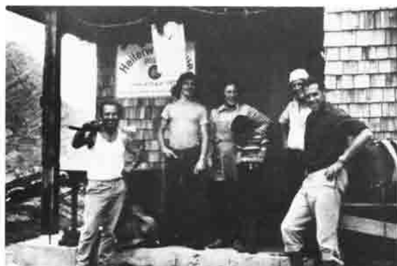
Die Hüttenwartsfamilie erhält Besuch.