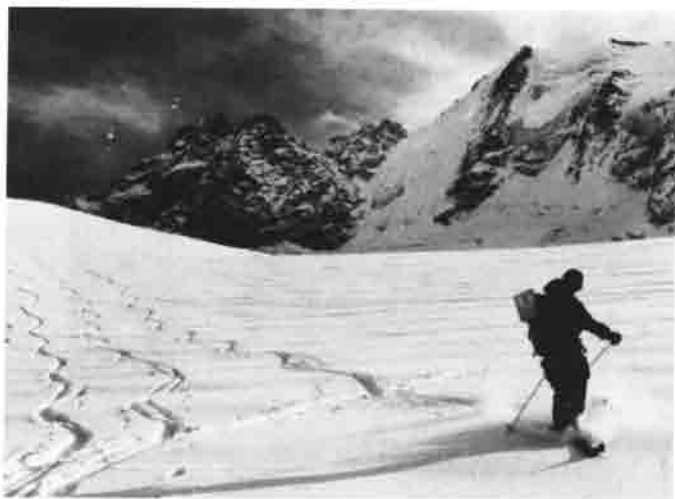
Herrliches Tiefschneefahren, auf dem Fornogletscher.