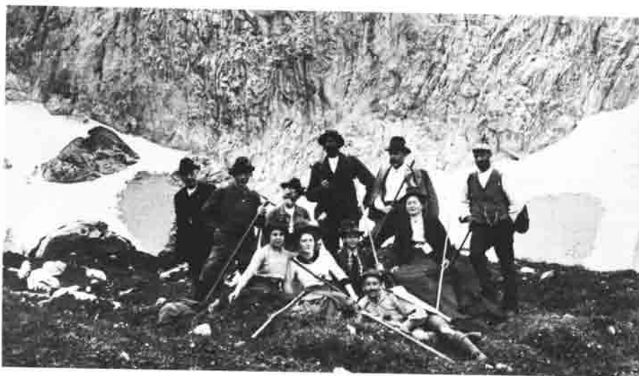
Eine Gruppe Bergsteiger der Sektion Anhalt-Dessau auf dem Platz der späteren Anhalter Hütte im Jahre 1911.

Im Rückblick waren all die Mühen nicht umsonst.