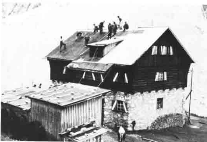
Auch das schadhafte Dach der Anhalter Hütte mußte erneuert werden. Viele freiwillige Helfer waren dabei eifrig am Werk.

1967/1968 verlegten wir an der Anhalter Hütte eine neue Wasserleitung. Die alte entsprach nicht mehr der Umweltfreundlichkeit und auch nicht der gestiegenen „Nachfrage“. Da wir bereits am Heiterwandhütten Dach einige praktische Erfahrungen gesammelt hatten, war es für uns kein sonderlich schwieriges Problem, das inzwischen auch schadhaft gewordene Dach an der Anhalter Hütte zu erneuern.