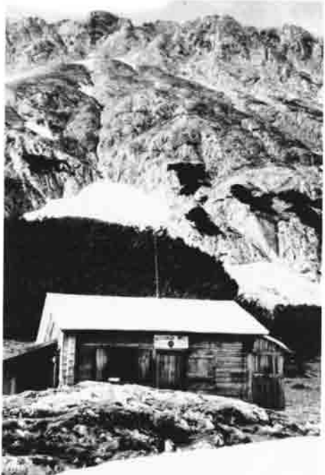
Die alte Heiterwandhütte vor der Zerstörung durch eine Staublawine im Jahre 1970, bereits mit einem neuen Dach.

Bereits im ersten Jahr meiner Vorsichtertätigkeit mußte das Dach an der alten lieben Heiterwandhütte neu gerichtet werden, das fünf Jahre später bereits wieder durch eine von der Heiterwand abgehende Staublawine weggerissen wurde.