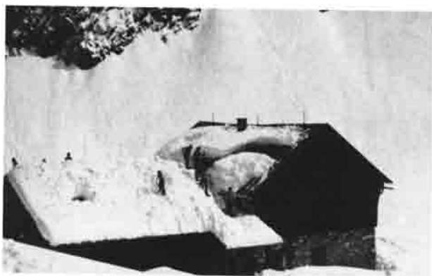
Anhalter Hütte an Pfingsten 1978. Das Hüttendach wird von Schnee und Eis befreit.