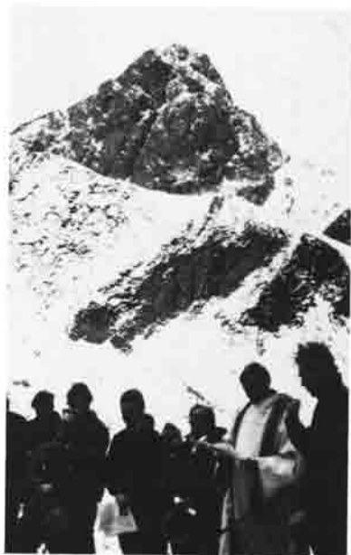
Weihe des Gipfelkreuzes der Gabelspitze, das am Abend zuvor errichtet worden war.