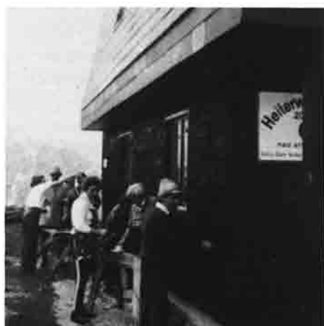
Das bewährte Handwerkerteam beim Anstreichen der neuen Hütte.

die Beschädigung der Kasse als durch den Verlust des Geldes, das jeweils von Woche zu Woche entnommen worden war. Diese kleinen Ärgernisse sind aber zu verkraften im Vergleich zu der Freude, die dieses einzigartige Hüttchen unseren Mitgliedern und allen Bergsteigern bereitet. Hoffen wir nur, daß es noch viele Jahre so gut erhalten bleibt und daß sich immer wieder Kameraden finden, die sich seiner annehmen.