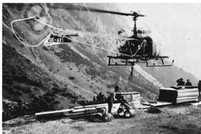
Der Hubschrauber bringt das auf dem Hahntennjoch gelagerte Baumaterial hinauf zur Baustelle.