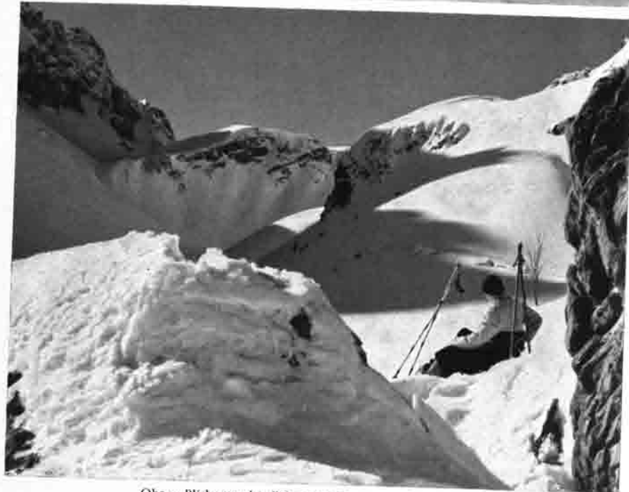
Oben: Blick von der Fiderepaishütte gegen die Hötats Unten: Zu den Skifahrten, die noch im Mai möglich sind, gehört die Abfahrt vom Fiderepaß zur Kühgundalpe

Eine erste Planung war auf die Maschinenanlage beschränkt, brachte der Sektion zwar die behördliche Genehmigung ein, gab aber für die finanzielle Disposition ein völlig ungenügendes Bild.