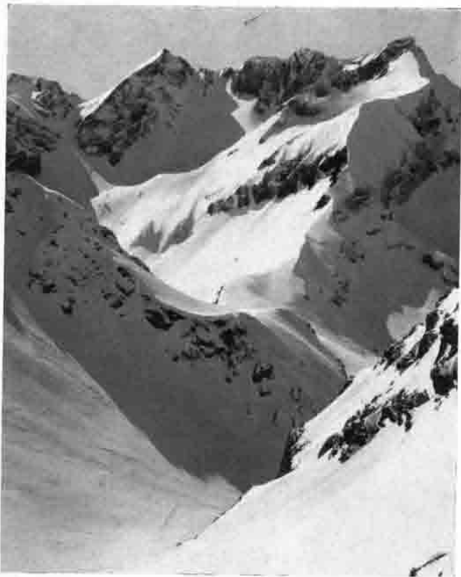
Zu den beliebtesten Spätwintertouren im Fiederepaßgebiet gehört der Elferkopf (rechts).