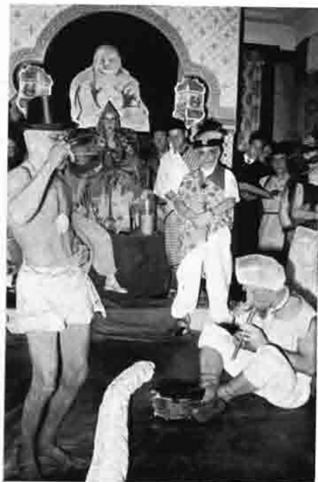
Gründungsfeier der Sektion „Brahmaputra“ im Fasching 1952