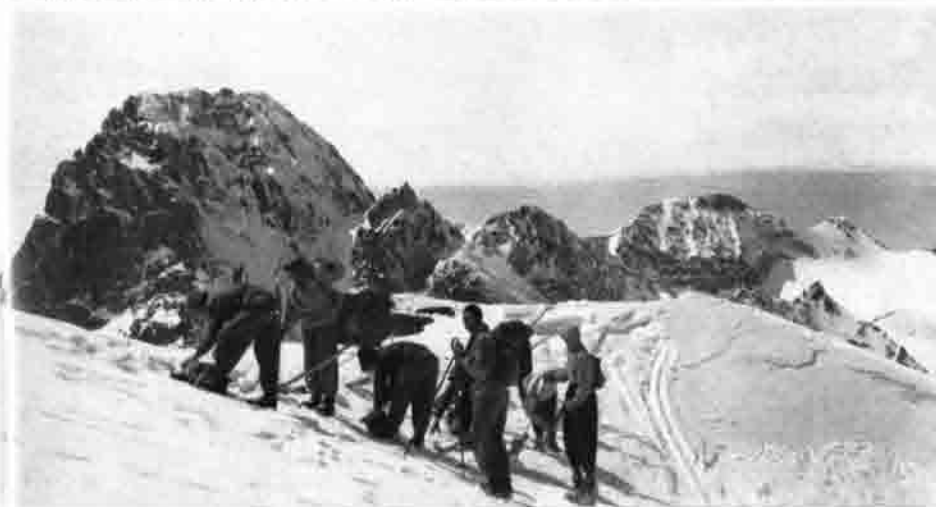
Links oben: Auf dem Gipfel der Krottenspitze. Rechts oben: Piz Tschierva, Piz Morteratsch, Höhe Forcla Sinoloy (Bernina). Unten: Aufstieg zur Dreiländerspitze (Silvretta) mit Blick auf Piz Buin.