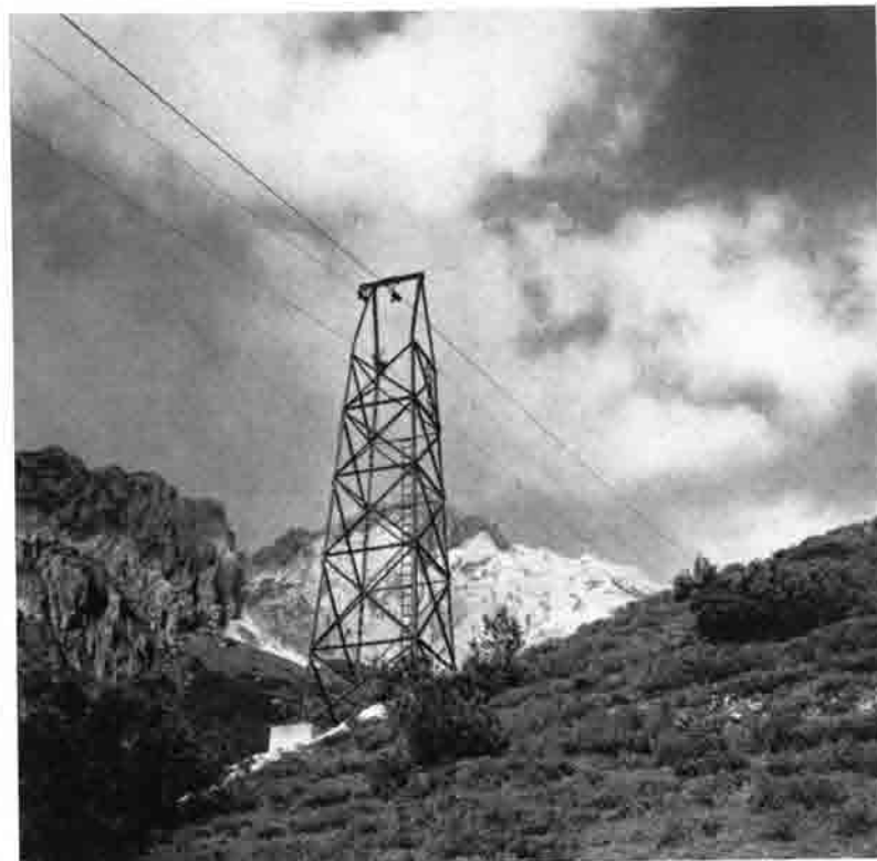
Oben: Unsere Hütte mit der Hammerspitze. Unten: Eine der beiden Eisenstützen unserer Materialbahn. Hergestellt von der Fa. Gebr. Frisch, Augsburg. Im Hintergrund Hochgehrenspitze und Hammerspitze