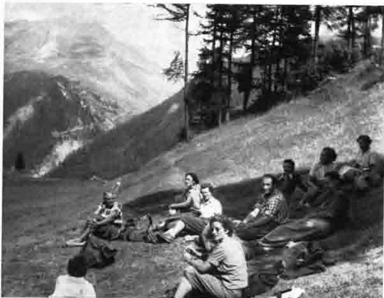
Sektionsfahrt nach Zermatt 1953 (bei Aroleid)