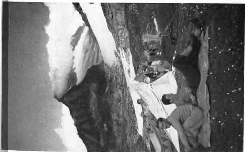
Lager am Weißtörl