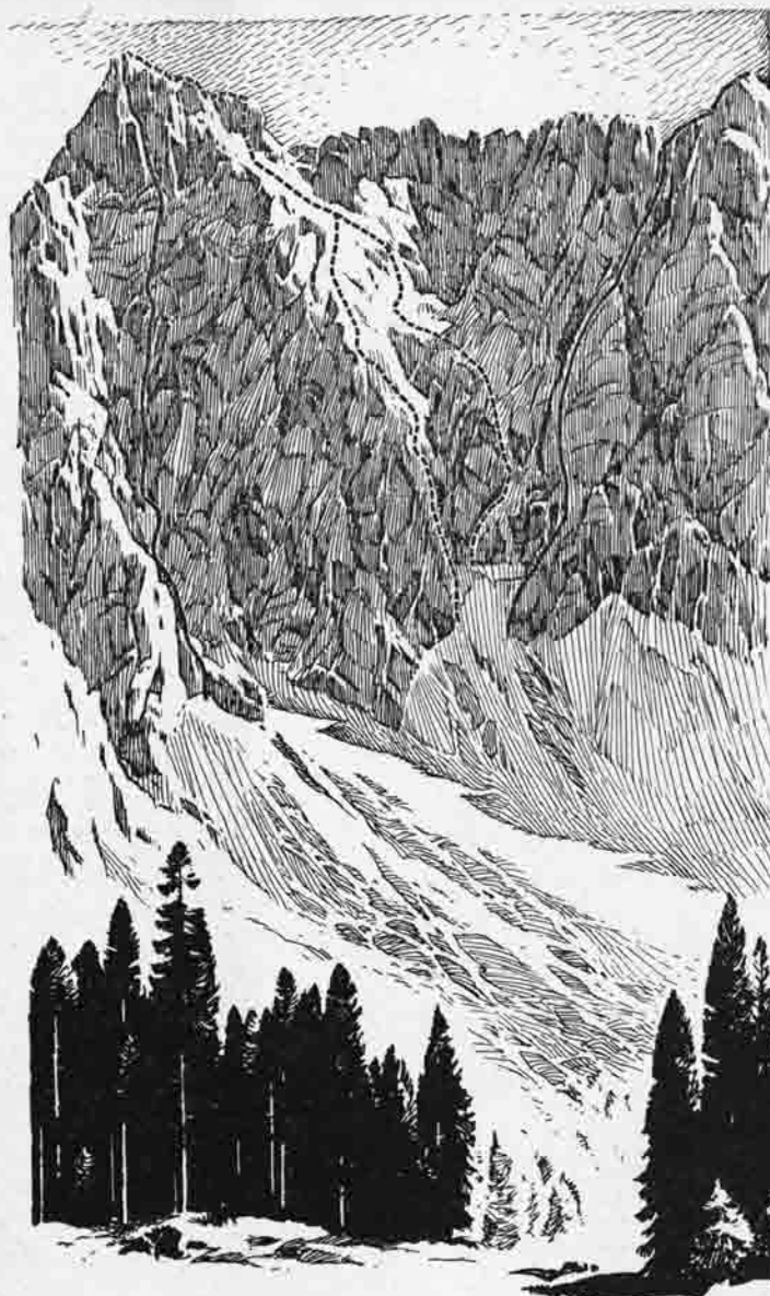
Bes. Otto B. andhuber

*) Damals noch Angehörige der Bergsteigergruppe.