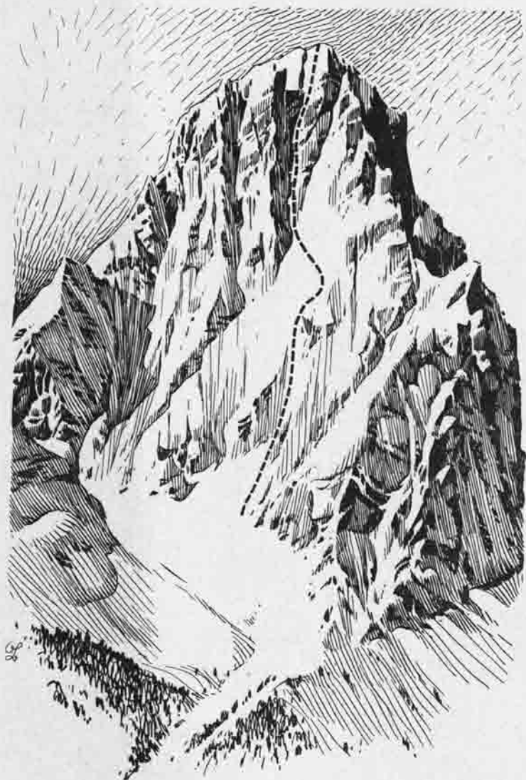
Bez. Otto Brandhuber

Sehr schwierig an der rechten Begrenzungswand aufwärts und in die rechte Wand hinaus auf ein Band, das man bis an sein Ende verfolgt. Nach links gegen die überhangende Verschneidung zurück und aufwärts nach rechts, dann durch eine Rinne und 40 m äußerst schwierige Querung in freier Wand. Nun aufwärts und schwach nach rechts in eine Wandeinbuchtung. Aus ihr durch einen schwach ausgeprägten Riß und über Schrofen empor. Dann schwierige Querung nach links in eine Rinne. Durch diese zu einem Wandteil, in dem oben ein Ramin sichtbar ist. Über die kleingriffige Wand aufwärts bis zu einem von rechts nach links verlaufenden, äußerst schwierigen, überhangenden Riß, dann steil rechts aufwärts, durch eine seichte Rinne links haltend auf ein abgeschrägtes Köpfel (Beiwachtplatz der Erstbegeher). Nun gerade hinauf über die Wand zu einer Rippe und rechts von der Rippe durch einen versteckten Riß schwierig auf den Rippenkopf. Weiter rechts durch einen seichten Ramin und nach links querend in einen von unten auffallenden Ramin. Aus ihm links zu einer Höhle (Karten, Steinmann). Rechts gerade hinauf zu einem steil nach rechts aufwärts führenden Band. Einige Seillängen weiter bis zu seinem Ende unter einer Gratrippe. Über sie einige Seillängen empor, dann sobald sie sich verliert über