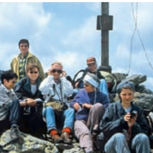
Die Potsdamer Hütte liegt erhöht über dem Fotschertal. In der Bildmitte (o.) der Wildkopf, der häufig besucht wird (l.); im Winter bietet die Hütte viele Skitourenmöglichkeiten (g.l.).