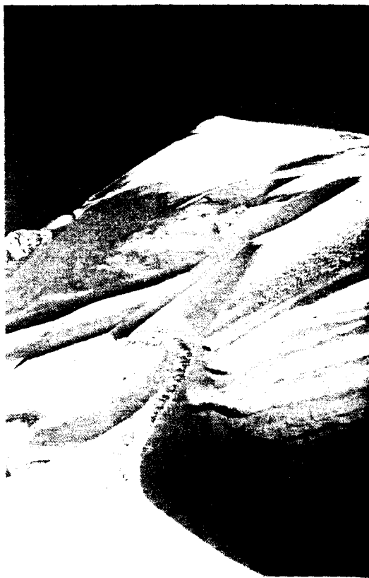
Der Gipfel ist zwar das Ziel, aber der Weg dorthin steht dem Blick von oben keinesfalls nach

freunde auszulösen. Obwohl die Bergsteiger sicherlich keine besseren Menschen als der Durchschnitt der Gesellschaft sind, habe ich in total überfüllten Berghütten und auf Gipfeln mit Menschentrauben fast nie Aggressivität, sondern überwiegend Gelassenheit, Geduld und Hilfsbereitschaft angetroffen. Wo gibt es denn so etwas im normalen Alltag noch? Dies kann eigentlich nur aus einer tiefen Zufriedenheit und aus kameradschaftlichem Empfinden erwachsen.