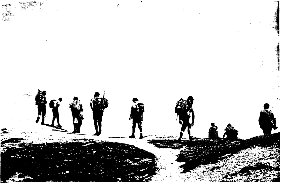
Mitglieder der Sektion Recklinghausen auf Tauernwanderung

kannt. Dazu gehörten z. B. regelmäßige Sektionsabende mit Lichtbildervorträgen, öffentliche Vorträge im Winterhalbjahr (wie heute auch noch), gemeinsame Bergfahrten und Wanderungen in der näheren Umgebung und im Sauerland. Die Sektionsjugend war in dieses Geschehen mit eingebunden. Ein weiterer Höhepunkt im Sektionsleben war dann das 75jährige Jubiläum. Es wurde 1981 in der Engelsburg gebührend, wenn auch leider mit zu geringer Beteiligung der Mitglieder, begangen. Das heutige Sektionsleben soll noch an anderer Stelle aufgezeigt werden.