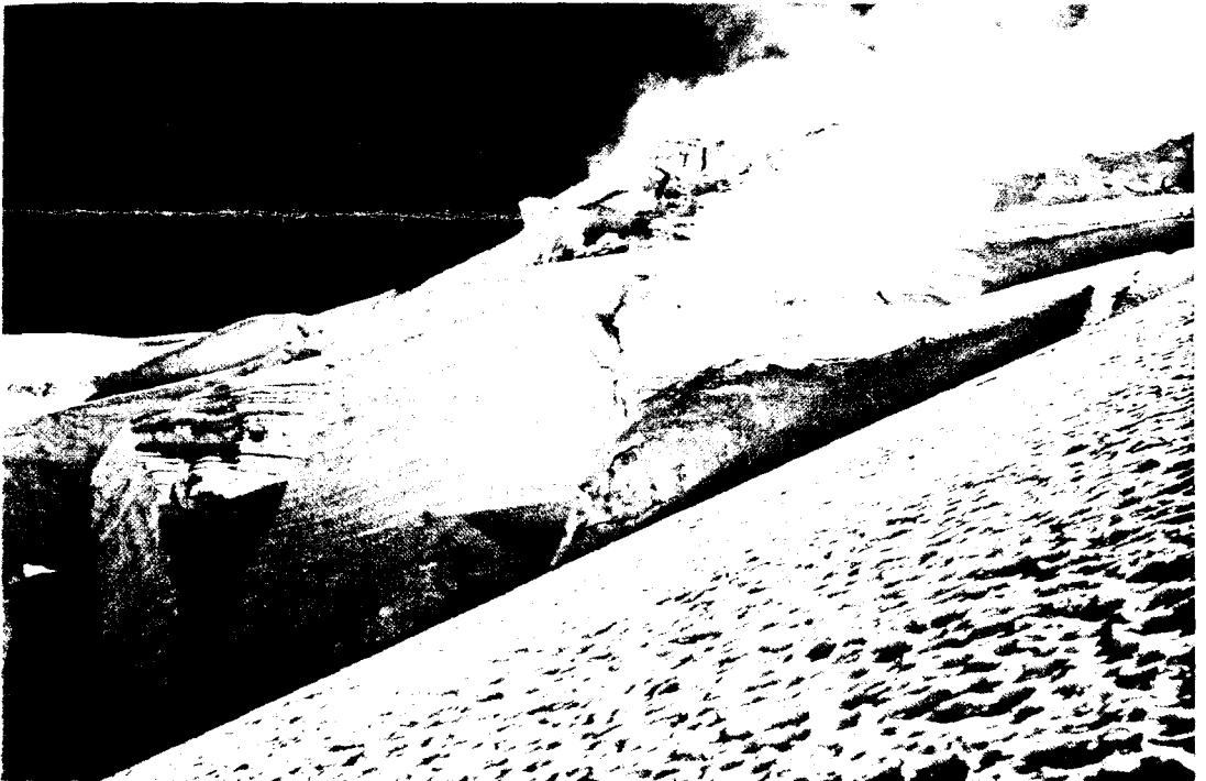
Gletscher und Eisbrüche sind gefährlich, aber sie bilden die Zauberwelt des Bergsteigers

Über das Wissenswerte im großen Alpenraum informiert die sechsmal jährlich erscheinende Zeitschrift „Deutscher Alpenverein“ (Eigenverlag München), über das Geschehen im Raume von Recklinghausen, die zweimal