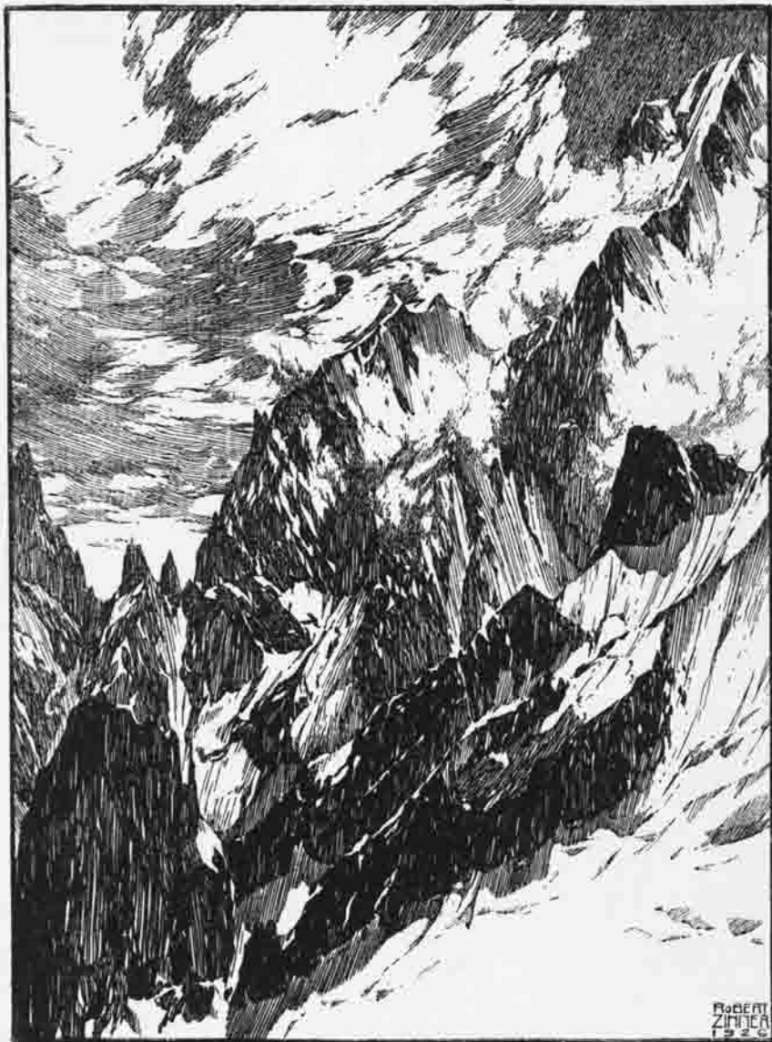
Mont Blanc — Dentreegrat.

Alpenvereinssektion „Die Reichensteiner“ - in Wien -