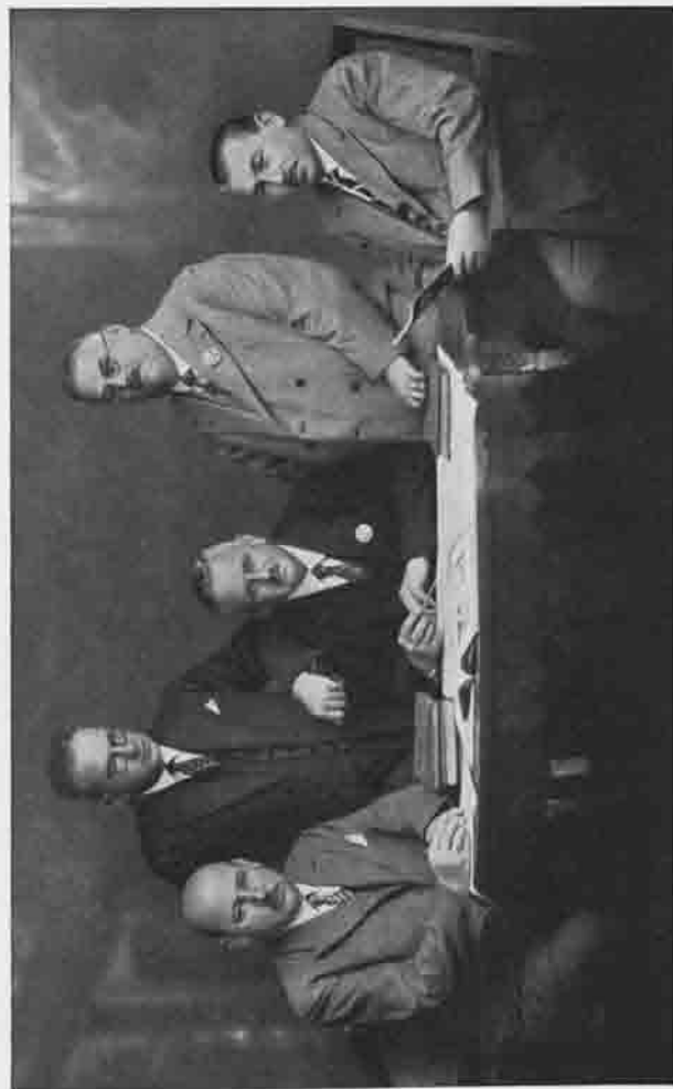
Die Vorstandsmitglieder 1930