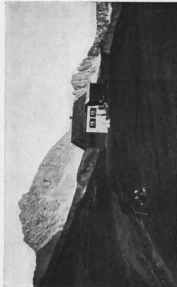
KAISERJOCHHAUS (auf dem Kaiserjoch 2506 m)