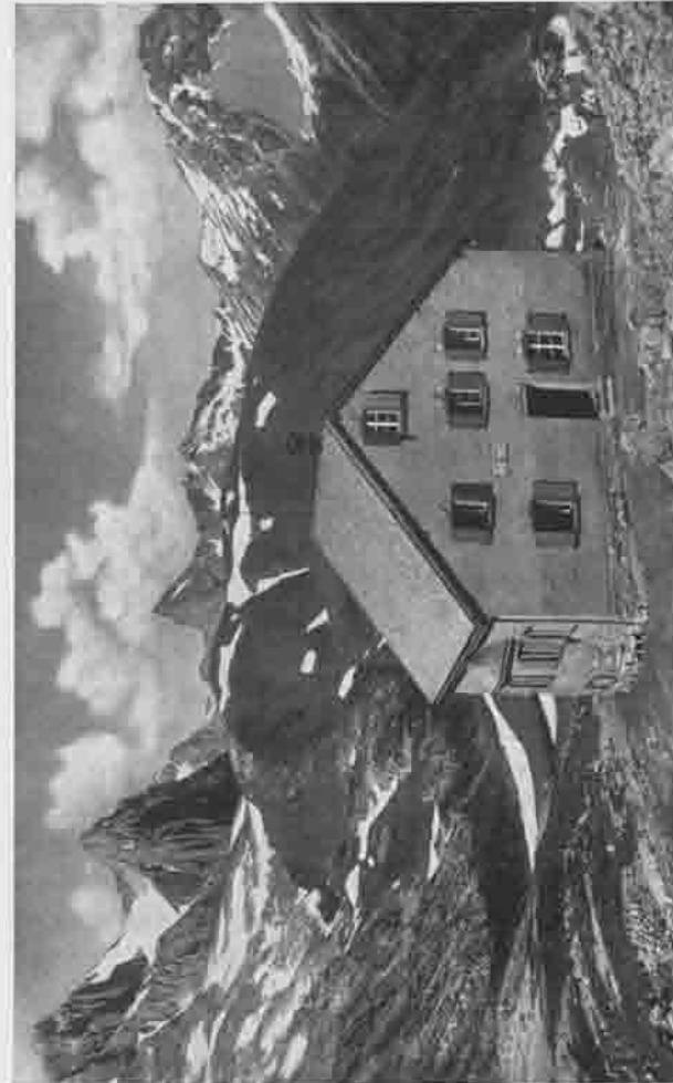
LEUTKIRCHER HUTTE (auf dem Almajurjoch 2251 m)