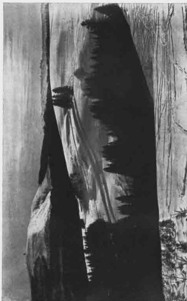
SCHWARZER GRAT Winterbild von C. Bayer - Leutkirch