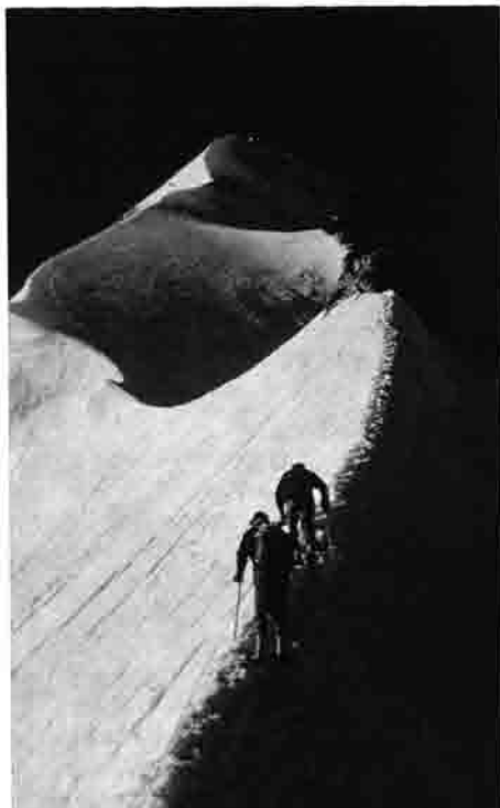
Erste Bernina-Großtour 1962 Biancograt - Bernina

Die Abende im gemeinsamen Quartier wurden in froher Runde verbracht, wobei neben Geselligkeit und Tourenvorbereitung noch Zeit verblieb um sich für die alten Kulturwerte dieser Landschaft zu interessieren oder im Wechselgespräch mit