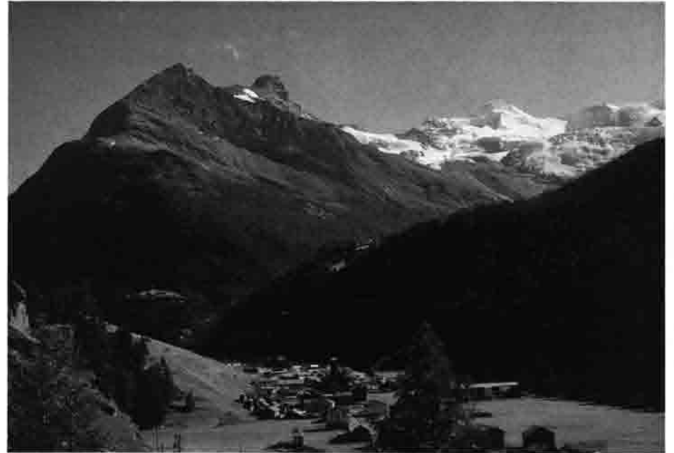
Saas-Grund Unser Standquartier Wallis: Großtour 1965