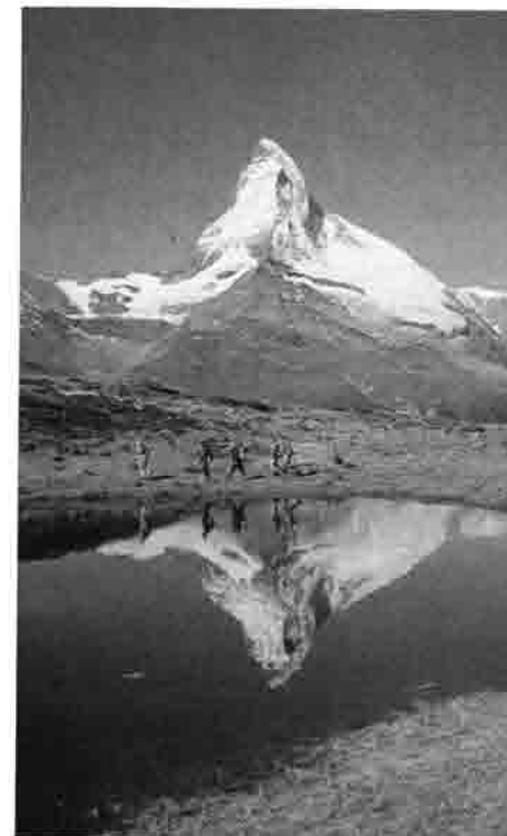
Wallis-Großtour 1965 Matterhorn