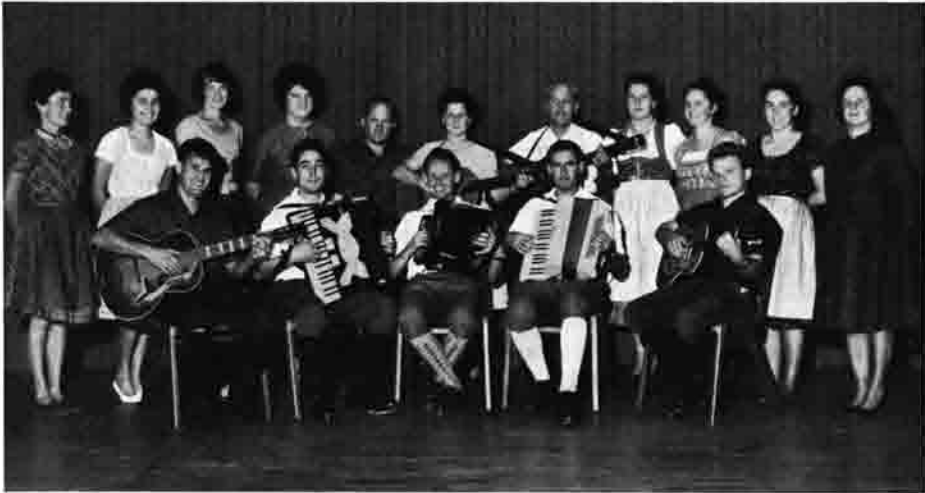
Sektions-Sing- und Spielgruppe 1965