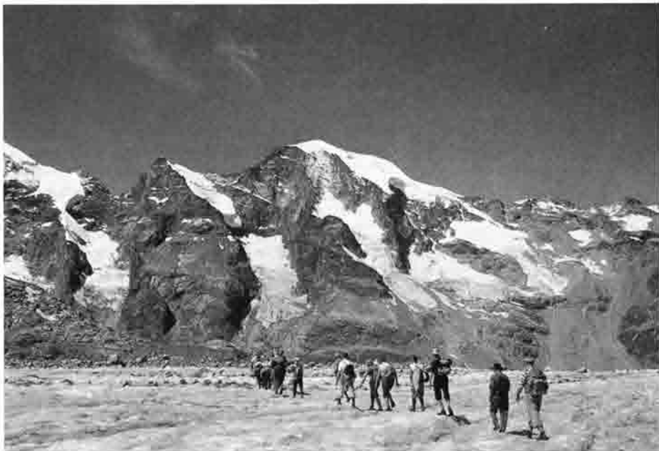
Zweite Bernina-Großtour 1963 Morteratschgletscher

Ausblick von der Höhe des Muotta-Muragl (2453 m) auf die strahlenden Eisberge der Bernina-Gruppe und auf die tief unten liegende Seenkette des Oberengadin. War schon die sich anschließende Hangwanderung zur noch höher gelegenen Segantinihütte (2753 m) ungemein reizvoll, so trat jetzt das Bernina-Massiv noch wuchtiger in Erscheinung. Der Abstieg wurde über die Alp Languard nach Pontresina (1803 m) genommen. Ab dort übernahm der Bus die Heimfahrt ins Quartier.