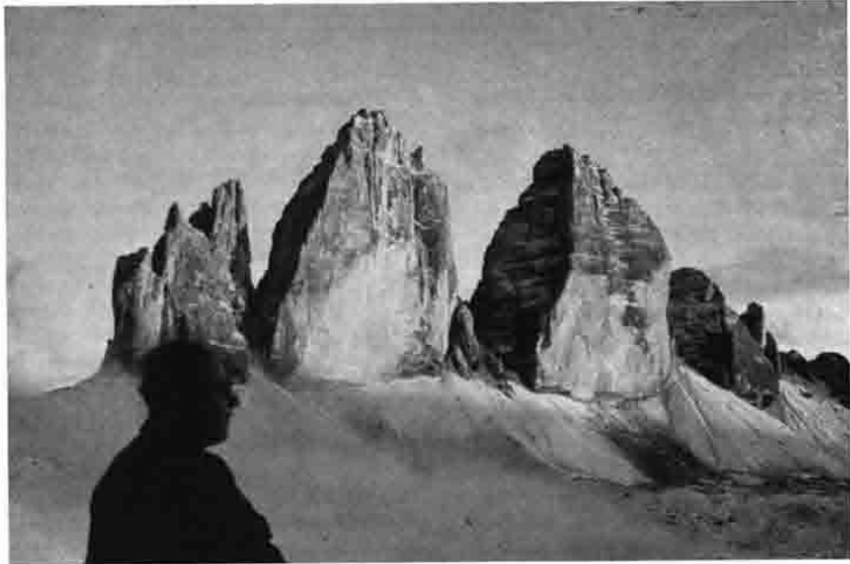
Zweite Dolomiten-Großtour 1957 Drei Zinnen