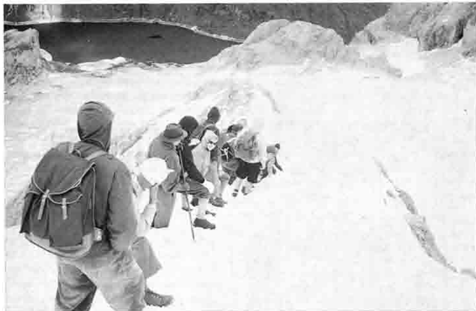
Dritte Dolomiten-Großtour 1960 Marmolata-Abstieg