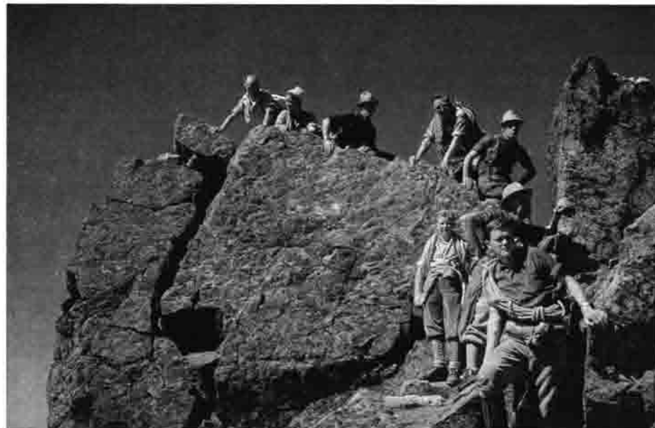
Patteriol-Gipfel (3059 m) Sektionstour 1962