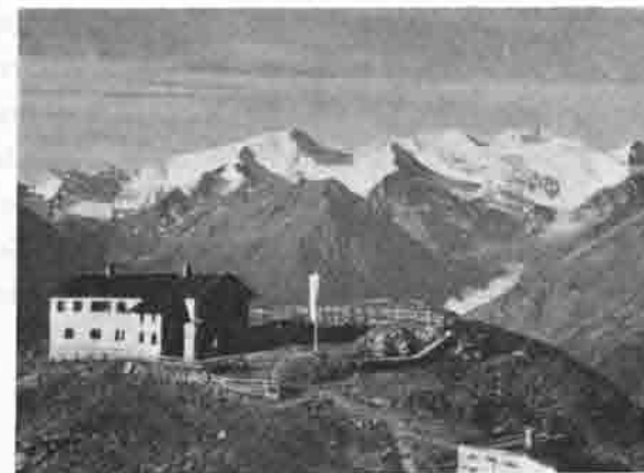
Starkenburger Hütte/Stubai/Tirol

stift sowie dem ganzen Stubai zum Heile diene. Die Arbeiten schritten rasch voran, so daß bereits Ende Juli der Hütten-Rohbau vollendet war. Bei einer Beteiligung von fast einhundert Personen wurde am 6. September 1900 die Hütte feierlich eingeweiht und ihrer Bestimmung übergeben. Der Vorsitzende, Stadtverordneter Egenolf, betonte in seiner Weihe-Ansprache „daß vor neun Jahren zwei Sektionsmitglieder auf ihrer Hochgebirgstour zu diesem herrlichen Fleckchen Erde gekom-