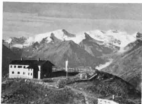
Starkenburger Hütte/Stubaier Tirol

Geschäftsstelle: Darmstadt, Steubenplatz 12 (Kohlen-Schneider, Fernsprecher: 7 46 31) / Postcheckkonto: Frankfurt am Main Nr. 605 02