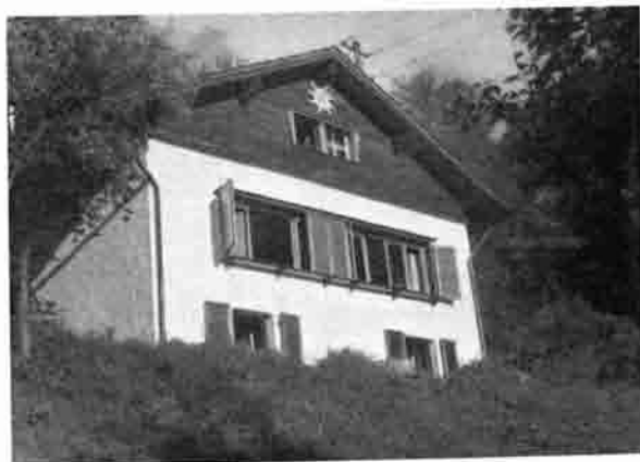
Die Felsberghütte in neuem Gewand.

Pfingsten (4.—6. Juni) trifft sich die Jugendgruppe auf der Felsberghütte. Wanderung „Rund um den Felsberg“.