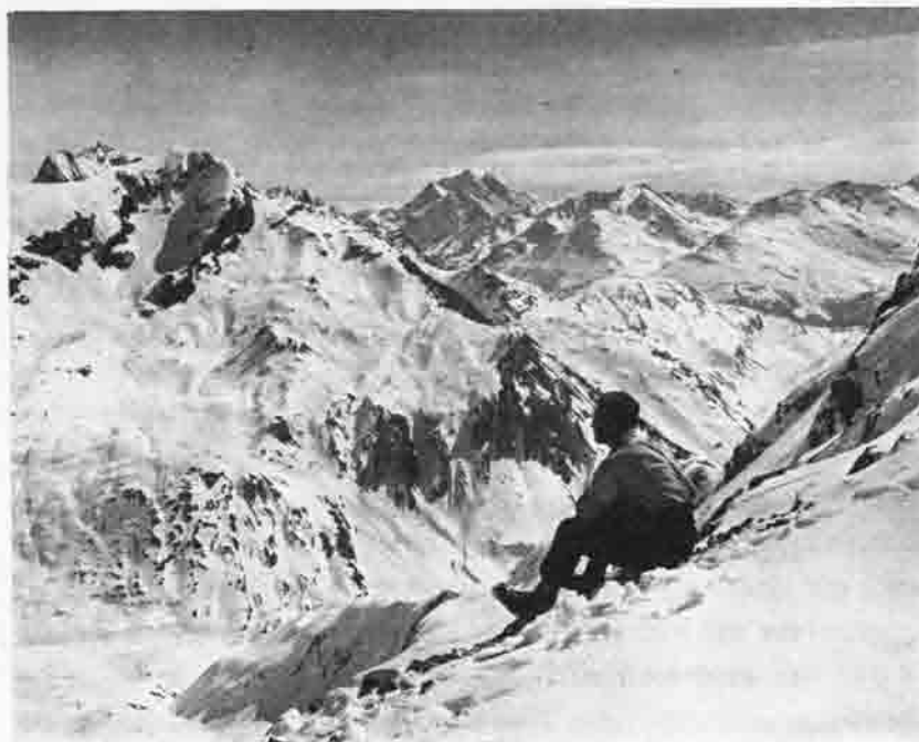
Blick vom Grubenjoch gegen Valluga und Riffler