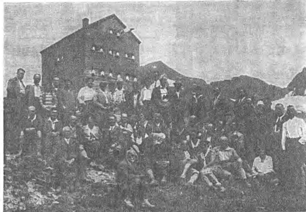
Hütte und Gäste am Einweihungstag; 21. Juli 1929.

Als Arbeitsgebiet wurde dem „Verein Sudetendeutsche Hütte“ die Granatspitzgruppe zugewiesen. Hier galt es nun, einen für den Bau und den Betrieb einer Hütte geeigneten Standort zu finden. Vorarbeit hatte schon die Sektion Kiel gelistet, die im gleichen Gebiet im Jahr 1927 eine Hütte bauen wollte. Man nutzte die Erkundungsergebnisse der Kieler aus und fand dann auch einen lawinsicheren Standort. Am 16. Juli 1929 wurde mit Andrá Stei-