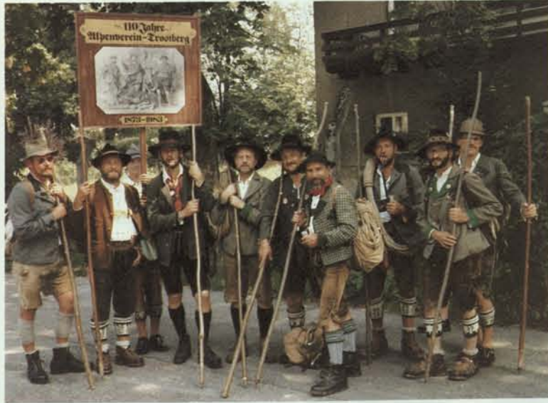
Die Darstellung der Gründungsmitglieder dürfte diesen gestandenen Mannsbildern in ihrer altertümlichen Bergsteigerkluft wohl nicht schwergefallen sein.