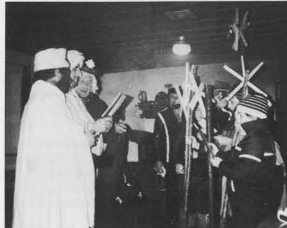
Hl.-Dreikönig-Feier auf der Hütte