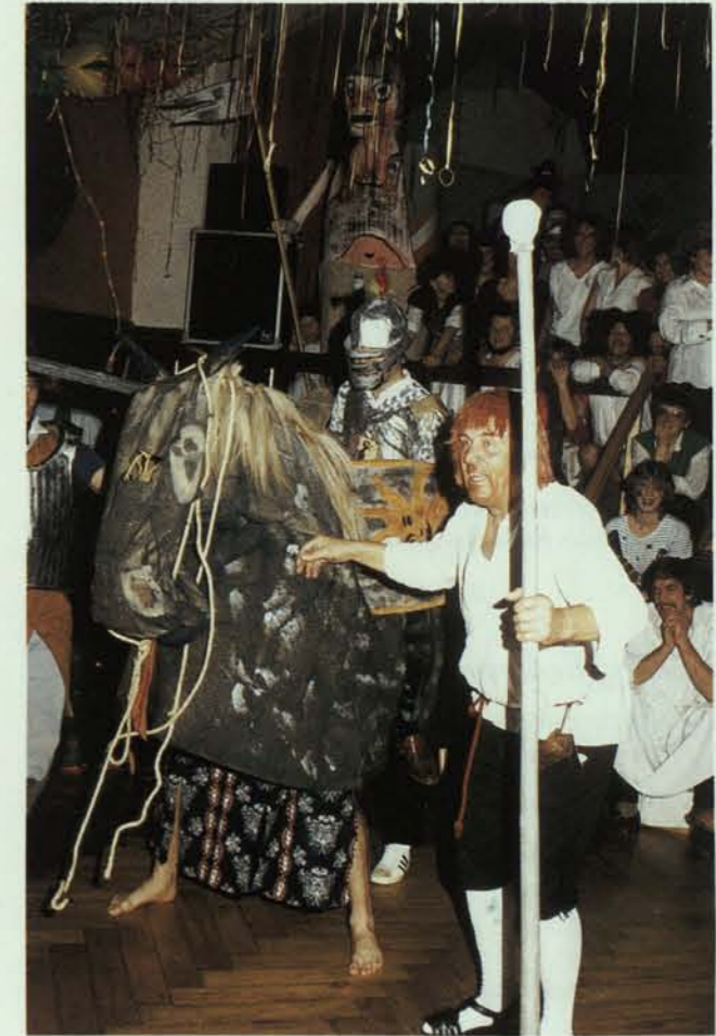
Unter dem gestrengen Blick des alten Pienzenauer – auf geht's ins Turnier!