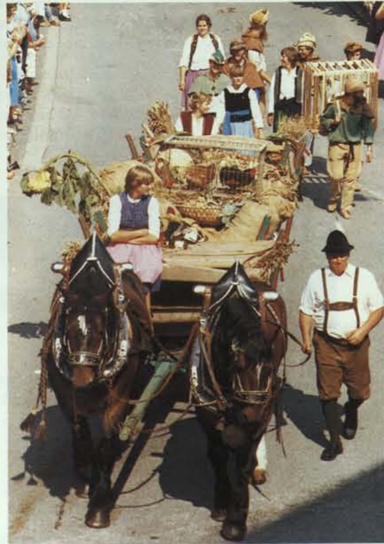
Bauern bei der Zehentabgabe an die Obrigkeit.