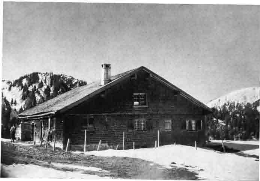
Ski-Stützpunkt Alpe Birkach (1340 m) 1 Stunde ab Gunzesried-Säge, ganzjährig offen für Selbstversorger, Ausgangspunkt vieler lohnender Wanderungen und Skifahrten, Nagelfluhkette, Große Hörner-Tour. — Blick auf Riedberger Horn.