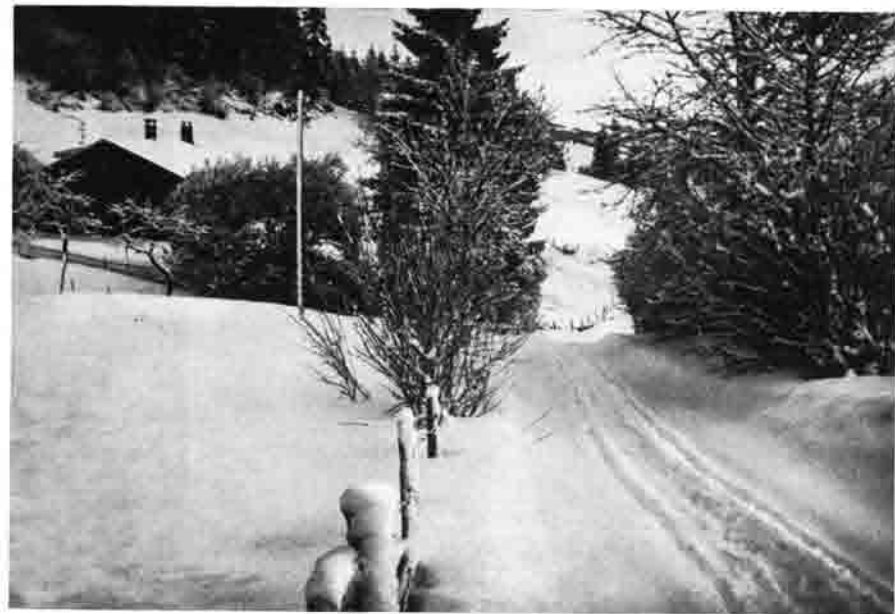
Alpe Reute , 20 Minuten ab Gunzesried, auch mit Pkw erreichbar. Bergheim für Familien, ganzjährig für Selbstversorger, Gasthaus im Ort, prachtvolle Rundsicht, gemütliche Wanderungen zum Tobel, auf den Mittag und Steineberg. — Blick zum Iseler.