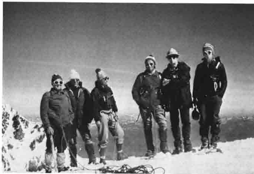
Auf dem Gipfel der Königsspitze

Sonntagmorgen, 4 Uhr. Aufbruchstimmung. Weckergerassel (Willi), Stiefelgetrappel, Rucksackgepacke. Schon verteilt der Wirt Teewasser. Gegen 5 Uhr verlassen die Letzten (die Tutzinger, wie immer) die Hütte.