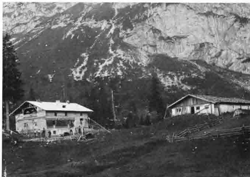
Bau der Tutzinger Hütte 1907

So ein „weltweites“ Echo fand damals unsere „Benewand“.