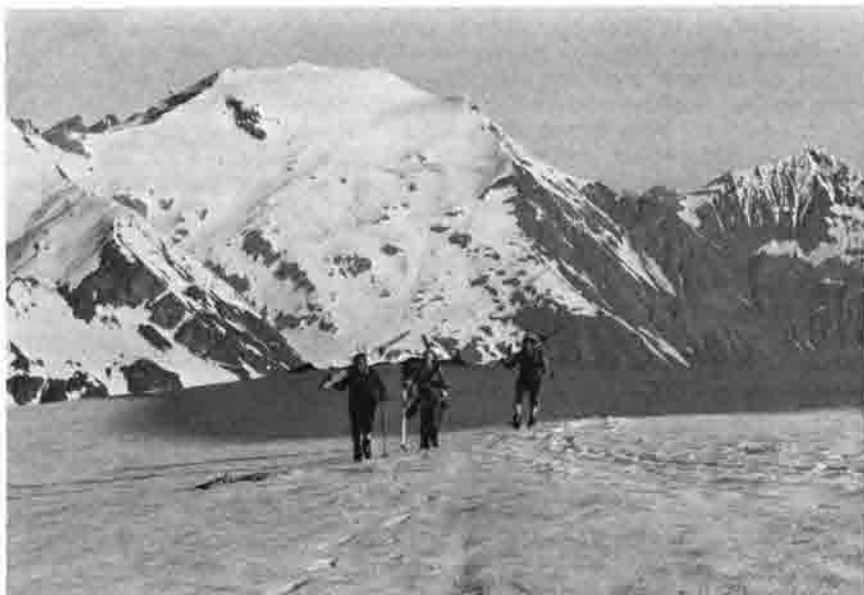
Aufstieg zum Schareck, im Hintergrund Hocharn

Im März standen zwei Unternehmungen auf dem Programm, das Wilde Hinterberg mit 3288 m im Stubai und der Sektionslauf am Osthang der Benediktenwand. Für die Stubaitour war unser Stützpunkt die Franz-Senn-Hütte. Nach dem Hüttenaufstieg gingen wir noch auf die rund 3000 m hohe Kräulscharte, die uns bei starkem