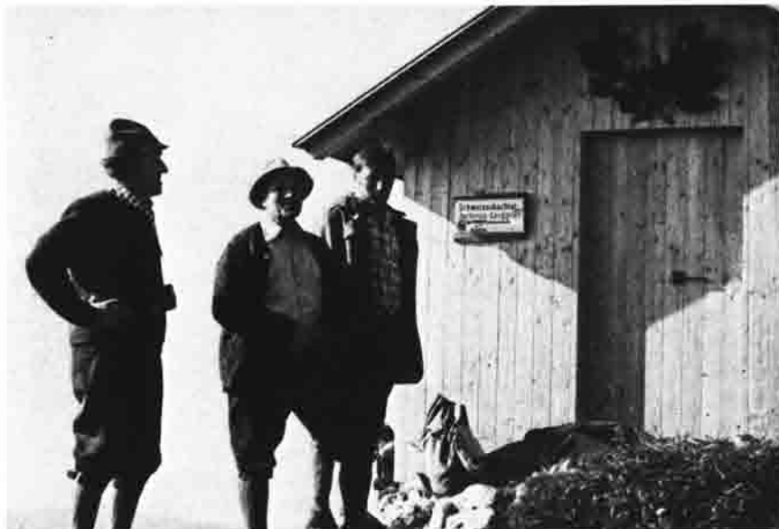
Bei der Einweihung der neuen Gipfelhütte

1926 erzwangen Schäden eine teilweise Erneuerung. Die Katastrophe aber kam im Kriegsjahr 1942: Zwei Buben von 14 und 16 Jahren nahmen aus der Tutzingener Hütte Zündhölzer mit, um bei der Übernachtung am Gipfel Feuer machen zu können. Sie bemerkten zu spät, daß sich das Feuer in der Gipfelhütte ausbreitete: Sie wurde ein Opfer der Flammen.