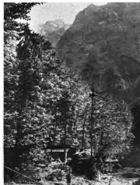
Welserhütte in der hinteren Hezau

Herr Baron Herring und sein uns gutgesinnter Verwalter stellten uns 1914 erprobte Wegarbeiter zur Verfügung, aber als gerade die Arbeiten im schönsten Gange waren, fiel ein herber Tropfen in den Freudenbecher. Die braven Arbeiter, junge, kräftige Menschen, es waren Krainer, von denen vielleicht mancher nicht mehr zurückkam, mußten ihr Werkzeug mit dem Gewehr vertauschen.