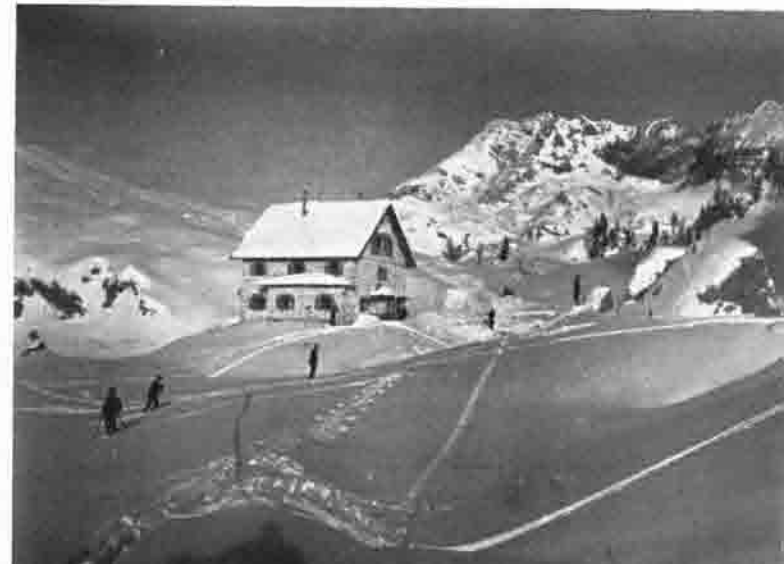
Pühringerhütte mit Rotgshirn, 2257 m

In einer weiteren halben Stunde stehen wir vor der Pühringerhütte, einer Zufluchtsstätte, wo das Menschenherz vergessen und ruhen kann. Trotz der 1703 Meter Höhe befindet sich um die Hütte ein Almboden, wie man ihn im Tale nicht üppiger finden kann. Der ganze Blumenzauber, vom Alpenglöklein und Petergslamm angefangen, blühen alle Enzianarten und ganze Flächen von Alpenrosen in üppigster Art, daneben der dunkle, fischreiche Elmsee, in welchem sich der reine blaue Himmel und die kontrastreiche Bergumrahmung spiegeln, und über alles eine Ruhe, die wohlthuend an die Seele greift. — Von allen umliegenden Gipfeln ist im Sommer das 2257 Meter hohe Rotgshirn der interessanteste Berg, auf welchen eine blau markierte Route durch die Westwand führt, hingegen die Gratwanderung eine zum Teil schwierige Klettertour bildet, und wer einen instruktiven Ueberblick auf einen großen Teil des Toten Gebirges wünscht, gehe auf den leicht erreichbaren Wilden Göchl, 2030 Meter.