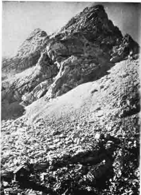
Welserhütte von der Lawine zerstört

So begann in diesem Jahre die Arbeit im Hexautale. Am 13. und 14. März waren wir sechs, vom 25. bis 28. März sieben