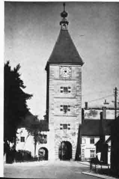
Ledererturm am Stadtplatze

Wels, die Gartenstadt mit der smaragdgrünen Traun, eine der ältesten und bedeutendsten des römischen Norikums, wo uns heute noch gut erhaltene Stücke längst vergangener Zeiten, eine Art gemauerter Chronik zwischen wohlgepflegten Anlagen entgegentritt, wo im Jahre 1519 Kaiser Maximilian I., „der letzte Ritter“, in der gewesenen kaiserlichen Burg die Augen schloß, im letzten Jahrhundert zur Metropole des oberösterreichischen Handels und der Industrie mächtig emporgewachsen, bietet von der stilvollen Marienwarte auch einen herrlichen Aussichtspunkt über die landschaftliche Schönheit von Oberösterreich bis zur Nordkette der Kalkalpen mit ihren Gipfeln und Firmdomen. Eine 47 Kilometer lange Bahn bringt uns zu den schweigenden Wäldern des bergrosenblühen-