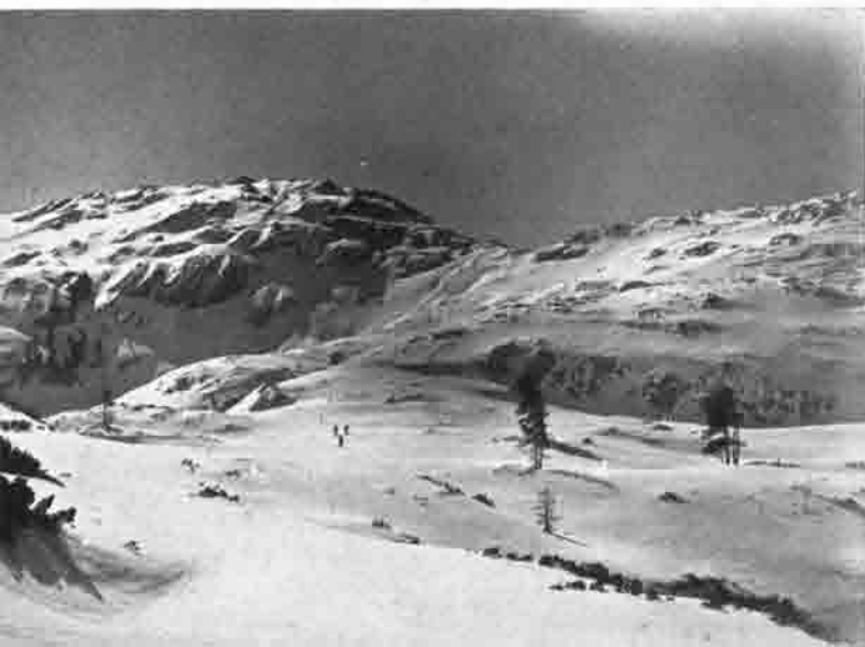
Hochflächen- wanderung zum Steyrersee

Nun aufwärts im weiten Feuertal, in dem manchmal eine Nixe zum Krebsrotkrösten herrscht. Es wechselt Flachlauf mit leichten