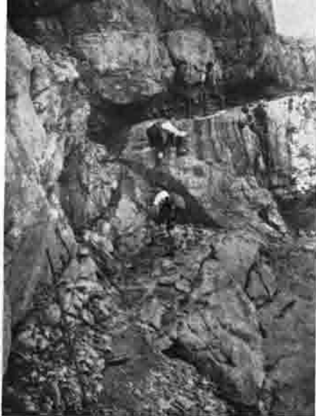
Grieskar mit Ernst-Urbann-Band