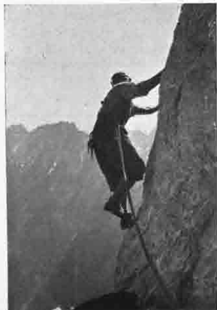
An der Kante des Zwölferkogels

Möge auch bei den Jungmännern der gute Geist weiter in Wort und Tat auf ihren Wegen ein treuer Begleiter sein, sie als gute Fremde in bester alpiner Gesinnung und deutschem Volksbewußtsein zusammenhalten, zur Freude und Ehre der edlen Bergsteigerjache und zu Nutz und Frommen des D. u. De. Alpenvereins.