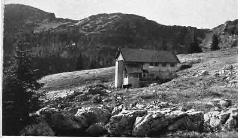
Kasberghütte 1560 m. Schihütte der Sektion Wels des D. u. Oe. A. V.