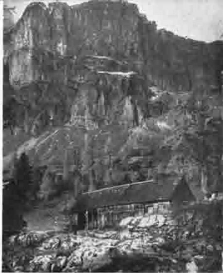
Elmgrube, ehemalige Schutzhütte