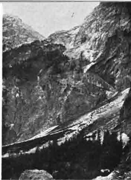
Röll mit Sepp-Huber-Steig