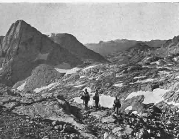
Fleischbanksattel mit Temelberg (2329 m)

Ob wir jetzt eine gemütliche Wanderung durch die florareichen Täler und Bergwiesen, oder auf den Hochsalm, Kasberg oder andere Vorberge unternehmen, oder zu den lichten Höhen des Toten Gebirges, auf schön angelegten markierten Wegen oder schweren Kletterrouten emporsteigen, ob wir bei Sonne und Schnee mit den Skiern über der Vorberge weiten Flächen und tiefverschneiten Almböden gleiten oder durch das schneeige Wellenmeer über unzählige Kuppen und Gipfel auf den Hochflächen des Toten Gebirges in den Fluten der Höhensonne dahinschwelgen, wir werden immer hochbeglückt und befriedigt heimkehren.