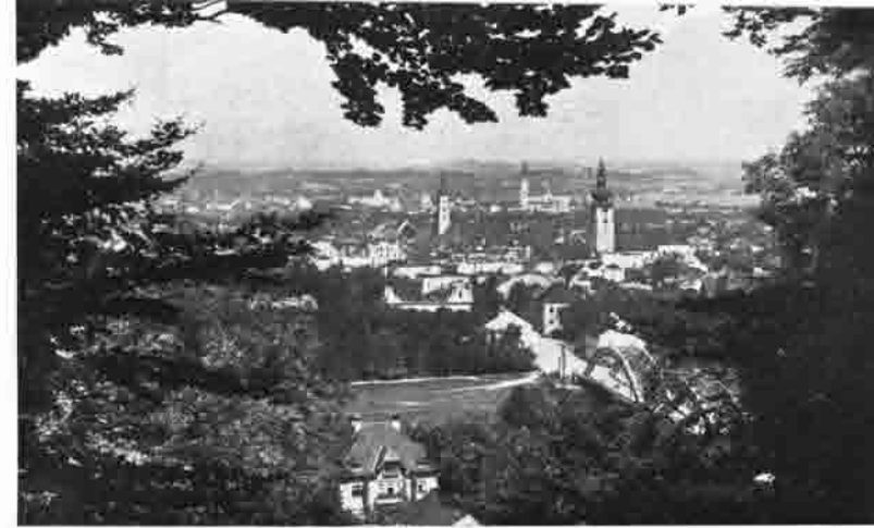
Die Stadt Wels