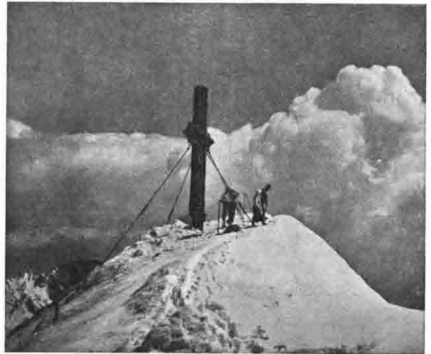
Hoher Friel, 2514 Meter

Höchster Gipfel des Toten Gebirges mit herrlicher Gebirgs- und Talansicht, die vom Schneeberg bis an die Karawanken und vom Böhmerwald und der Bayerischen Hochebene bis zu den Hohen Tauern und zum Kaisergebirge reicht. Ein acht Meter hohes Eisenkreuz (2240 Kilogramm schwer), das im Jahre 1870 errichtet wurde, schmückt diesen hervorragenden Aussichtspunkt. Auf keinen Gipfel im Toten Gebirge führen so viele Anstiegsrouten wie auf diesen; daher bleibt er der meistumworbene, und sein Titel „König des Toten Gebirges“ ist damit begründet.