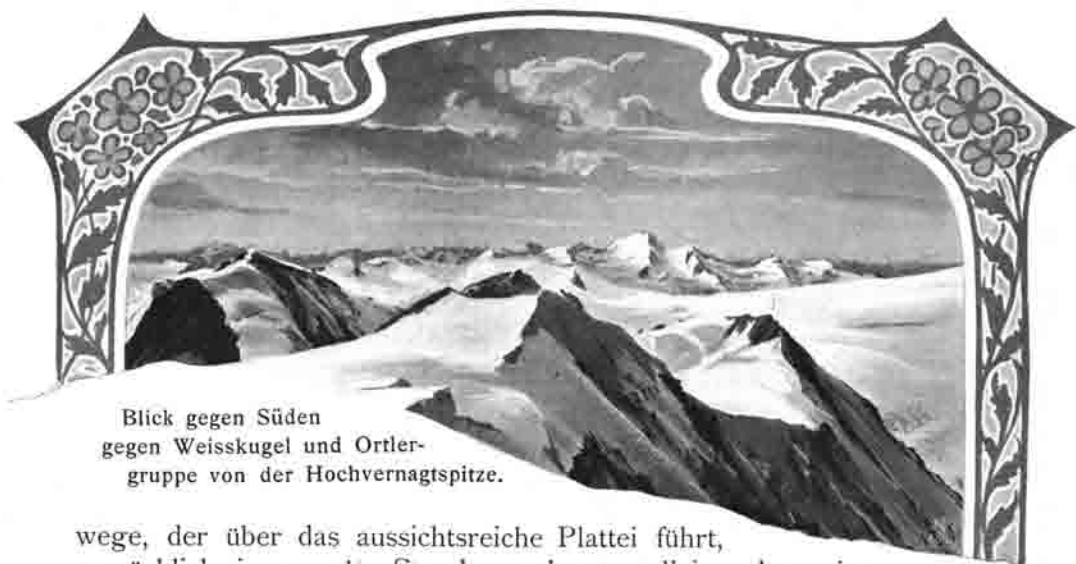
Blick gegen Süden gegen Weisskugel und Ortler- gruppe von der Hochvernagtspitze.

wege, der über das aussichtsreiche Plattei führt, gemächlich in 3—3½ Stunden gelangt, allein schon eines Besuches wert, und durch die bis 1902 zu vollendende Fortsetzung des Wegbaues bis zum Hochjoch-Hospiz ist die Möglichkeit gegeben, an Stelle des direkt dahin führenden, landschaftlich fast jeden Reizes entbehrenden gewöhnlichen Weges, auf einem Umwege von nur 2 Stunden einen wirklichen Genuss sich zu bereiten. Durch den Wegbau der Sektion Breslau von ihrer Hütte zum Vernagtferner kann die Partie noch erweitert werden. Endlich gestattet ein anderer von der gleichnamigen Sektion vom Taufkaarferner zu deren Hütte angelegter Weg eine direkte Überquerung des centralen Ötzthaler Gebirgszuges von Mittelberg im Pitzthal über die Braunschweiger Hütte—Taufkaarjoch—Breslauer- und Vernagthütte—Hochjochhospiz—Hochjoch—nach Kurzras im Schnalserthal, eine Höhenwanderung, welche, reich an wechselvollen und grossartigen Bildern, derartig anderwärts Geschaffenem würdig zur Seite sich reiht, ja dies wohl vielfach noch übertrifft. Allerdings macht der Übergang über den Mittelbergferner die Mitnahme eines Führers notwendig und auch bei Querung der Zungen des Rosenkaar-, Vernagt- und Guslarfernens ist, der Zerklüftung wegen, ein solcher für die meisten kaum entbehrlich.