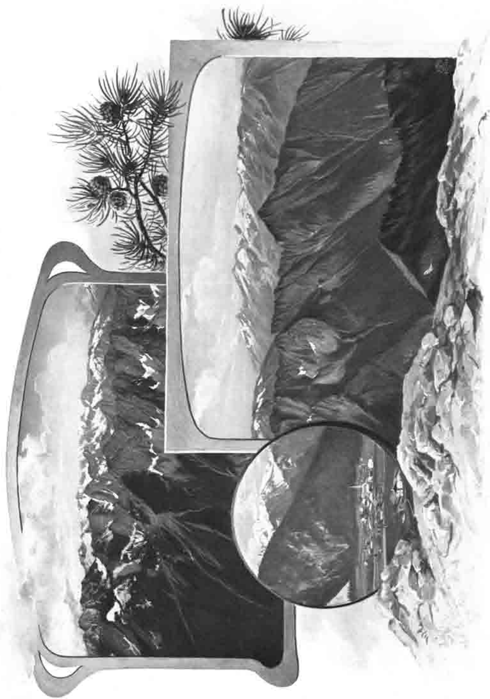
Südpanorama der Ahornspitze. Mayrhofen.