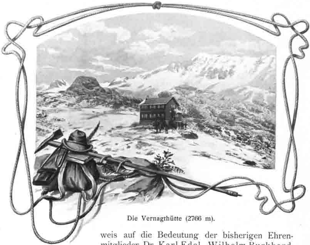
Die Vernagthütte (2766 m).