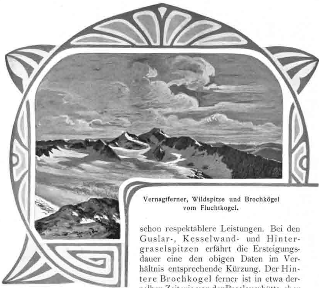
Vernagtferner, Wildspitze und Brochkögel vom Fluchtkögel.

schon respektablere Leistungen. Bei den Guslar-, Kesselwand- und Hintergraselspitzen erfährt die Ersteigungsdauer eine den obigen Daten im Verhältnis entsprechende Kürzung. Der Hintere Brochkögel ferner ist in etwa derselben Zeit wie von der Breslauerhütte, eher