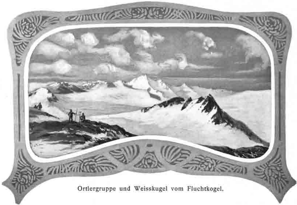
Ortlergruppe und Weisskugel vom Fluchtkogel.

im Mantel erwärmten Luft den Austritt gestattet und damit die Temperierung jener Gemächer ermöglicht. — Nachdem die Hütte ohnehin eine sehr geschützte Lage hat, so dürfte die geschaffene Heizvorrichtung völlig genügen.