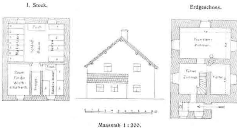
Grundriss und Schnitt der Edelhütte.

unter Dach gebracht und im Frühsommer 1889 völlig fertig gestellt, so dass dieselbe der Benützung übergeben werden konnte. Die Edelhütte ist ganz aus Stein gebaut und hat ein Holzschindeldach. Im Erdgeschoss befindet sich gegen Südwest gelegen, der Eingang als kleiner Vorbau, im Hauptbau ein Führerraum, eine geräumige Küche und ein grosses Speisezimmer. Über einer Stiege ist der allgemeine Schlafräum, abgeteilt in Betten und Matratzenlager, ein Damenzimmer und eines für die Wirtschafterinnen. Im oberen Boden sind Lagerstätten für die Führer. Im ganzen sind 7 gute Betten und 7 Matratzen für Touristen vorhanden. Die Schlafräume sowohl als das Speisezimmer sind mit Zirbelholz veräfelt und machen einen reinlichen und freundlichen Eindruck. Die Baukosten der Hütte beliefen sich auf Mk. 5950.—, die für die innere Ein-