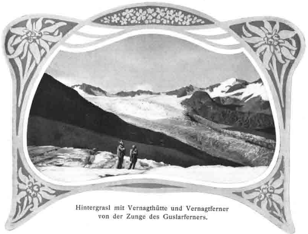
Hintergrasl mit Vernaghütte und Vernagtferner von der Zunge des Guslarferners.

Mk. 3500.— und die vom Gesamtvereine gewährte namhafte Subvention von Mk. 8000.— (Mk. 4000.— für die Hütte und ebensoviel für Wege). Dürfte diese Summe auch nicht völlig hinreichen zur Bestreitung der Ausgaben, so wird der mutmassliche Mehrbedarf von Mk. 1000—2000.— aus laufenden Mitteln wohl unschwer Deckung finden. —