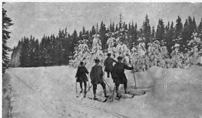
Ski-Wanderung bei Steinbach i. Erzgeb.

leben aufrecht durch die 1919 auf Dienstag verlegten Zusammenkünfte, die zum Grundstock geworden sind unserer jetzt so beliebten und stark besuchten Stammtischabende. Die Not der Geldentwertung setzte ein. Der Vereinsbeitrag, bisher 10 M, mußte erhöht und dann durch Satzungsänderung so beweglich gestaltet werden, daß der Vorstand »weiteren Aderlaß« von den Mitgliedern fordern konnte ohne besonderen Beschluß der Hauptversammlung. Die ganze Nullenplage der Jahre 1922 und 1923 machte trotzdem dem Vorstand manch Kopfzerbrechen und dem Nach-