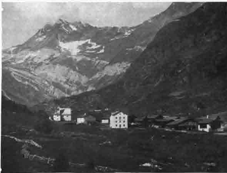
Talschluß von Pfelders.