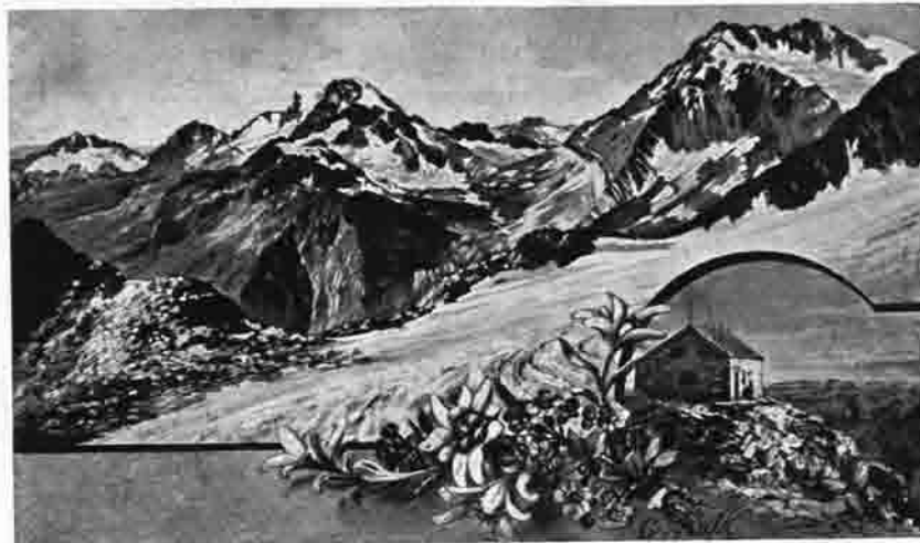
Aussicht von der Zwickauer Hütte nach Süd-West