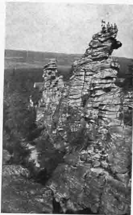
Kletterschule an den Greifensteinen.