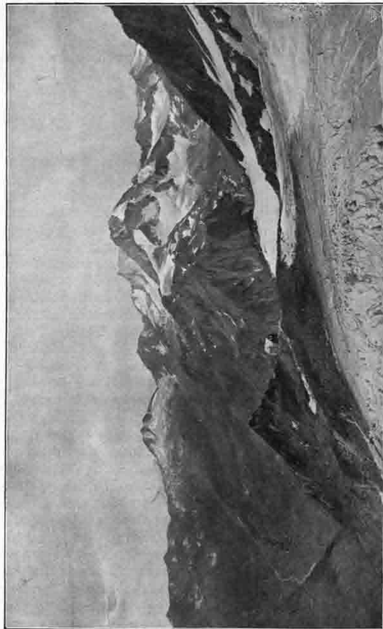
Schnorrplatte gegen Hochwilde.