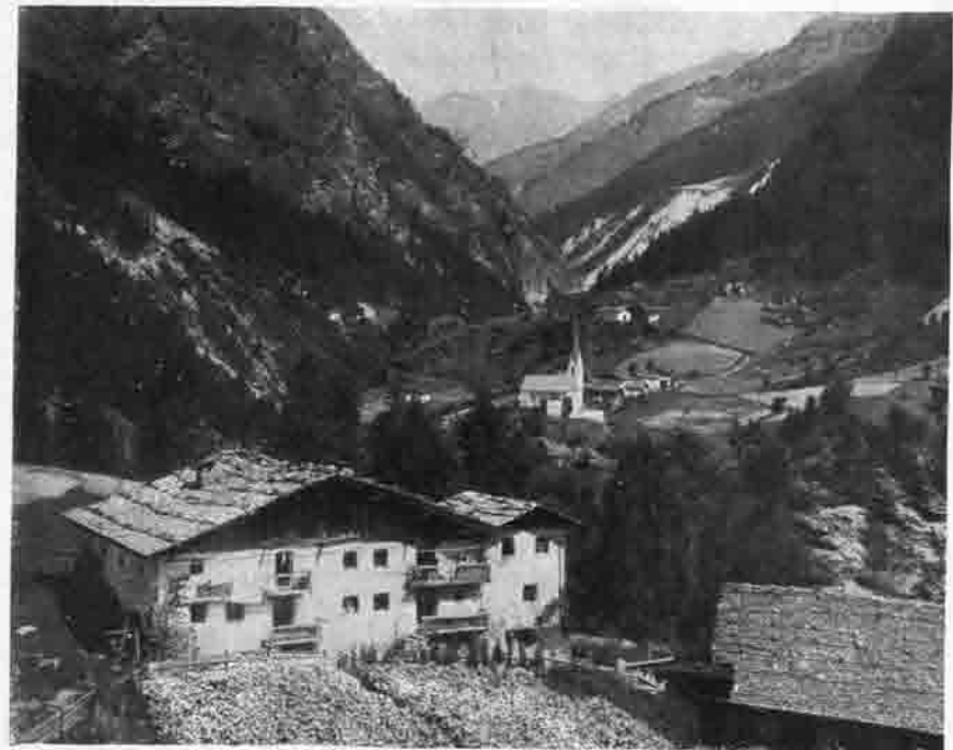
Tal von Moos.

Am 12. Dezember 1886 taufte sich die reichlich zwölfjährige Erzgebirgisch-Vogtländische um auf den Namen Sektion Zwickau, ohne damit spröde zu werden gegenüber Nichtzwickern. Nein, neben 63 Freunden aus Zwickau umschloß sie 27 aus Glauchau, 26 aus Auerbach, 8 aus Meerane, 8 aus Schneeberg, 6 aus Crimmitschau, 6 aus Werdau, 5 aus Freiberg (trotz Chemnitz), 3 aus Annaberg, 2 aus Cainsdorf, Lengenfeld und Schwarzenberg, 3 aus Schlema und 13 aus anderen Orten; die größeren hatten einen »Agenten« oder, wie sie bald ungefährlicher genannt wurden, einen Vertrauensmann. Die Annaberger machten sich am 27. Mai 1887 selbständig (mit 27 Mitgliedern als 148. Sektion). 1893 feierten Mutter und Tochter das Wiedersehen mit einem »Stelldichein auf der Morgenleite«, dem in Schwarzenberg ein »gemeinschaftliches Diner« angefügt wurde. Unterdessen war dem im Vogtland so wachsenden alpinen Gedanken eine neue Pflegestätte erstanden in der Sektion Ölsnitz, die sich am 26. No-