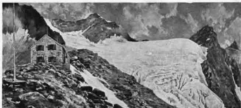
Zwickauer Hütte am Rotmoosjoch, 2989 m.