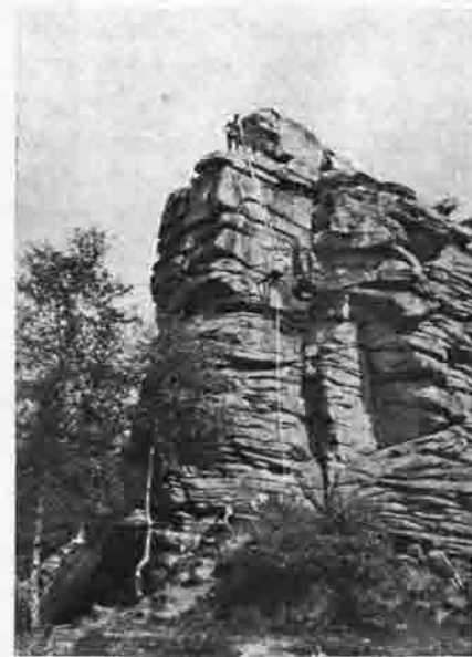
Kletterschule an den Greifensteinen.