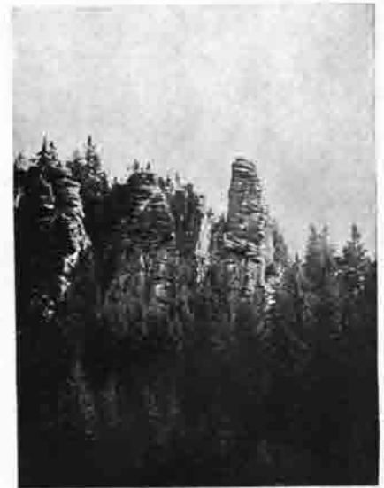
Kletterschule an den Teufelssteinen.