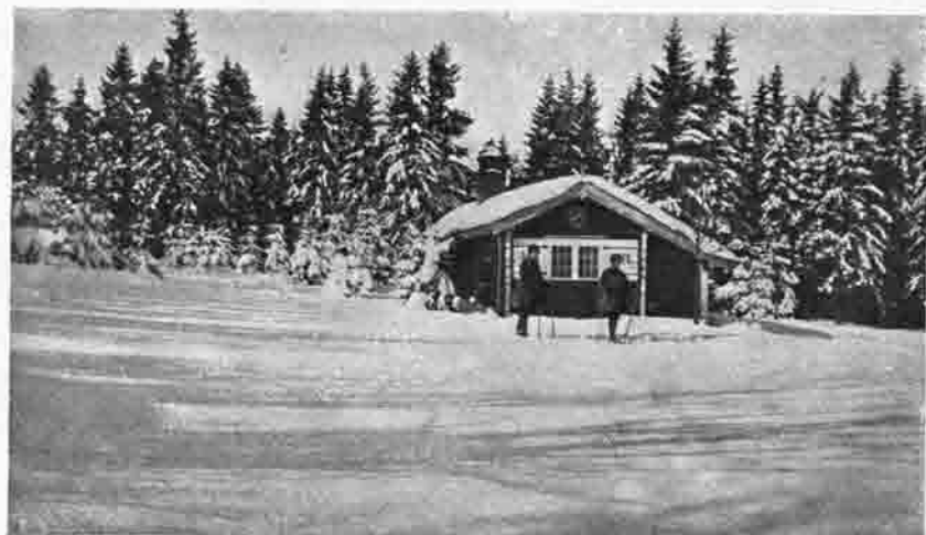
An der Skihütte des A. S. C. Leipzig.

ist. Die Sektion steuerte kräftig für das Rote Kreuz, für die städtische Kriegsnothilfe, für die sichere Kriegsleihe, für die Tiroler Landes schützen. Der Aufforderung des Hauptausschusses — der allein im ersten Kriegsjahre 150000 M für die Kriegsnothilfe ausgegeben hatte — die Hochgebirgstruppen mit alpinen Ausrüstungsgegenständen zu unterstützen, kam auch Zwickau 1915 opferwillig nach. Vollständige Gebirgsausrüstungen, funkelnagelneue Bergstöcke, Eispickel, Steigeisen, Bergschuhe, Kletterschuhe, Schneeeisen, Wickelgamaschen, Feldflaschen, Rucksäcke, Schnee-